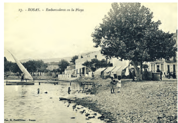
● La mar a tocar la plaça Catalunya. Anys vint. B.FONOLLERAS