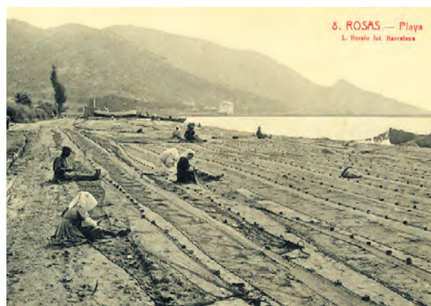
● Dones remendant xarxes. Anys vint. L. ROISIN