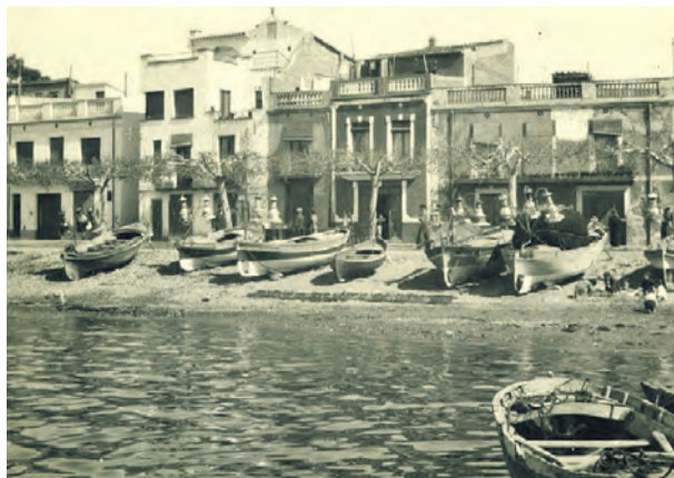
● Barques i cases als anys quaranta.