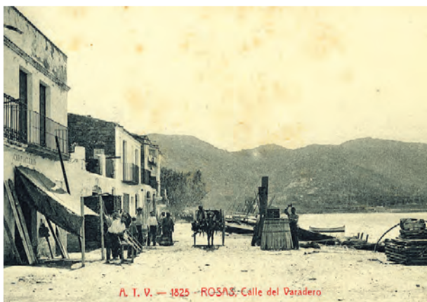
● Imatge de la primera dècada del segle XX. ATV