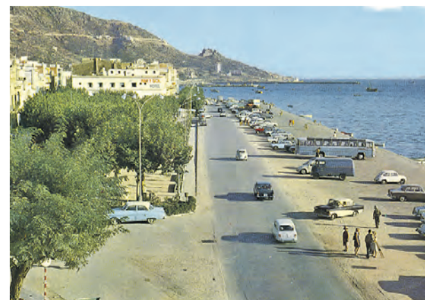
● A punt de fer el salt als anys setanta.