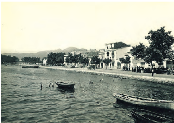
● El passeig de l'antic carrer Ensenada. Anys trenta. L. ROISIN