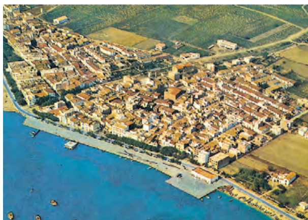
● Vista aèria del nucli i la primera línia de mar, 1963. VALICAR