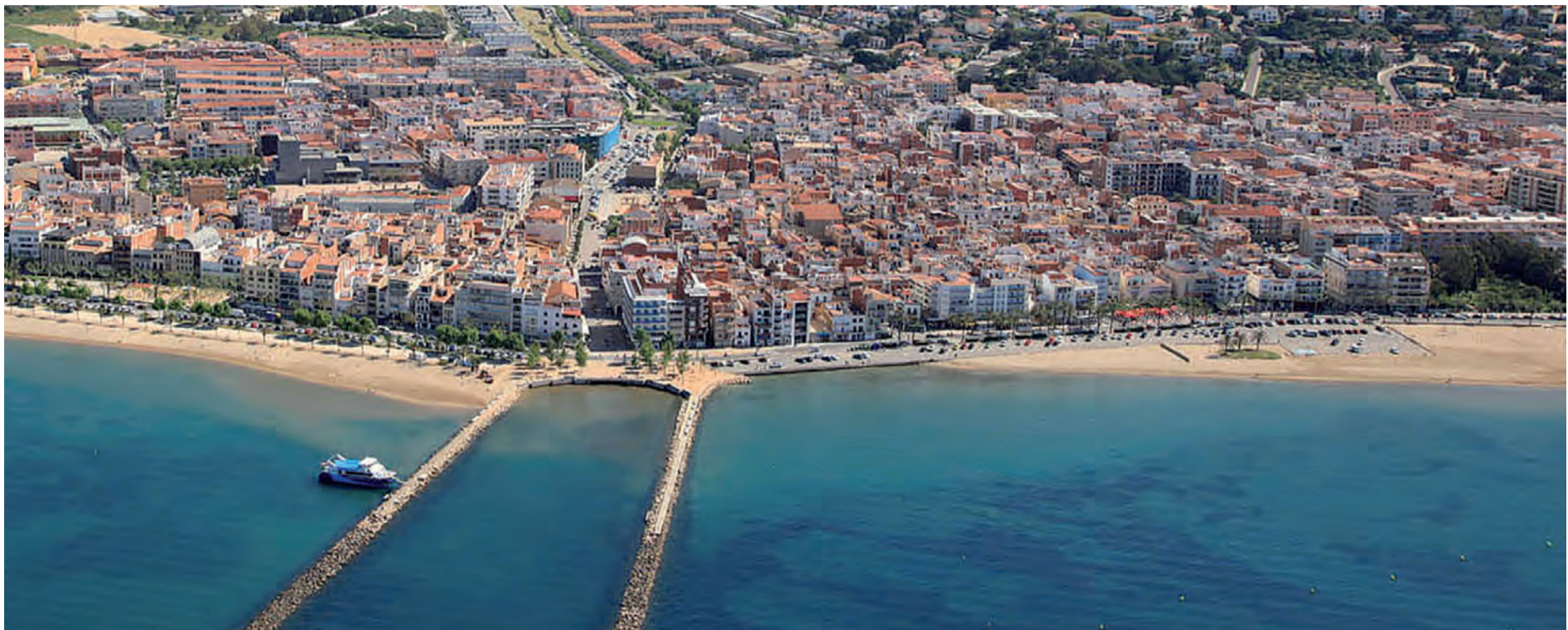
● El front de mar amb la plaça de Catalunya, a l'esquerra, i el passeig marítim urbanitzat i, a la dreta, la platja de la Punta amb l'aparcament i el passeig inacabat.