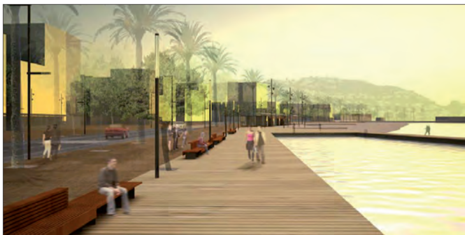
● A dalt i a la dreta, dues perspectives aèries de l'actual aparcament del front de mar. A baix, un esbós de com podria ser el passeig segons el projecte ANERA.