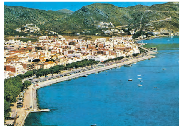
● El front de mar sense platges. Anys seixanta. POSTALES CYP