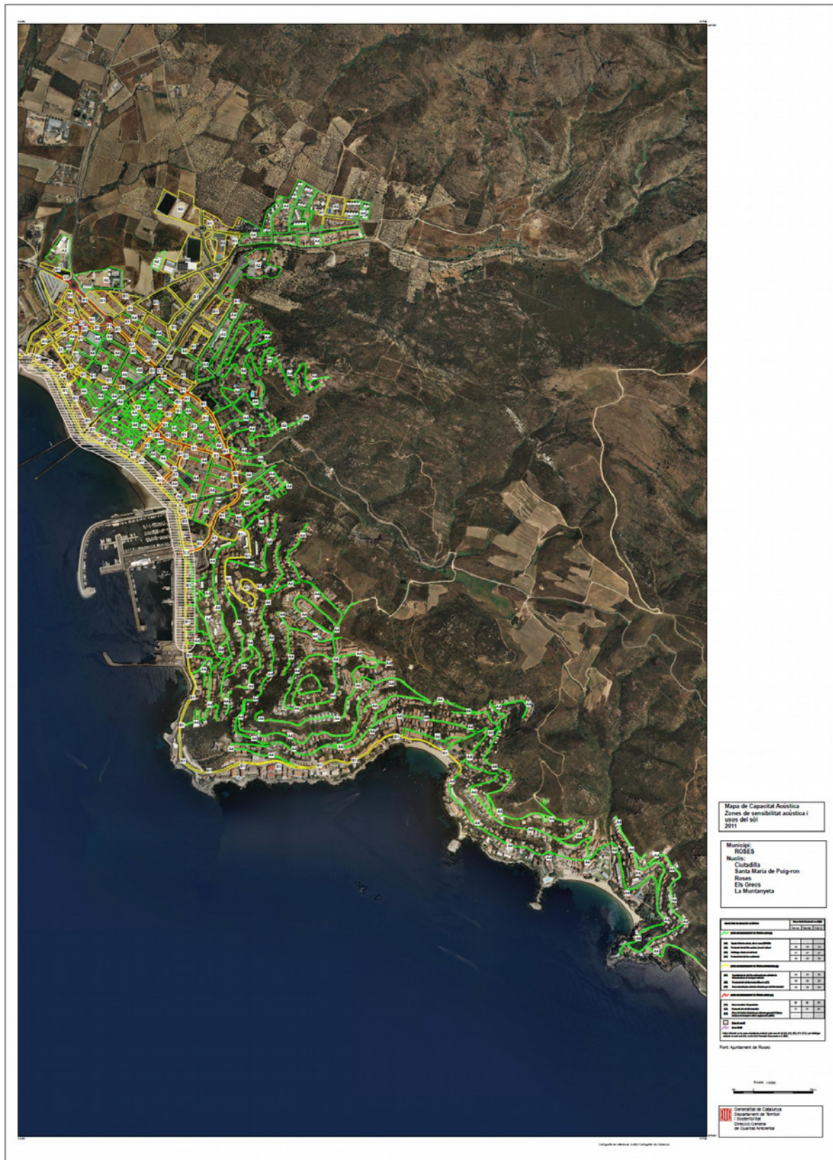
Annex 14. Mapa de capacitat acústica del municipi de Roses.