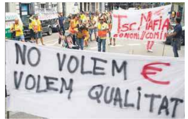
Assistents a la manifestació que va tenir lloc dissabte a Girona en el marc de la vaga indefinida ■ LLUÍS SERRAT

Ryanair és la companyia líder a l'aeroport de Girona i el juliol passat va arribar a transportar un total de 845.524 passatgers en només aquest aeroport. En el moment àlgid va arribar a transportar-ne fins a 2.590.000. ■