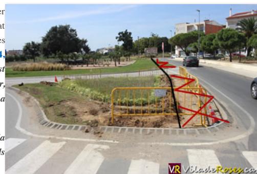
( http://www.viladeroses.cat/wp-content/uploads/2017/09/rotonda_mas_mates.jpg ) La illeta i la rotonda de Mas Mates es retallarà tal i com s'especifica a la imatge

L'execució d'aquesta actuació l'ha està portant a terme el personal de ROSERSA, per la qual cosa no té un termini de finalització de les obres, ja que es porten a terme si no hi ha d'altres actuacions més urgents a la Vila.