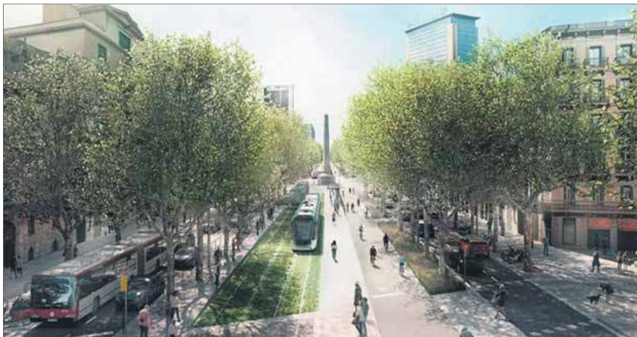
Una recreació virtual de com quedaria el tram de la Diagonal entre Francesc Macià i Glòries amb el tramvia