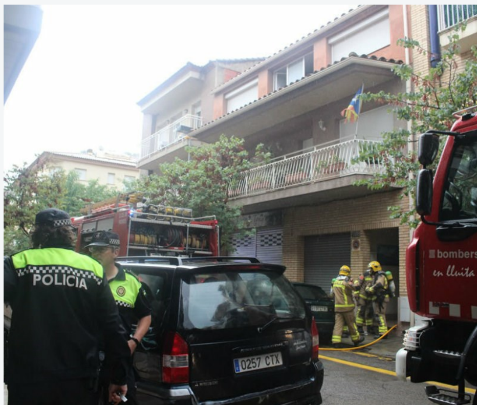
Efectius d'emergència treballen en el número 108 del carrer Puig Rom de Roses, on hi va haver el foc