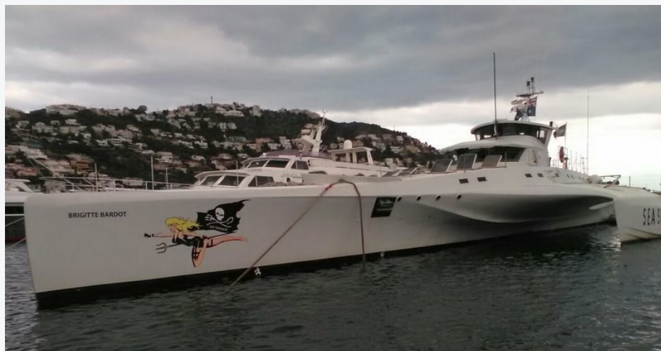
El trimarà 'Brigitte Bardot', a Roses

El trimarà Brigitte Bardot, que pertany a l'organització Sea Shepherd, entitat que es dedica a l'activitat conservacionista de mars i oceans, fa escala aquest cap de setmana a Roses. Aquesta nau de 35 metres participa actualment en una campanya de recollida de xarxes i estris de pesca perduts al mar que amenacen la conservació de la biodiversitat dels fons marí català. Aquest dies estan recollint localitzacions de tot tipus d'aparell o xarxa fantasma, per elaborar un mapa amb els punts i coordenades d'aquests objectes per enretirar-les aquesta tardor. La campanya que recorre França, el Marroc i Espanya, inclou, a més del Brigitte Bardot, dues llanxes ràpides, i vol servir també per sensibilitzar sobre la fragilitat dels fons marins i els esforços que cal fer per mantenir i restaurar el patrimoni natural. En aquest cas l'Ajuntament de Roses, la Confraria de Pescadors de Roses i Port de Roses col·laboren amb la logística de la operació. Demà, diumenge, de deu del matí a cinc de la tarda, tindrà lloc una jornada de portes obertes al trimarà, coincidint amb una recollida d'aliments vegans que es farà al mateix port de Roses.