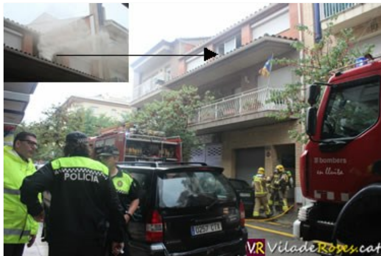
El foc s'ha produït a la segona planta de la casa situada al nº 108 del carrer Puig Rom de Roses

A les 8:45 hores d'aquest matí, els Bombers de la Generalitat han rebut l'avis d'un incendi a la segona planta d'una casa de dues plantes situada al nº 108 del carrer Puig Rom de Roses, tot just enfront on està situat el gimnàs de TKD Joan's.