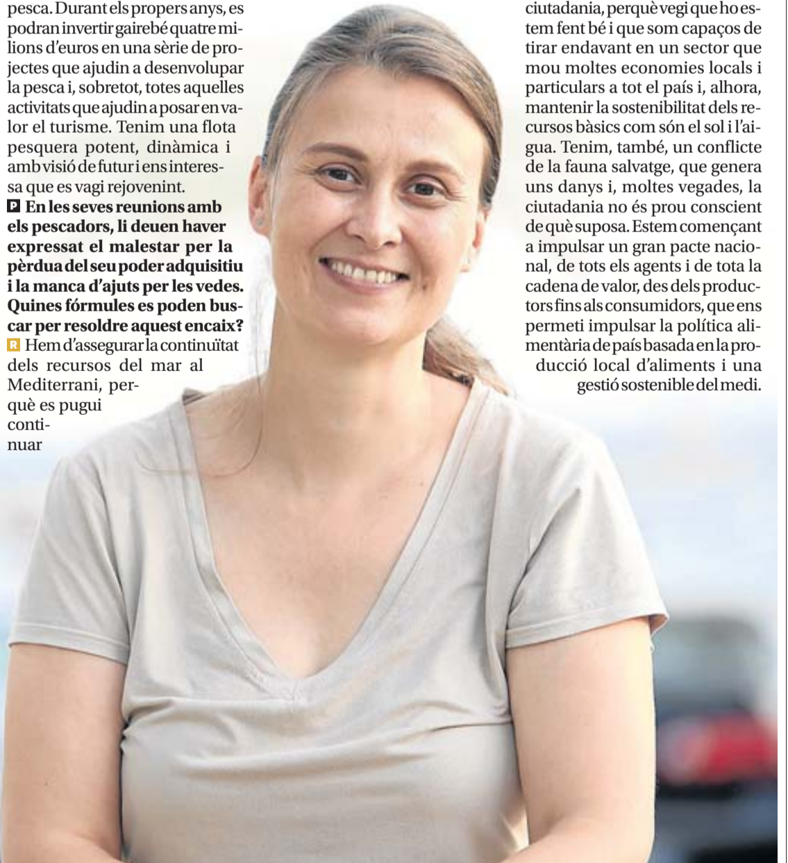
La consellera Meritxell Serret, amb la platja de Roses al fons.

■ De fet, durant aquesta legislatura, hem estat treballant intensament amb el sector agrari per evitar riscos com aquest. Hem tret a informació pública un decret amb mesures concretes per evitar l'excés de purins. En municipis on hi ha més problemàtica, s'establirà una moratòria fins al 1 de gener del 2020 per fer qualsevol mena d'ampliació de granges o nova construcció. Aquest decret pretén impulsar un model on hi hagi més harmonització de l'agricultura i la ramaderia, perquè es faci una millor gestió de les dejeccions. Hem de guanyar-nos la confiança de la ciutadania, perquè vegi que ho estem fent bé i que som capaços de tirar endavant en un sector que mou moltes economies locals i particulars a tot el país i, alhora, mantenir la sostenibilitat dels recursos bàsics com són el sol i l'aigua. Tenim, també, un conflicte de la fauna salvatge, que genera uns danys i, moltes vegades, la ciutadania no és prou conscient de què suposa. Estem començant a impulsar un gran pacte nacional, de tots els agents i de tota la cadena de valor, des dels productors fins als consumidors, que ens permeti impulsar la política alimentària de país basada en la producció local d'aliments i una gestió sostenible del medi.