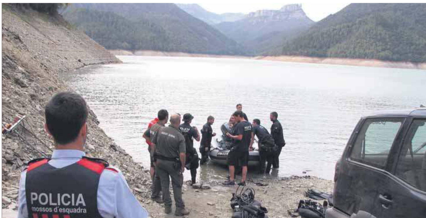
Mossos d'Esquadra, Agents Rurals i Bombers de la Generalitat, en una imatge dels primers dies de recerca al pantà de Susqueda

Des que els equips de recerca van localitzar a Susqueda el cotxe i el caiac de la parella del Maresme desapareguda, no s'ha trobat més pistes. Cap ni una. O sigui, des del 28 d'agost l'equip d'investigació està en un punt d'estancament, ja que no s'ha pogut avançar en cap direcció malgrat els esforços que han fet tant els Mossos d'Esquadra, Agents Rurals, Bombers de la Generalitat, Guàrdia Civil com voluntaris que es van afegir a les tasques de recerca. Això ha provocat que els Mossos d'Esquadra hagin abandonat la recerca activa diària. O sigui, no s'ha suspès del tot, no deixen de buscar al pantà de Susqueda, però a partir d'ara serà de manera intermitent. El que faran ara és rastrejar en zones concretes a partir d'un estudi previ que van preparant els investigadors dels Mossos. De fet, ahir efectius de l'equip aquàtic i agents de l'ABP de la Selva Interior de la comissaria dels Mossos d'Esquadra de Santa Coloma de Farners van estar treballant sobre el terreny malgrat les males condicions meteorològiques que hi havia a la zona del pantà de Susqueda. Tot i la insistència dels especialistes en recerca, altre cop ahir tampoc hi va haver resultats positius i no es va trobar cap nou indici que permeti avançar en la investigació. Tot i així, els Mossos d'Esquadra ja van avançar ahir a aquest diari que continuaran buscant i que, per ara, no s'han marcat cap data concreta per abandonar la recerca. Fonts pròximes al cas van informar, no obstant això, que no es perd l'esperan-