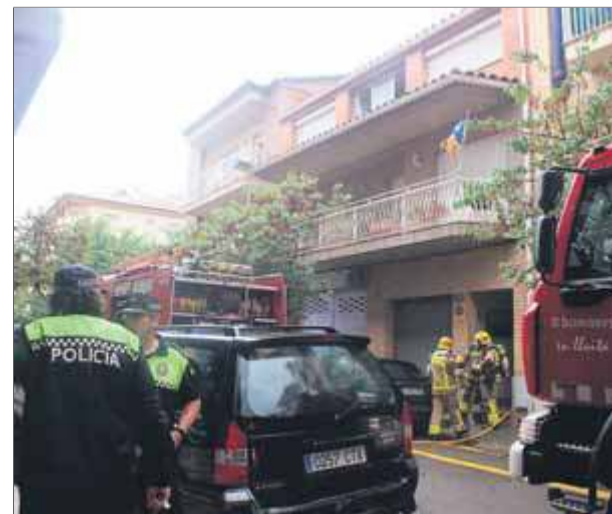
Efectius d'emergència treballen en el número 108 del carrer Puig Rom de Roses, on hi va haver el foc

"He anat a portar el meu fill al col·legi, i l'únic que he deixat encès ha estat la manta elèctrica sobre el llit, i quan he arribat a casa he sentit molta pudor de fum, he intentat apagar el foc, però, en veure que m'ofegava, he avisat la policia", va explicar a Viladeroses.cat l'artista. ■