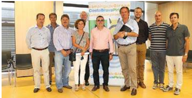
LA JUNTA. Es van reunir al Parc Científic i Tecnològic de la UdG