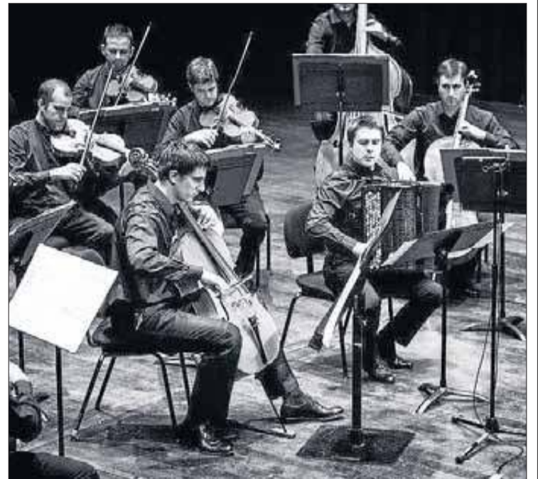
Camerata 432 actua dissabte al vespre tancant el Festival. SCHUBERTIADA

El projecte de la Camerata 432 és força singular. Es tracta d'una