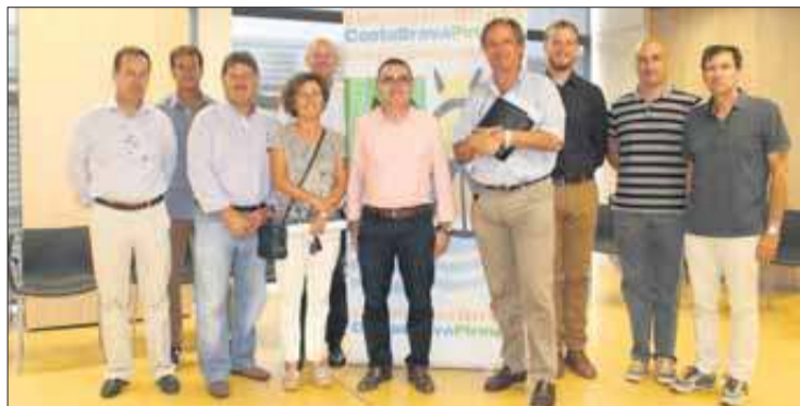
Els representants dels càmpings de les comarques gironines. EMPORDÀ