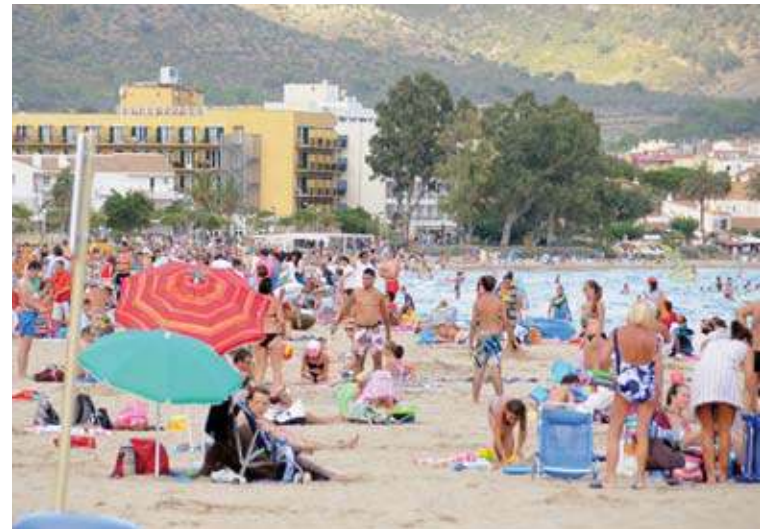
ROSES. La climatologia ha permès que l'agost hagi estat millor que el juliol

Segons les dades de la Federació d'Hostaleria de les Comarques de Girona, el 57% dels visitants han estat estrangers, la meitat dels quals francesos (seguits dels alemanys, els belgues i els britànics). L'altre 43% han estat nacionals, majoritàriament de la província