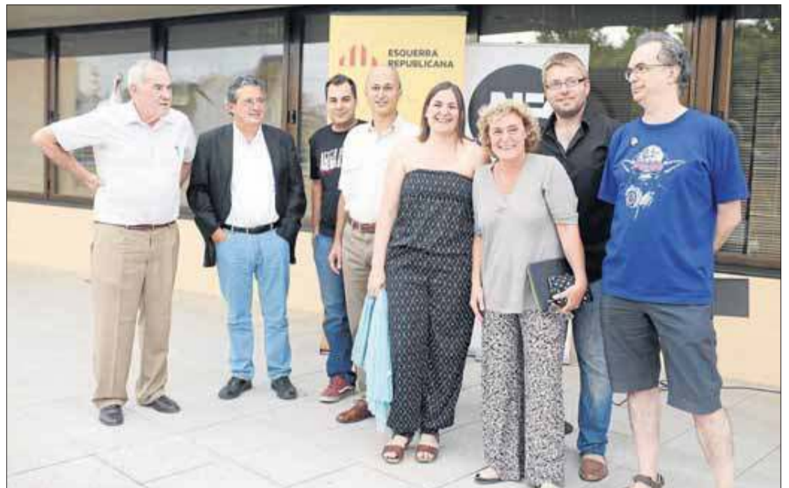
Representants de diferents partits d'esquerres de l'Alt Empordà, en l'acte a Figueres. MONTSENY EMPORDÀ

Compromís, esforç i honestat En aquesta convocatòria, es va fer lectura d'un manifest, titulat La crida , en el qual s'exposa: "Ens comprometem a treballar per res-