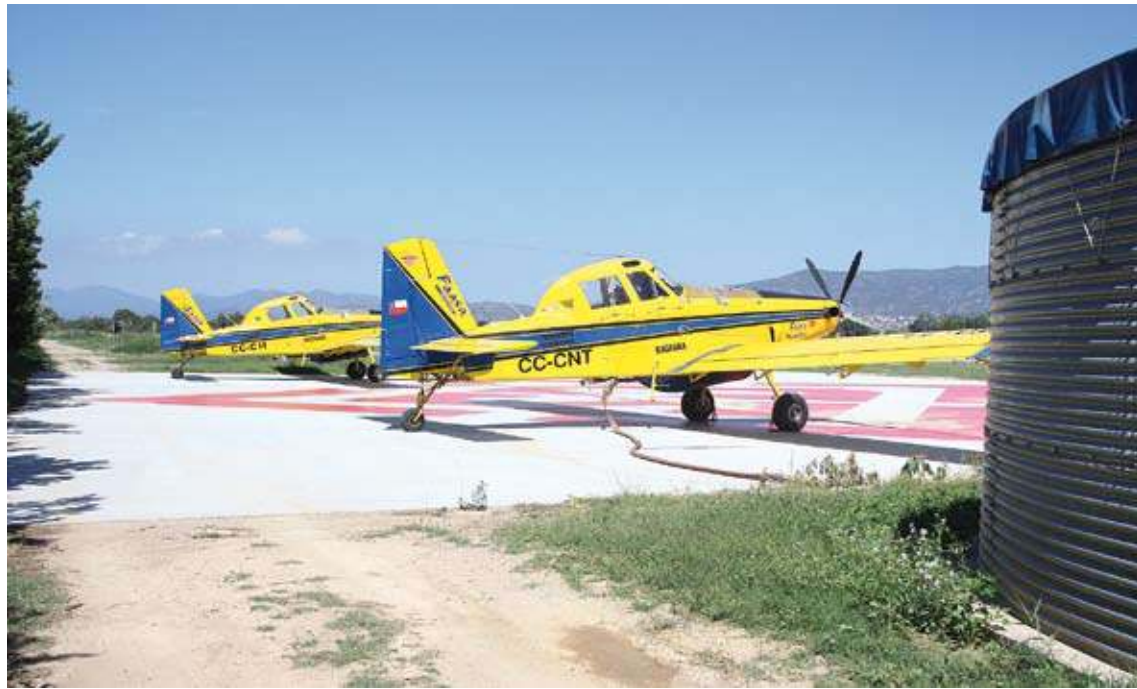
L'AVIONETA (EN PRIMER TERME). Té base a Empuriabrava i sol fer maniobres de manteniment cada tres dies