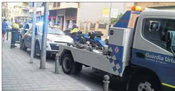
La grua s'endú el vehicle a l'avinguda Salvador Dalí. EMPORDÀ

■ Els Mossos d'Esquadra han detingut un veí de la ciutat de Figueres després que agredís el seu propi germà al bell mig del carrer. Com a conseqüència, li va obrir el cap amb un martell. L'agressor i la víctima, ambdós de nacionalitat gambiana, s'havien barallat abans a l'interior d'un pis del barri figuerenc de la Marca de l'Ham. La víctima, mentrestant, es troba ingressada a l'hospital Josep Trueta de Girona amb un traumatisme cranioencefàlic. REDACCIÓ | FIGUERES