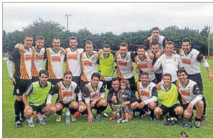
El Vilamalla competirà a Segona per tercer any consecutiu.