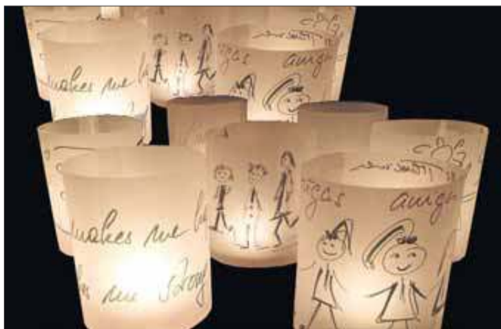
Alguns dels fanalets creats per aquest festival solidari.

tiérrez Arenas. Nascut a Munich però de pares espanyols, és, sens dubte, el violoncel·lista de més gran projecció internacional actualment. El 2010 va debutar amb la London Symphony Orchestra interpretant el Concert d'Elgar , amb un gran èxit de públic i crítica. Acompanyarà a Gutiérrez el pianista Javier Perianes, un dels músics més destacats del panorama concertístic actual. Habitual de la Schubertiada, Perianes va rebre el Premi Nacional de Música fa dos anys. Gutiérrez i Perianes interpretaran peces de Schumann, Brahms, Schubert i Mendelssohn sota el títol L'Arpeggione, violoncel romàntic .