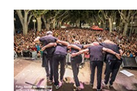
Festival Acústica 2014