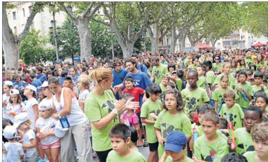
La Rambla va reunir divendres passat, al concert de The Penguins, nens i nenes de tots els casals. M. RIVAS

► Un xàfec sobtat va aigualir momentàniament la festa, que s'estava celebrant a la Rambla, però l'activitat es va reprendre a la plaça Catalunya