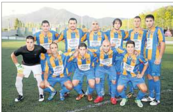
El Roses va arribar fins els quarts de la Copa Catalunya amateur.