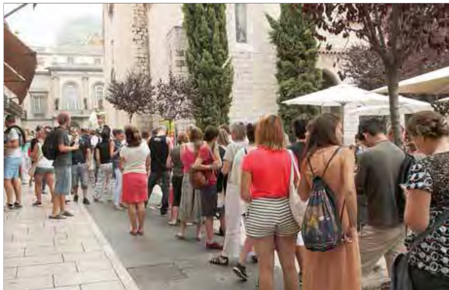
La cua de la gent a l'estiu vol entrar al museu Dalí de Figueres. ■ JOAN SABATER

Llançà i el Port de la Selva—. A Figueres, de l'1 de juliol al 30 de setembre s'han atès 89.479 persones, una xifra que suposa un descens d'un 1,63% respecte al mateix període de l'any passat. El visitant europeu, amb un 66,58%, lidera el rànquing de les persones ateses. En segon lloc hi ha visitants de la resta de l'Estat (12,69%), seguits pels de la resta del món (11,36%) i de Catalunya (9,37%). Els francesos van liderar el rànquing de consultes rebudes, seguits dels russos i dels de la resta de l'Estat.