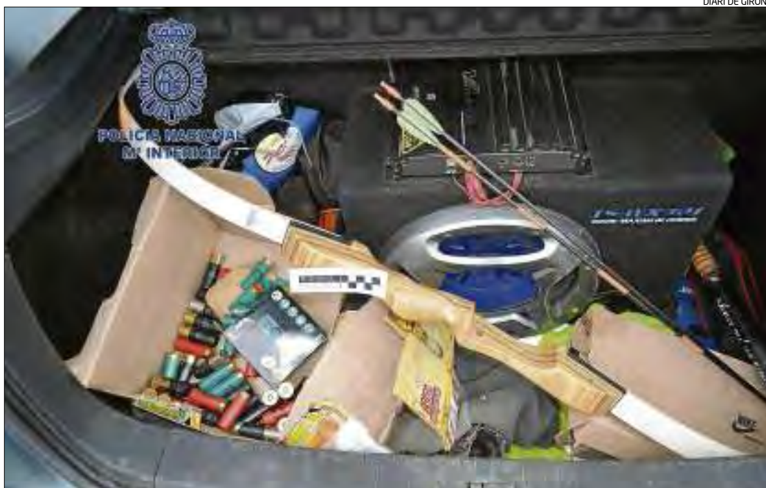
Al maleter portaven l'arc amb les fletxes i els cartutxos de l'escopeta que estava al seient de darrere.

tre totes les oficines s'han facilitat consultes a més de dos-cents mil turistes, i la majoria han estat francesos. En ciutats com Figueres tenen un segon turista que està creient en els darrers anys que és el rus. A Roses, es manté un turisme amb una àmplia presència de visitants europeus. A Vilabertran han triplicat les consultes respecte altres anys. Pel que fa als interessos dels visitants, varien depenent de l'oferta de la població. Mentre a Figueres s'interessen per gastronomia i cultura, a Vilabertran sobretot per la cultura i a la resta, majoritàriament per les activitats que es porten a terme.