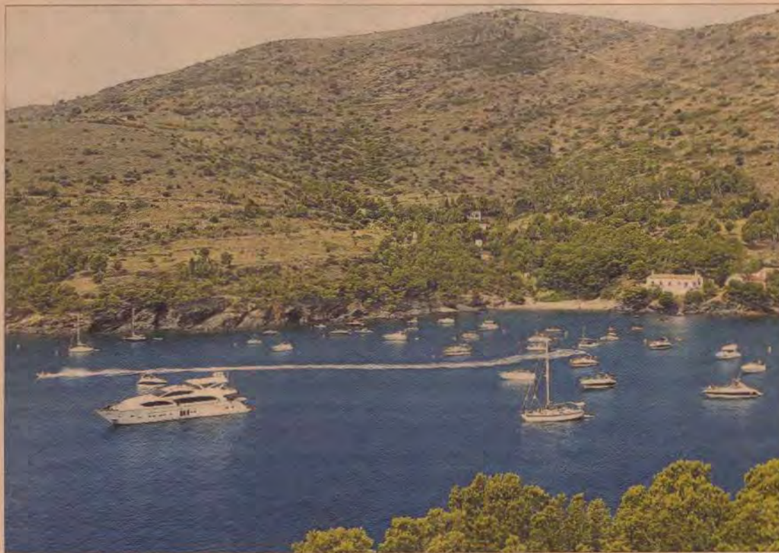
INMA SAINZ DE BARANDA

L'estudi d'afluència de visitants servirà per decidir quina taxa s'implanta al parc natural