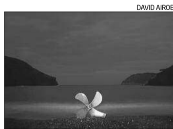
La imatge d'una de les postals.

seus responsables, «estan entre el house, el synth-pop, l'ambient o el pop electrònic i que reviu de forma orgànica l'experiència de la cala. Un exemple d'aquesta unió entre l'art i la natura es troba en els títols de les cançons, noms en llatí d'espècies marítimes i vegetals