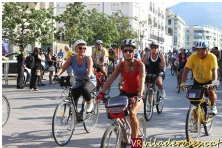
Participants a la XXVII Bicicletada Popular de Roses

La Bicicleta Popular de Roses torna a revifar en quant a participació respecta a edicions anteriors. Si a la pasada edició es va fregar els dos centenars de participants , en aquesta, la que fa 27ena, s'han superat els 300 amb escreix, arribant al voltant de 350 ciclistes, entre petits mitjans i grans els que han volgut participar a qualsevol de les dues curses, la curta o la llarga, que havia previst, com ja es tradició, l'Associació Rosinca de Festes, AROFES, organitzadora de l'esdeveniment.