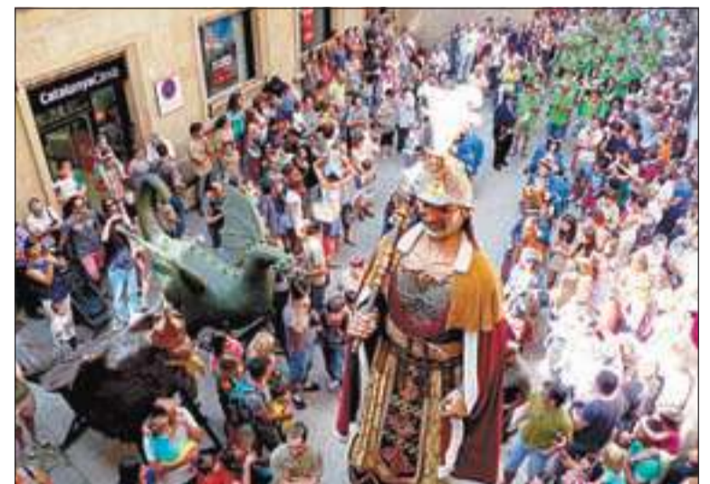
AJUNTAMENT DE SOLSONA