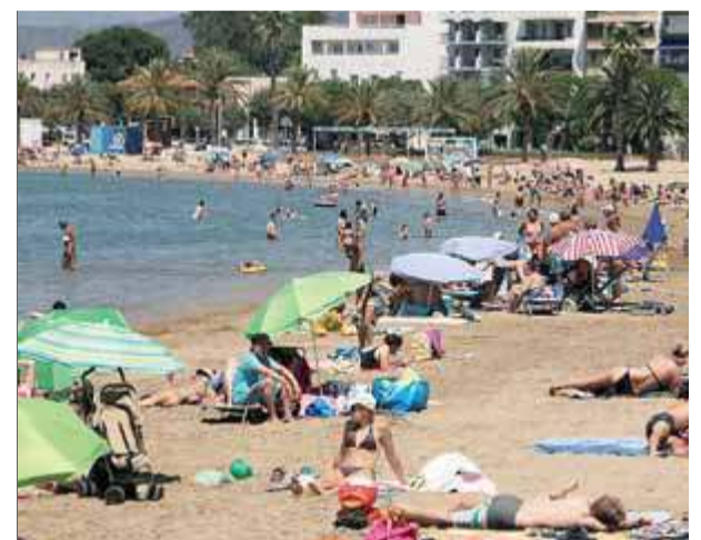
La platja a Roses el mes de juliol passat. Els turistes han fet 60.000 consultes ■ JOAN SABATER

■ Els turistes volen informació sobre el patrimoni cultural rosinc i s'adrecen sobretot a l'oficina del Port Llançanenca