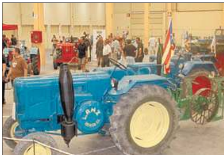
FIRA DE MOLLERUSSA

"L'únic tema que s'haurà de posar damunt la taula és l'estudi de les dades de celebració de la fira", va apuntar Solsona, un assumpte sobre el que va insistir "haurem d'estar molt atents al que ens diu l'expositor per tal de trobar el punt idoni perquè en