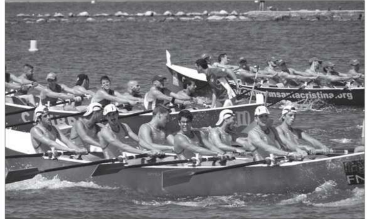
►► La regata en categoria absoluta va estar marcada per l'emoció.