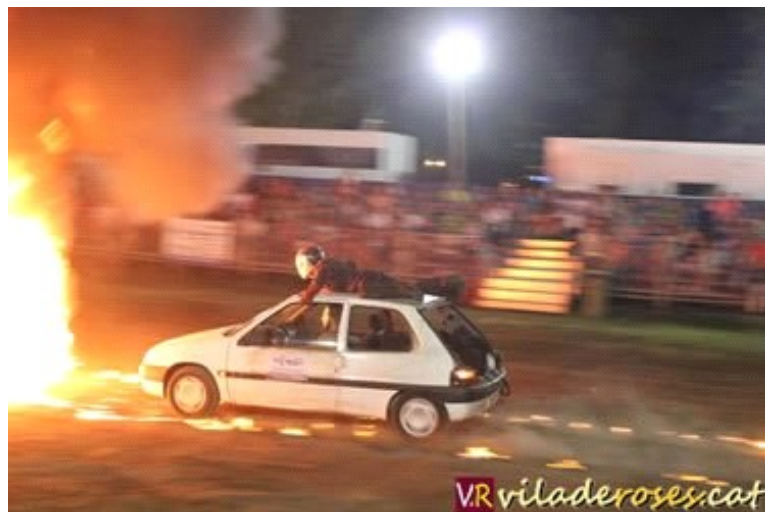
Motor, benzina, foc, i escenes de pel·lícules d'acció

Hollywood Motor-Show "és una empresa d'origen alemany, composta per una vintena de persones, entre d'elles 6 pilots especialistes en doblatge en escenes perilloses del cinema, que ofereix per tot el món el seu espectacle amb cotxe, motos, quads i els americans Monster Trucks ", ens