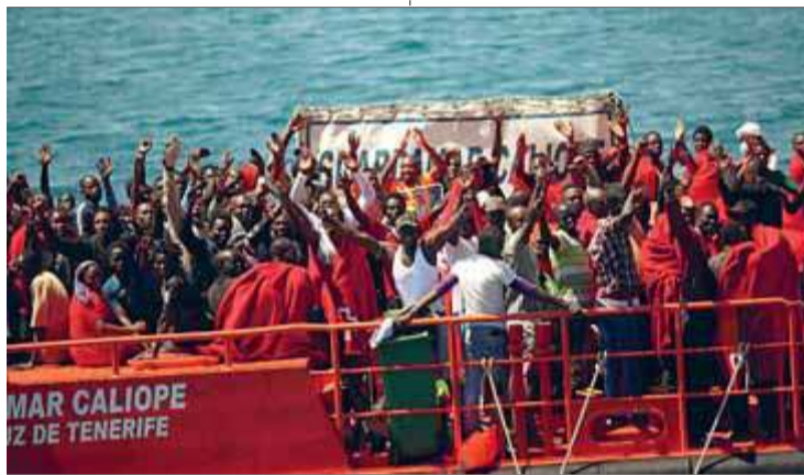
Un grup d'immigrants rescatats quan viatjaven cap a Europa

Quan no et veu ningú, a les nits, somies marxar a Europa. Allà