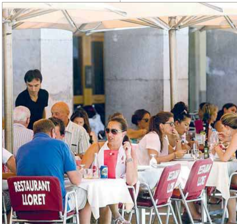
Clients d'un restaurant de Girona, en una imatge d'arxiu

Les ciutats fan com els pagesos, que no estan mai contents. Si hi ha més visitants, aquests consumeixen poc. Si n'hi ha pocs, no s'arriba a complir l'objectiu d'ocupació de les places hoteleres. Mentrestant, el cistell dels ous s'ha trencat per la via dels russos. Tot al mateix cistell no ha estat mai una bona idea, i ara patirem haver confiat en excés en la millora econòmica centrada en els de fora i no pas en el turisme interior, el d'aquí. En canvi, quan es fa promoció interior ens queixem que és massa elitista. Si no, com s'entenen les queixes contra el Vol Gastronòmic i les mofes als promotors del que és un exponent de la millor cuina del món? Mentre escric aquestes ratlles s'està cremant una