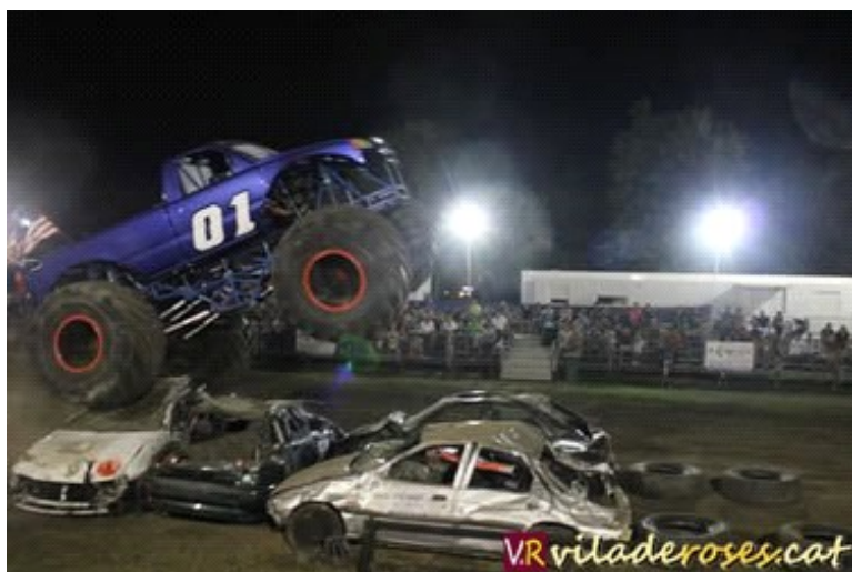
El Monster Truck en acció

I per al final de l'espectacle, que va durar al voltant d'una hora i mitja amb un descans de 10 minuts per beure, menjar i anar al servei, es va deixar els Monster Truck, els vehicles que fan furor a nordamèrica amb 1.400 cavalls de potència que van saltar pe sobre d'uns quants cotxes.