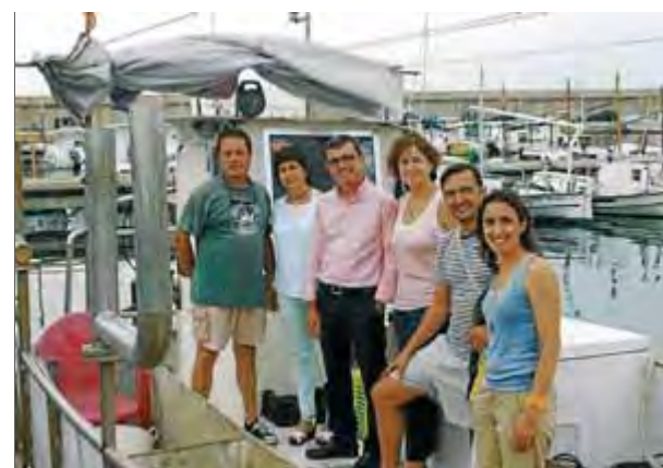
Els impulsors calculen que a l'estiu poden arribar a portar 1.500 turistes en barca ■ ESTACIÓ NÀUTICA ROSES-CAP DE CREUS.

Conèixer la cultura marinera, la tasca dels pescadors i la difusió del patrimoni al voltant del mar, són alguns dels objectius de la nova oferta de Pesca turisme. ■