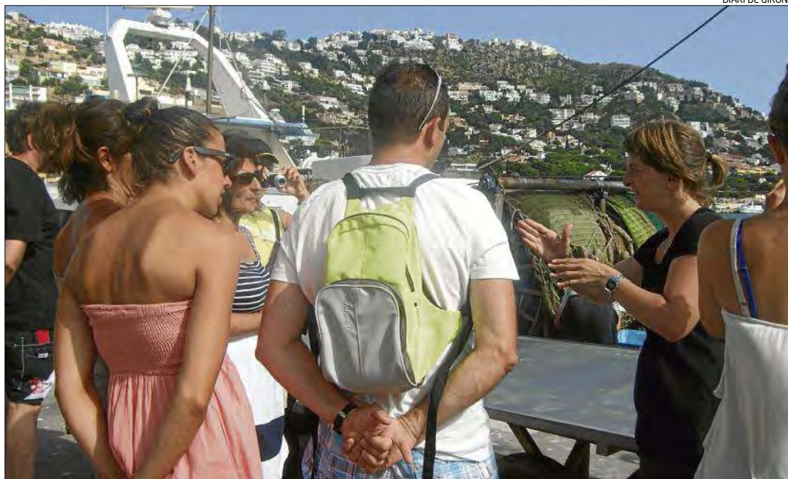
Un moment de la visita al port de Roses, realitzada aquesta setmana.

Així doncs, aquesta setmana s'ha fet la primera visita, que ha es-