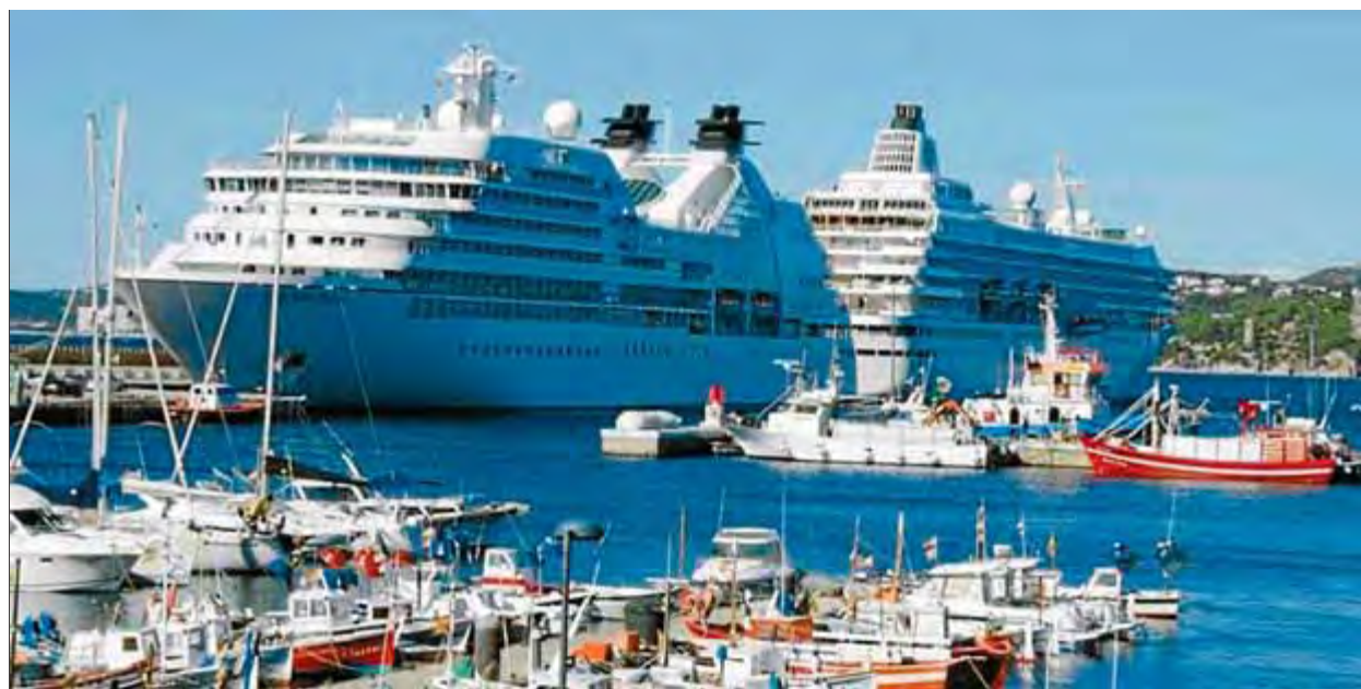
Els dos vaixells van fer escala ahir simultàniament al port de Palamós ■ PORTS DE LA GENERALITAT.

Els vaixells de creuer que fan rutes per la Mediterrània busquen destinacions diferents per als seus pas-