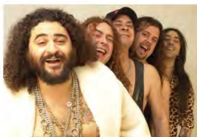
Mojinos Escocios EMPORDA.INFO

Registra't, opina, debat i ajuda'ns a construir el teu mitjà de comunicació preferit.