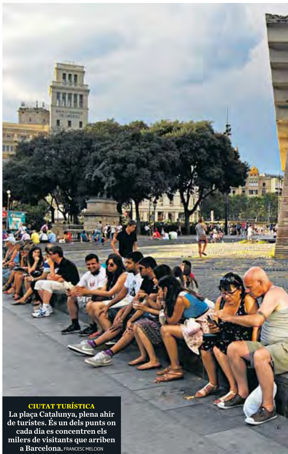
CIUTAT TURÍSTICA La plaça Catalunya, plena ahir de turistes. És un dels punts on cada dia es concentren els milers de visitants que arriben a Barcelona.