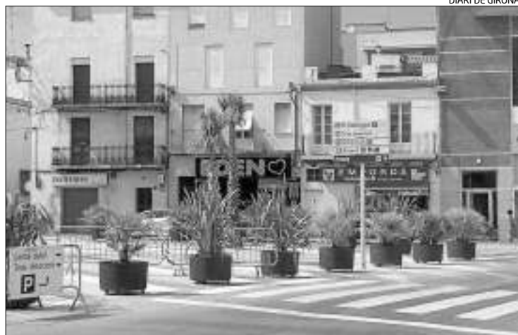
Les indicacions només senyalen la plaça Catalunya a l'esquerra.

► Critiquen que s'indiquen museus i el centre per la Calçada dels Monjos i no pel Concepció