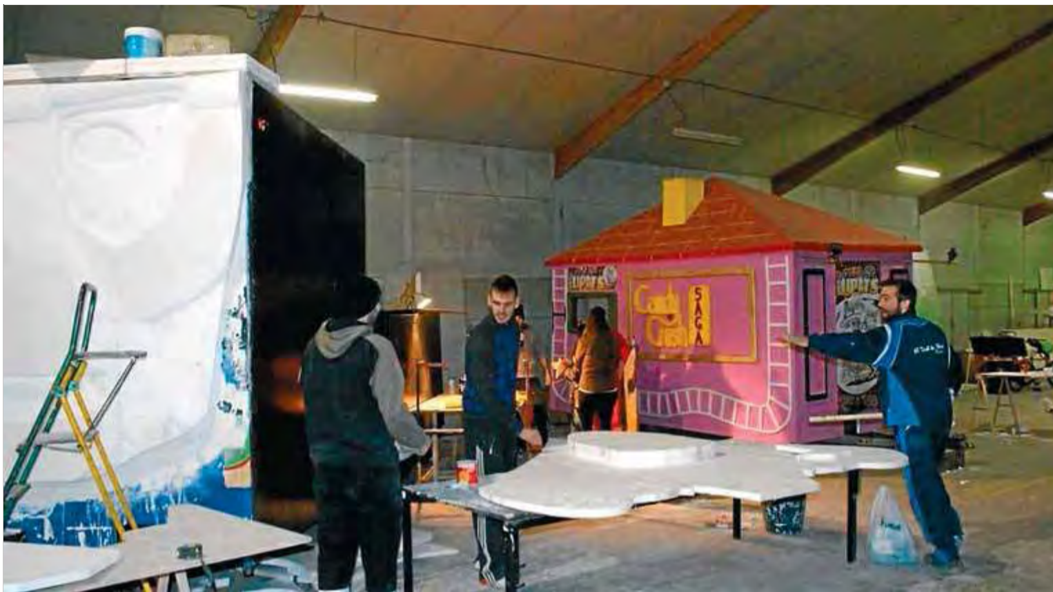
Algunes de les colles, preparant les carrosses per al carnaval en una nau de la població