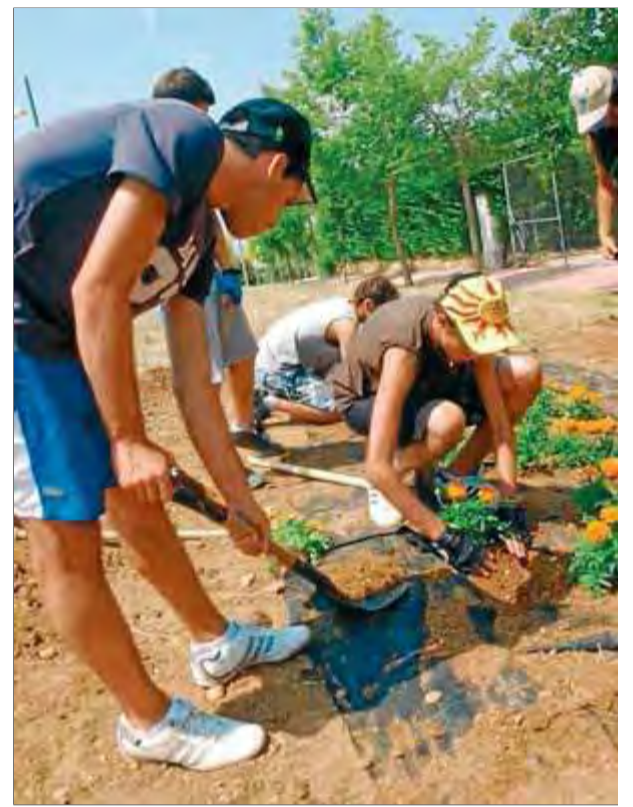
El projecte Okup'Alt de fa tres anys a l'Alt Empordà on els joves aprenen diferents oficis ■ EL PUNT AVUI

La intenció és que sí. N'hem d'acabar de parlar amb els companys però si surt algú altre que vulgui anar davant també estarà bé. És saludable que hi hagi alternatives. ■