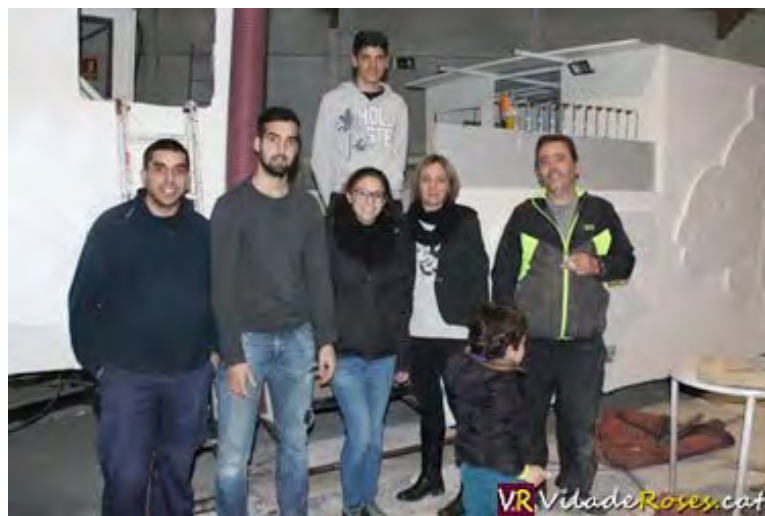
Tots aquests integrants de la colla Els Nens Plegats donaran un tomb a la seva vida durant el Carnaval de Roses i es convertiran en nines Manga

En total seran 58 ‘Arales’ les que desfilaran pel Carnaval de Roses amb la colla Els Nens Plegats. Una colla, per cert, com d'altres de la festa de Carnestoltes rosina, en la que