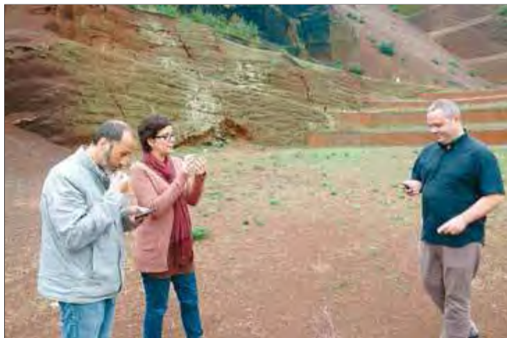
L'alcalde de Santa Pau, a la dreta, i la gerent i el president de Turisme Garrotxa, fent les primeres fotos del concurs a la gredera del Croscat ■ J.C.

que els passa o coses que els criden l'atenció. Ho fan a través de l'Instagram. Atent a la jugada, Turisme Garrotxa ha convocat un concurs de fotografies d'Instagram sobre la comarca. L'objectiu és que els visitants penguin fotos que siguin explicatives de com viuen ells la seva estada a la Garrotxa. Aquest concurs es posa en marxa ara –les bases es poden consultar al lloc web de l'entitat– coincidint amb l'inici de la tardor, que és l'època en què la comarca té una major afluència de visitants. És l'època en què cauen les fulles a la Fageda, la imatge que més s'associa a la Garrotxa, tot i que les