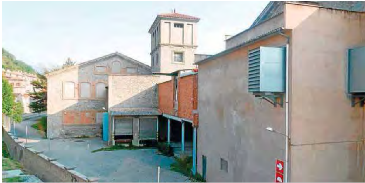
Una vista general de l'antiga Preparación Textil de Ripoll, que es transformarà en un espai residencial i comercial ■ J.C.

La comissió d'Urbanisme de Girona, reunida ahir a Ripoll, va donar llum verd a la reconversió de l'antiga fàbrica de la Preparación Textil de la capital del Ripollès en la principal zona de creixement residencial, comercial, de lleure i d'equipaments firals de la vila. Ha estat possible després d'una llarga i polèmica tramitació, primer com a àrea residencial estratègica (ARE), que no es va aprovar després d'una consulta popular, i de la darrera modificació ara aprovada. Ha calgut un projecte de protecció de les zones inundables, que ha endarrerit encara més el procés. Hi haurà un espai firal, un pont sobre el Ter, la millora del parc de la Devesa i la reducció del sostre residencial de 30.600 a 20.000 metres quadrats i l'ampliació de 8.500 a 17.000 metres quadrats per a serveis terciaris i comercials.