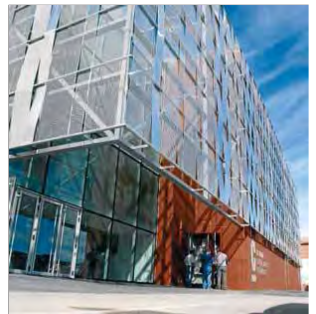
El centre d'arts escèniques El Canal, a Salt ■ JOAN SABATER

Les Deveses formen part del lloc d'importància comunitària riberes del Baix Ter, inclòs dins la Xarxa Natura 2000, i té una rellevància alta tant com a espai natural, amb més de 1.000 espècies diferents detectades, com lúdic. ■