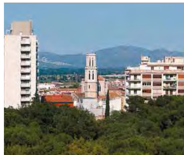
La regularització del cadastre que ha promogut l'Estat afecta 2.000 famílies