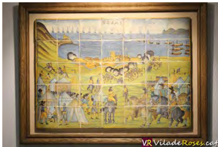
Plafó de 35 rajoles de ceràmica que mostre el setge de la Ciutadella al 1645

Un plafó compost per 35 rajoles que mostren un episodi del setge al qual va ser sotmesa la Ciutadella de Roses al segle XVII, concretament, l'any 1645, és el que poden veure els vilatans rosincs per primera vegada a la història. I sobre aquest plafó de ceràmica gira l'exposició 'El setge de Roses de 1645' que es va inaugurar divendres a la