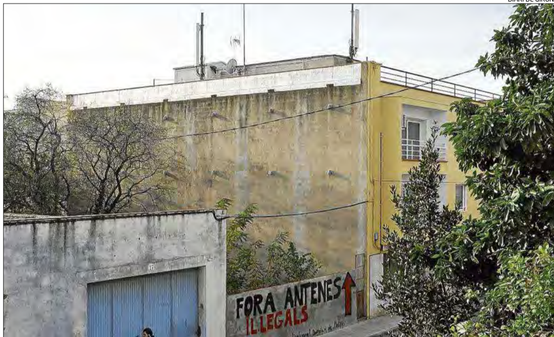
Una de les protestes protagonitzades pels veïns contra les antenes.

L'Ajuntament ja va aconseguir dissuadir la propietat d'un edifici del mateix barri del Poble Nou de la instal·lació d'una antena al terrat d'un local comercial. I és que la normativa estatal permet que, reduint al mínim les competències municipals, un simple acord entre la propietat i l'operadora així com la presentació d'un projecte sig-