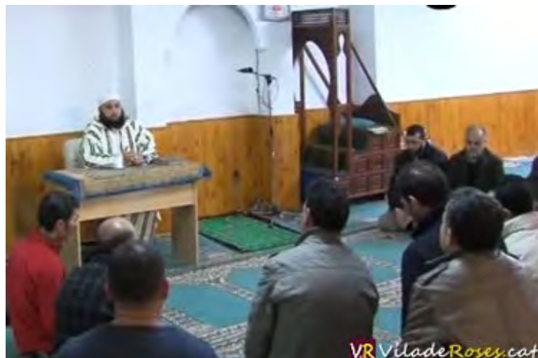
La comunitat musulmana de Roses abans de la pregària dels divendres