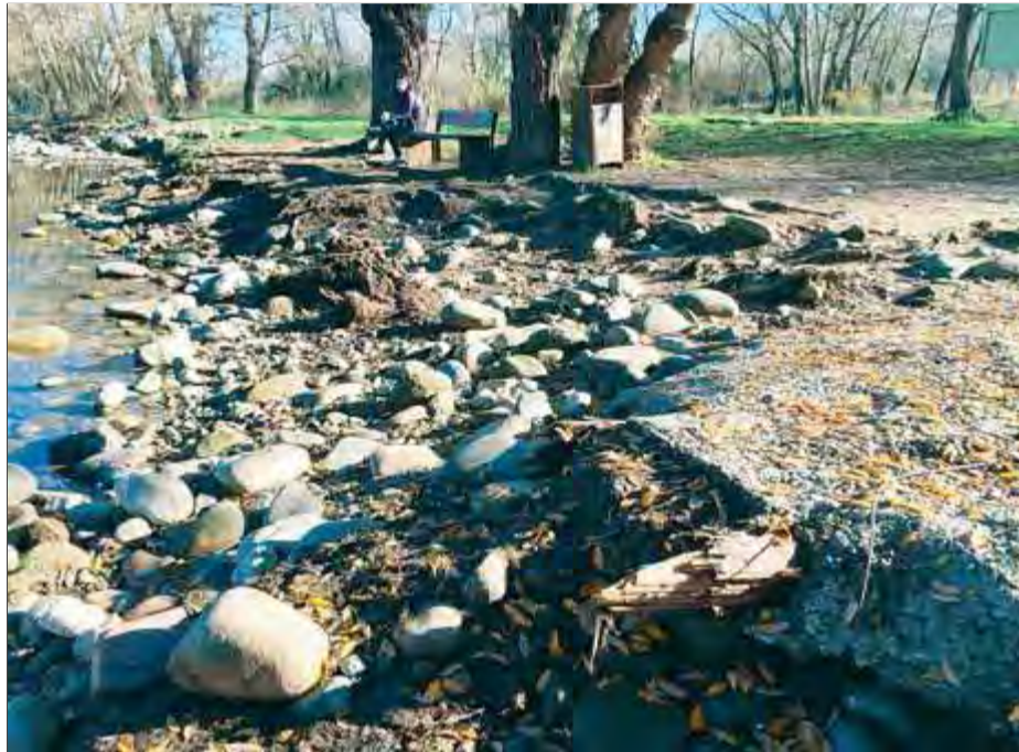
Troncs de l'embarcador trencats per la riuada al desembre, en primer terme

No és l'única intervenció que caldrà fer a la zona. La riuada també es va endur un munt de pedres que hi havia enmig del riu en aquesta zona, molt propera al pla dels Socs, i que formaven una mena de resclosa naturalitzada que refrenava l'aigua i