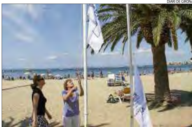
Una de les platges de Roses que compta amb la certificació.

Les distincions es van obtenir després d'un complet procediment d'avaluació ambiental que es manté amb controls anuals de seguiment als espais certificats de Roses: passeig Marítim; platges de Santa Margarida, Salatar, Rastrell, La Nova, la Punta, Palançgrers, Canyelles, Bonifaci i Almadrava; i cales Murtra, Rustella, Calís, Montjoi, Calitjàs, Pelosa, Canadell i Jòncols.