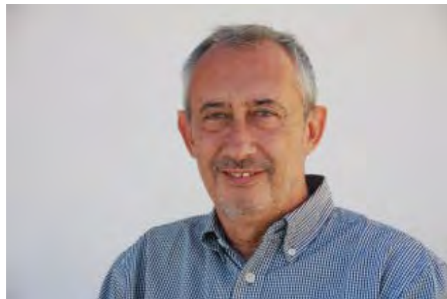
Jordi Casassas AR

Aquest divendres 12 de desembre, el catedràtic d'Història de la UB i president de l'Ateneu Barcelonès, Jordi Casassas, clourà l'actual edició del cicle de conferències "Roses, un poble amb molta història", organitzada per l'Àrea de Cultura de l'Ajuntament de Roses. L'acte tindrà lloc al Teatre Municipal de Roses, a les 20,30 h.