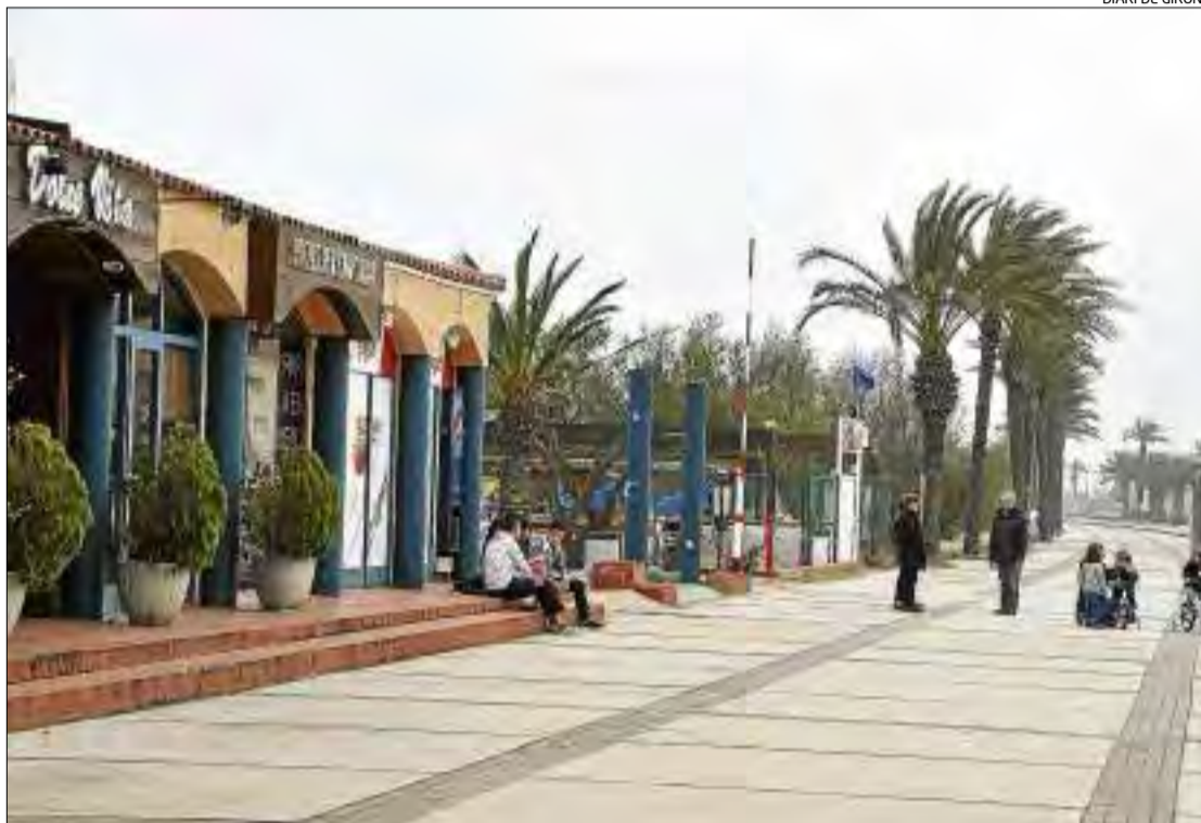
La façana de l'actual edifici del passeig d'Empuriabrava que es remodelarà.

La Generalitat ja va aprovar al febrer el projecte. Es mantindrà l'edifici principal que ocupava la discoteca Passarel·la i es remodelarà per acollir diferents negocis. Es manté també una pista esportiva i hi haurà àrees infantils, camps de petanca, un carril bici i nou mobiliari. La resta d'edificacions s'enderrocaran i es crearan àmplies zones de vegetació. L'explotació dels nous edificis es posarà a concurs.