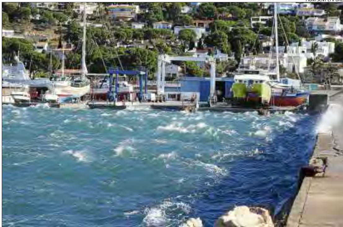
Una imatge de dimarts del port de Roses, quan bufava el fort vent al dic de la instal·lació.

A part de la capital de província gironina, les temperatures també ahir van tocar fons a altres municipis. En concret, Ulldeter -que va obtenir la segona ratxa de vent més potent el dimarts a Girona- ahir va tenir una mínima de 8,9 graus ne-