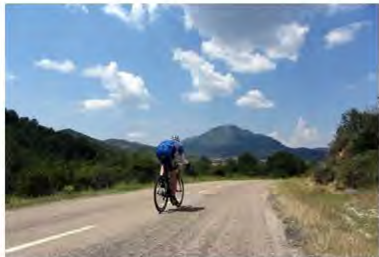
5ª etapa Transpyr Road, Aínsa – Jaca