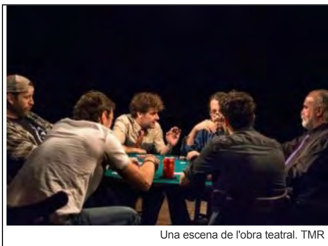
Una escena de l'obra teatral. TMR

Les entrades (20 €), es poden adquirir anticipadament a les oficines de l'Ajuntament (Plaça de Catalunya, 12. 2n pis) de dilluns a divendres de 10 a 14 h. A les taquilles del Teatre Municipal de Roses, una hora abans de l'inici de l'espectacle. Descomptes: carnet de jubilat, Carnet Jove i carnet de la Biblioteca de Roses. Entrada gratuïta per a tots els menors de 16 anys (acompanyats per un adult) i les parelles lingüístiques de Roses.