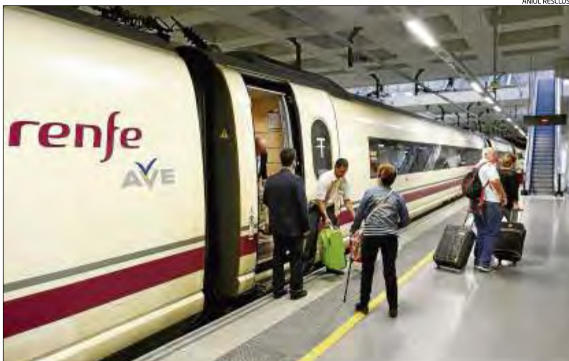
La línia d'alta velocitat entre Barcelona i la frontera francesa es va posar en marxa el gener del 2013.

En la resolució, els diputats i senadors que formen la Comissió Mixta també insten el Tribunal de Comptes a «efectuar un diagnòstic del funcionament dels òrgans de gestió i control del projecte, tant en els Ministeris de Foment i Hisenda i Administracions Públiques com en les entitats crea-