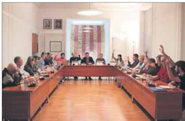
Els edils que van donar suport a contractar Valtonyc ■ E.A.

Malgrat això, els republicans havien anunciat