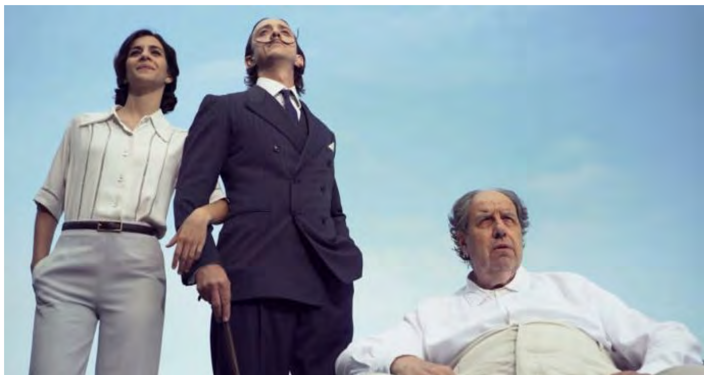
Una de les imatges de la pel·lícula EMPORDA.INFO