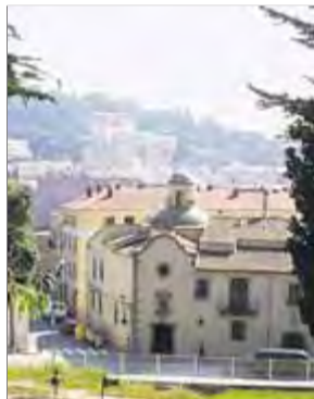
L'antic hospital, exemple del passat indià / EL PUNT

Tossa de Mar es prepara per a la tercera Tossa Indiana, una festa en què la vila es retroba amb el seu passat indià i que enguany més que mai omplirà d'ambient els carrers. Així, el programa d'aquesta edició ofereix més propostes a l'exterior, per omplir d'actes els carrers amb tallers de música, més ritmes caribenys amb sessions de classes i balls, congues, petits concerts o l'esperat concurs de pastissos –tampoc es poden perdre les visites guiades–. Els visitants també trobaran una fira diferent, ja que, en lloc d'haver-hi les parades d'artesans,