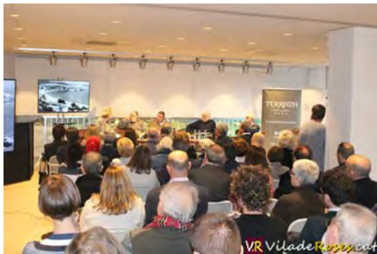
Un moment de la taula rodona de la Casa Rozes que es va celebrar a l'Hotel Terraza de Roses

La Casa Rozes, construïda per l'arquitecte José Antonio Coderch a la punta de l'Almadrava, és una de les cases més emblemàtiques de l'arquitectura moderna catalana dels anys seixanta, que ha esdevingut icona internacional.