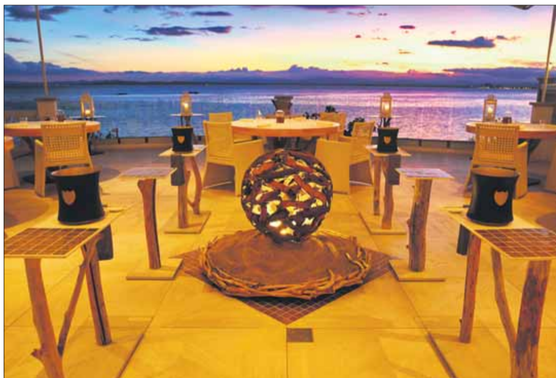
La terrassa d'Els Brancs sobre la badia de Roses