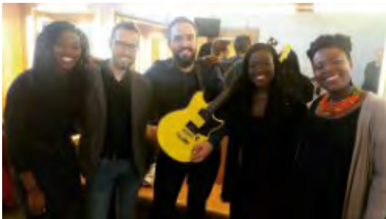
Actuació de Funkystep &amp; The Sey Sisters.

Dins de la programació del Teatre Municipal de Roses corresponent al període gener-maig de 2018.