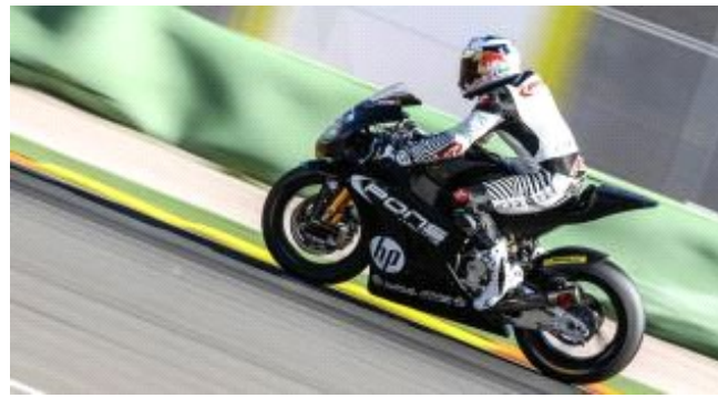
Maverick Viñales

EMPORDA.INFO Maverick Viñales ha estat el més veloç de la categoria intermèdia en el tancament del Test Oficial de València. L'actual campió del món, debutant aquest any a Moto2 amb el Pons HP 40 es queda a només 147 mil·lèsimes de Tito Rabat, que continua sent el pilot més ràpid en el global de l'entrenament.