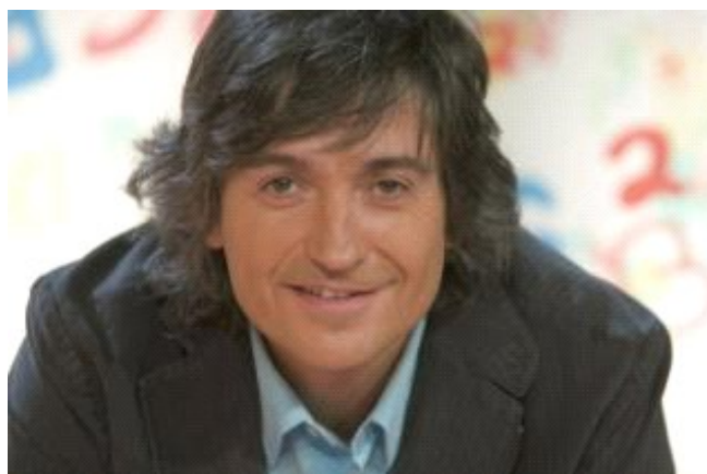
Carles Capdevila EMPORDA.INFO

EMPORDA.INFO El cicle de conferències "Propostes de país per a un nou temps" prossegueix la seva trajectòria el proper divendres 14 de febrer, amb la conferència que oferirà Carles Capdevila, periodista i director del diari Ara. L'acte tindrà lloc a les 20,30 h, al Teatre Municipal de Roses.