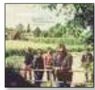
La Habitación Roja «LA MONEDA EN EL AIRE» MUSHROOM PILLLOW