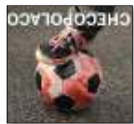
Checopolaco «LOS MISILES / BIEENN!» EL VOLCÁN