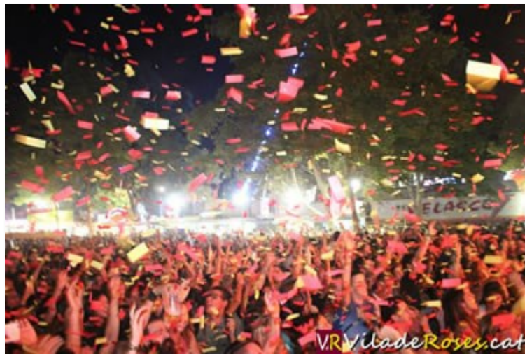
Milers de persones es van donar cita a l'últim dia de concerts de les Barraques de la Festa Major de Roses

La primera assegurar-se la participació d'un grup que saps que no fallarà, que saps que agradarà al públic sí o sí, tot i que no sigui una banda internacional i que faci gires mundials.