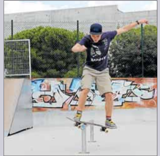
El parc de l'Escala es troba a prop de la piscina.