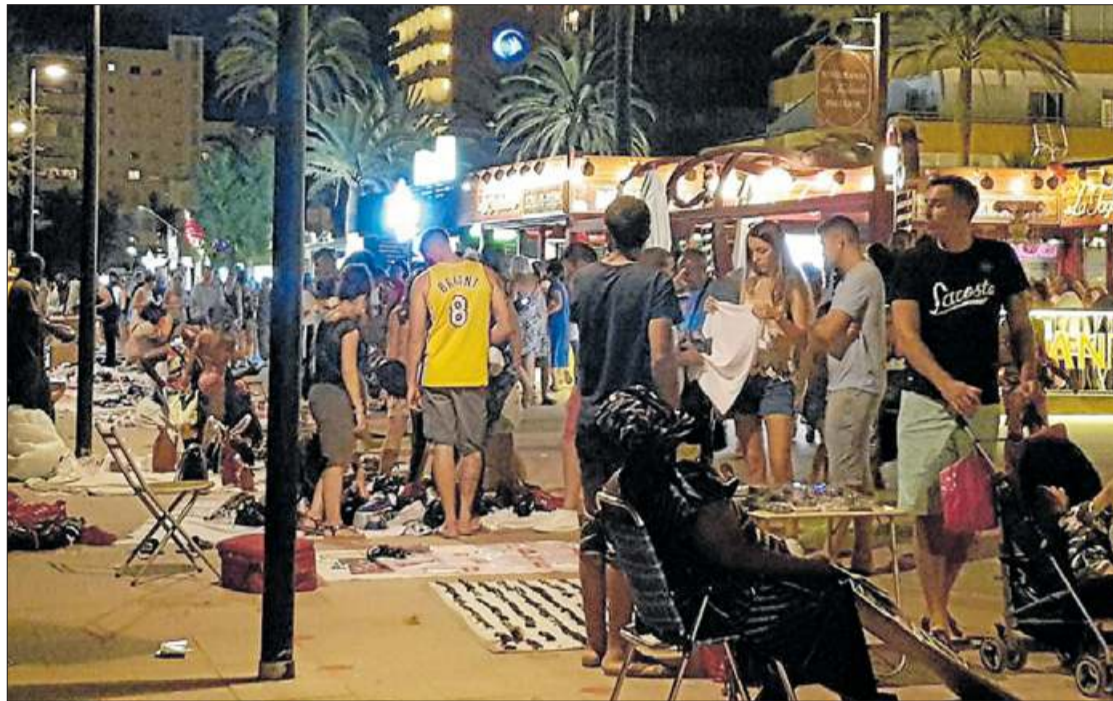
Una imatge de la gravació feta pels comerciants, en què es veu l'enfrontament amb la policia d'un grup de manters, que un any més han tornat a Roses.