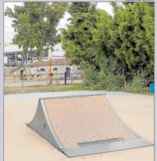
Així es troba el parc de la Salanca de Llançà.