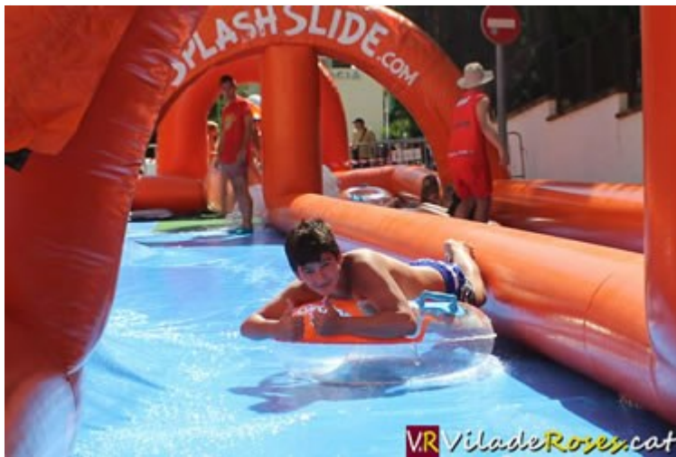
El tobogan inflable aquàtic va tornar a ser un èxit per la Festa Major de Roses

Segurament, donat l'èxit de participació que va tenir també enguany el tobogan, el trobarem l'any vinent per la Festa Major.