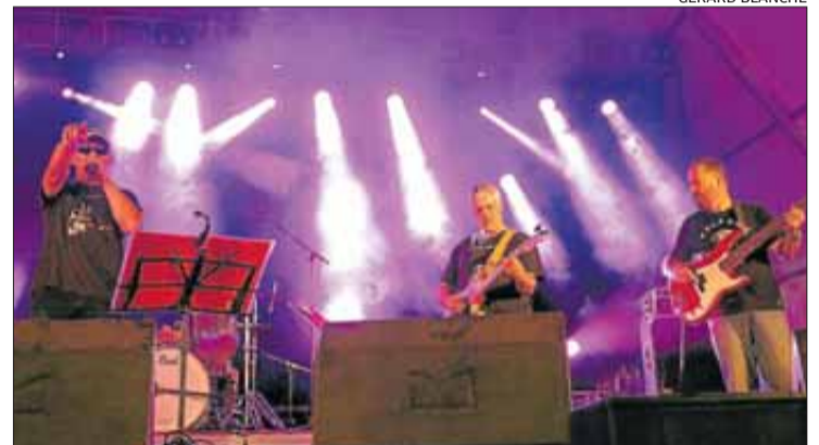
«Eslabón Perdido» va animar la nit de diumenge.