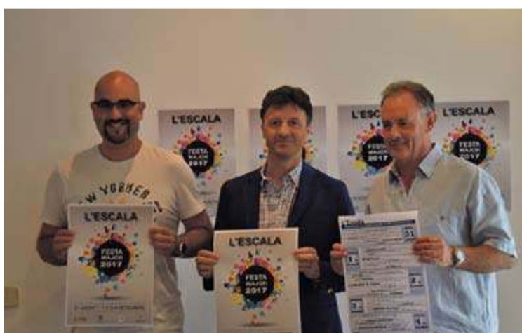
CARTELL. La presentació dels actes de la festa major de l'Escala