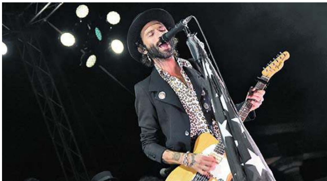
EX PEREZA. Leiva va ser capaç de tocar la fibra sensible de tots i cadascun dels assistents al concert d'Empúries

Amb els temes del seu primer i segon disc, que ja són clàssics, Leiva va incendiar i revolucionar l'ànim del públic, i amb els de Pereza, la nostàlgia va tocar la fibra sensible de tots i cadascun dels assistents al concert. També va emocionar quan va interpretar alguns dels temes que no estaven