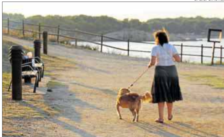
Passejar el gos té efectes positius per a la salut de les persones.

D'aquesta manera, els científics van comprovar que les persones