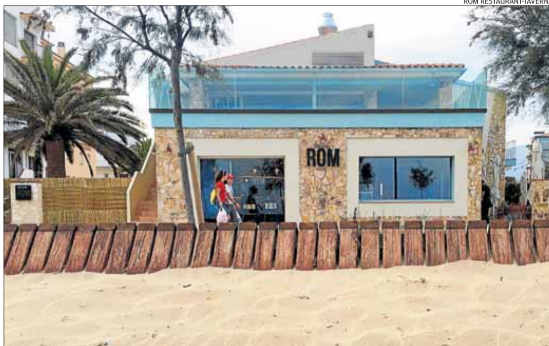
El ROM Restaurant-Taverna es troba en un espai privilegiat, amb vistes a la badia de Roses.