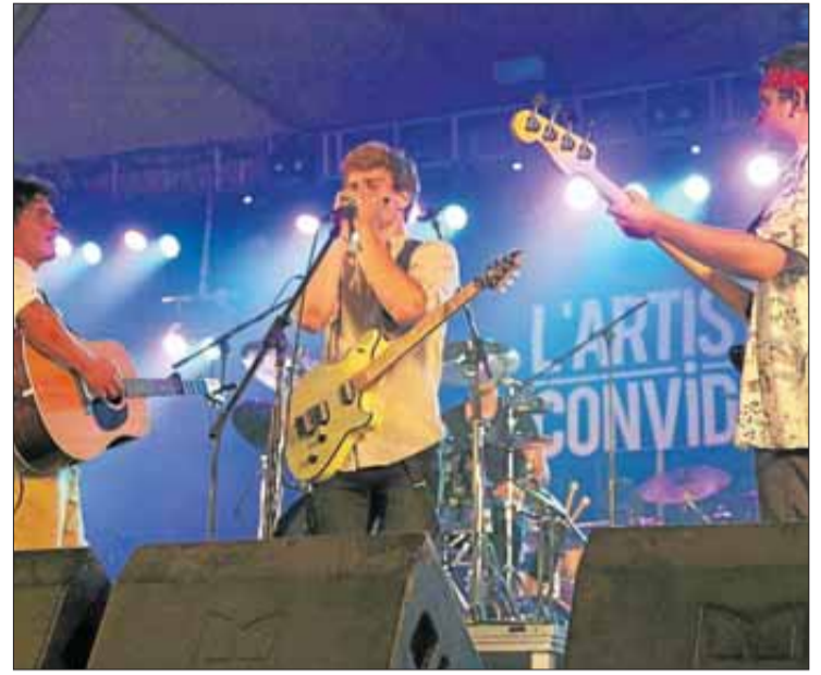
«L'Artista Convidat» va deixar molt bones sensacions.