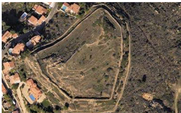
EL CASTRUM VISIGÒTIC. Imatge aèria del jaciment del Puig Rom