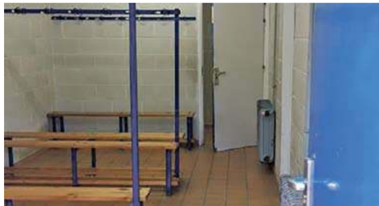
252.000 EUROS. És el cost de la remodelació de l'espai esportiu AJ ROSES