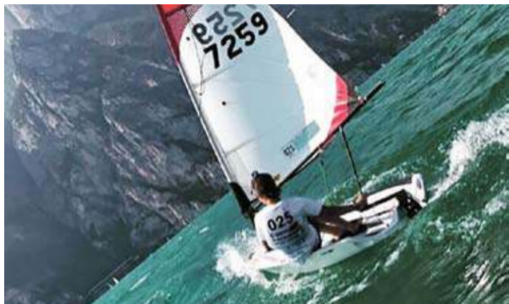
GRAN ACTUACIÓ. Font va finalitzar la regata a prop del primer classificat GENROSES