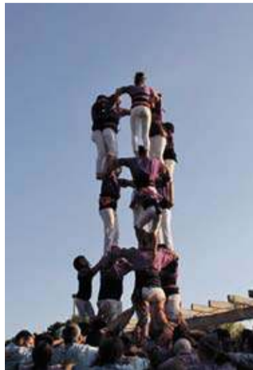
ESTIU. Grans i petits s'han aplegat als carrers de Roses per viure en primera persona la festa major del municipi

Castells, travessia, plantada de gegants, ball, barraques i fires. Enguany ha tornat a ser una festa per tots els gustos i opinions, farcint la programació d'activitats diverses. La festa va arrencar dijous passat, 10 d'agost, quan va quedar inaugurat l'espai de barraques, situat a l'antic càmping Bahia. Des d'aleshores, centenars de persones han desfilat pel recinte per tal de reunir-se amb els amics i escoltar alguns dels grups escollits per aquesta festa, entre els que destaquen La Pegatina, Celtas Cortos o Aspencat. Al costat mateix de la zona de barraques, i seguint el format d'anys