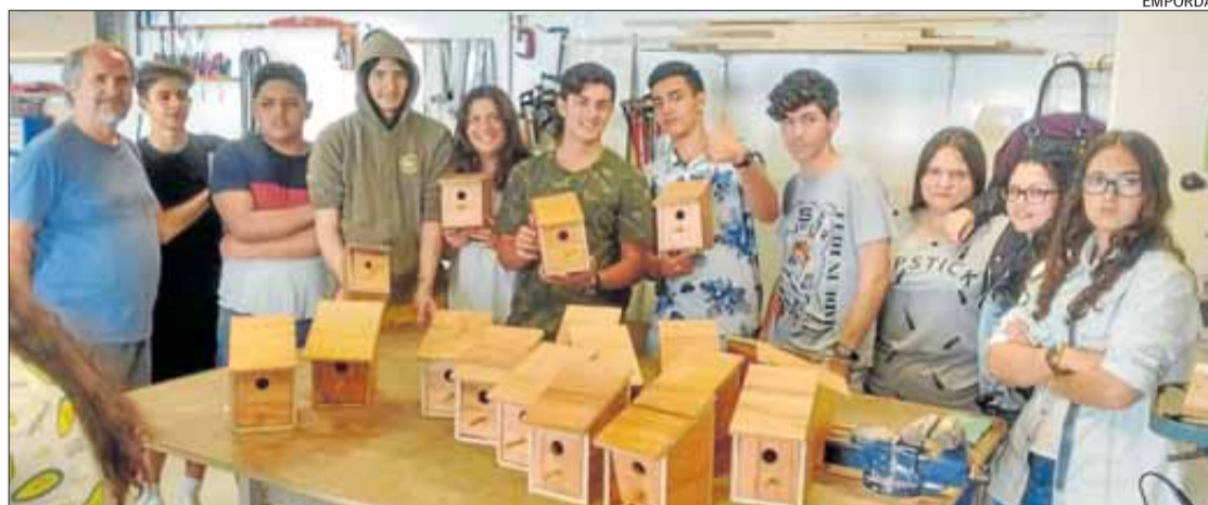
Els alumnes de l'institut, amb les caixes-niu.

► La brigada municipal les distribuirà pel poble en benefici dels ocells