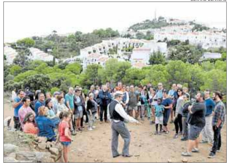
Per la festa, divendres, es va fer una visita teatralitzada a l'espai.

Les excavacions, que es van dur a terme durant tres setmanes del passat juliol, han servit també per localitzar una nova porta a la muralla, totalment desconeguda, "en un punt d'accés al recinte que dona pas a unes estructures encara per definir i que podrien ser importants", apunta Puig. En aquest sentit, lligaria amb la idea que el Càstrum fou l'indret on s'emplaçà l'elit de la zona. De fet, aquí s'hi recollia una producció agrícola important. "Era més que un poblat i té un aspecte únic, un tipus de muralla i ocupació que no té paral·lels", afirma Puig qui assegura