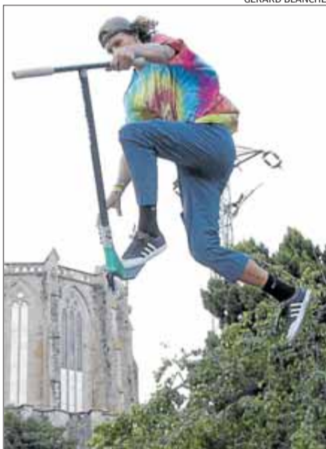
Els castellanins estan d'estrena.