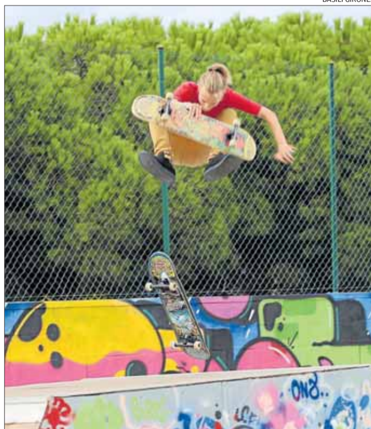
L'acrobàcia d'un patinador a l'"skate parc" de l'Escala.