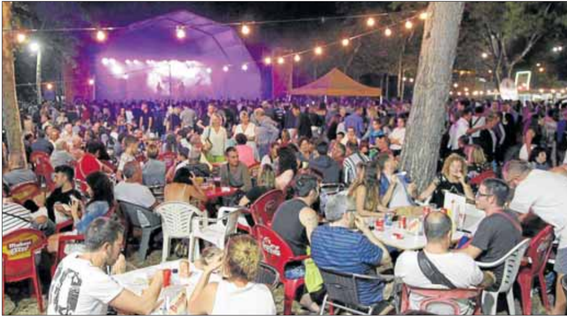
La gent aprofita les barraques per estar amb amics i familiars.