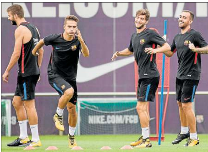
Els jugadors blaugrana s'entrenen de cara a la tornada.

S'acosta la data fixada i a la Vall d'Aro ja estan escalfant motors per iniciar la 3a edició de la Lligueta de Running de la Vall d'Aro, que consta de quatre proves. Els atletes poden triar a quantes i a quines participaran. La primera de les proves serà una cursa nocturna que se celebrarà el proper dia 25 d'agost i, el 17 de setembre, es correrà la Cursa de Castell d'Aro. Ja entrats a la tardor, es podrà fer la contrarellotge en la cursa Lineal del Camí de Ronda (8 d'octubre) i la marxa dels 20 quilòmetres (el 22 d'octubre). Es podrà participar a les curses que qualifiquen per la lligueta i també hi haurà la possibilitat de fer la prova com una marxa. DDG CASTELL-PLATJA D'ARO