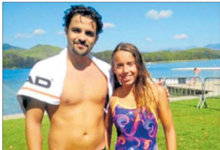
Bosch i Rodríguez van vèncer en la Volta a l'Estany. GIROSWIM

La Jonquera també va disputar un amistós, al camp del Base Roses, on va guanyar per la mínima gràcies als gols anotats per Remo i Fran (1-2).