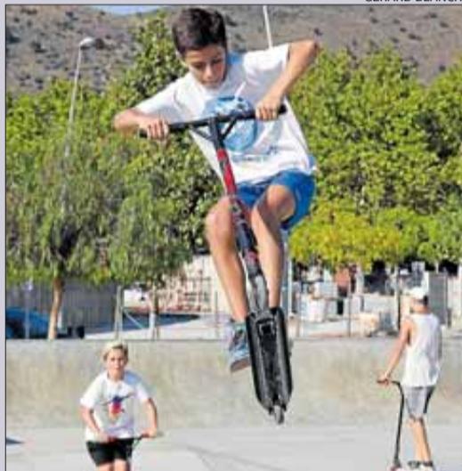
Els rosincs tenen molta afició.