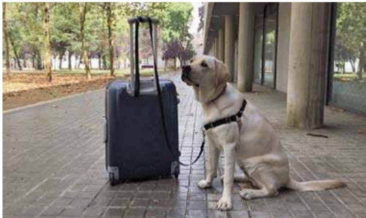
ACCEPTACIÓ D'ANIMALS. Els filtres determinen els tipus d'allotjament