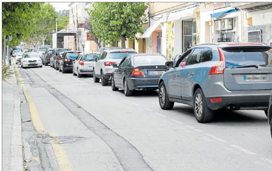
El carrer Major de la Jonquera, amb retencions.

L'N-II en tota la travessia, el carrer Major i l'autopista han registrat un elevat trànsit des de fa més d'una setmana, en una de les pitjors setmanes de l'estiu. Aquest any s'ha comptat amb un protocol especial per minimitzar les retencions.