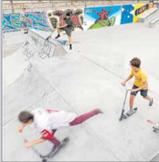
Figueres va estrenar el parc el 2012.