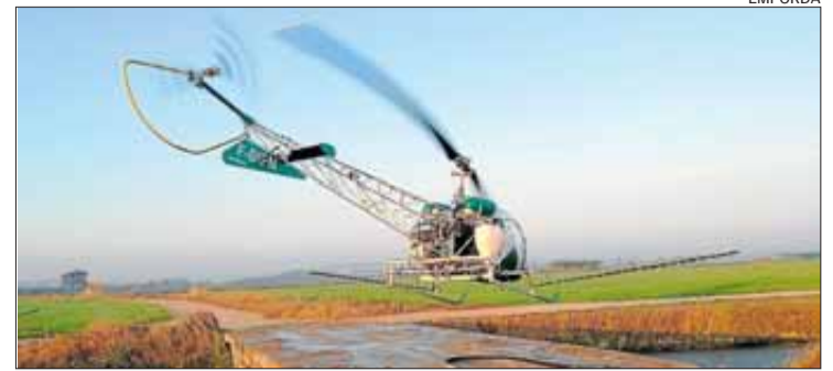
El tractament als arrossars empordanesos.

són molt molestes i afecten el benestar de la població, així com l'activitat econòmica més important de la zona com és el turisme.