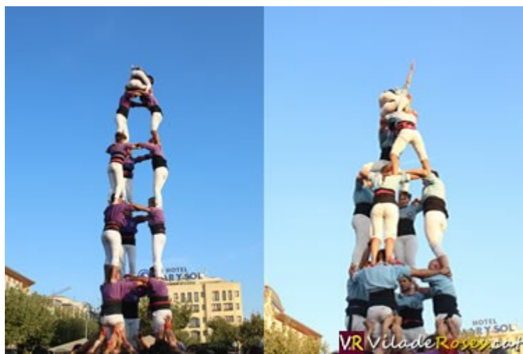
La Colla Castellera de Figueres (esquerra) i els Vailets de l'Empordà van actuar a la Festa Major de Roses

Una diada castellera no podia faltar en la Festa Major de Roses, una població amant de les tradicions catalanes. I el passat diumenge la Colla Castellera de Figueres i els Vailets de l'Empordà, o els Vailets de l'Empordà i la Colla Castellera de Figueres van oferir un bon espectacle al voltant del món casteller per al gaudi dels centenars de persones que omplien la plaça Catalunya de la Vila.