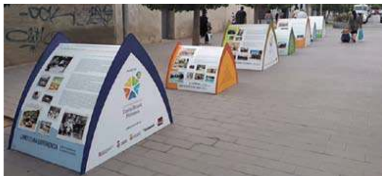
ELS MÒDULS. Tenen forma de tenda de campanya HORA NOVA

■ Aquests dies es pot veure a la Rambla de Roses l'exposició itinerant El càmping, un estil de vida , que mostra per mitjà d'imatges inèdites l'evolució d'aquesta activitat al llarg de més de 60 anys a les comarques gironines. L'exposició, que es podrà visitar fins aquest diumenge i que està impulsada per l'Associació de càmpings de Girona amb motiu del 40 aniversari de l'entitat, recull 115 fotografies distribuïdes en 7 mòduls amb forma de tenda de campanya. Els mòduls mostren quins van ser els inicis del campisme, amb una menció especial