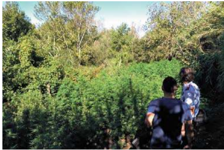
540 QUILOS. Els cossos de seguretat procediran a la seva destrucció M.D'ESQUADRA