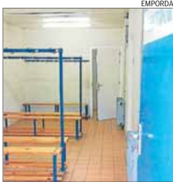
Un vestidor del pavelló de Roses.

veis generals i el vestíbul del pavelló. També es preveu incorporar proteccions solars per a les obertures del distribuïdor d'accés als vestidors per l'exterior.