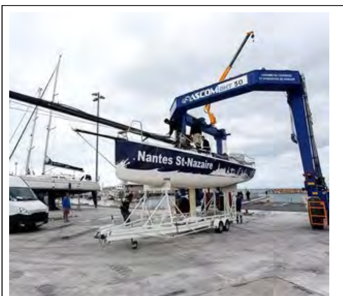
Un dels M34 ahir abans de sortir cap a Roses

Les embarcacions que participen en la 37a edició del Tour de França de vela, les M34, van emprendre ahir el viatge per terra des de Rosko (anterior etapa de la competició prèvia a l'arribada a Roses, prevista per a divendres). El Tour, que va començar a Dunkerque, és liderat pel Courrier Dunkerque 3 després de setze regates –tres de les quals en el format ral·li– disputades i amb 19 punts de marge respecte al vencedor de l'any passat, el Groupama 34 . Niça serà el punt final del Tour –és la vuitena etapa– i allà mateix es presentarà la següent edició, el 27 de juliol.