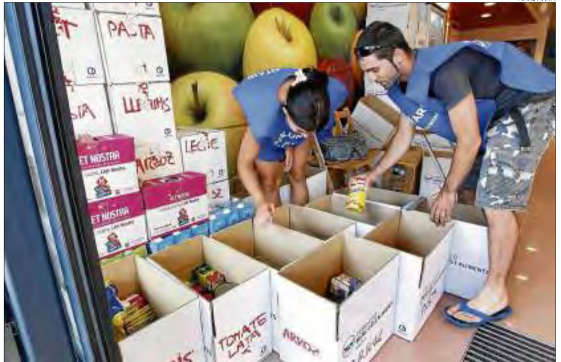
Recapte d'aliments a un establiment Bon Preu de Platja d'Aro.

Aquesta edició del recapte de la Costa Brava ha comptat amb la participació de 60 establiments comercials de 19 poblacions.