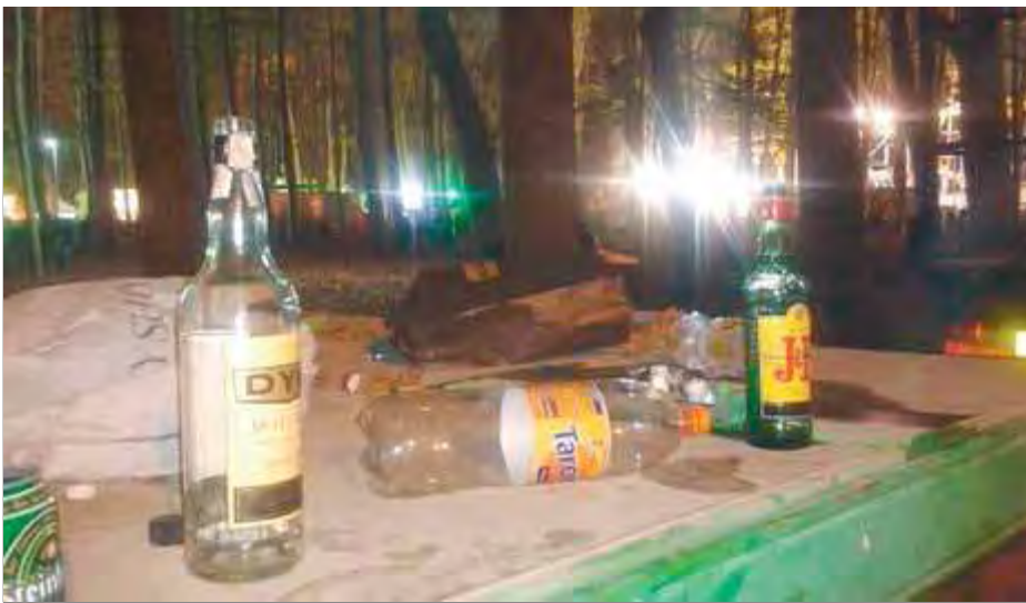
Restes d'un 'botellón' a l'interior de la Devesa durant les últimes Fires de Girona