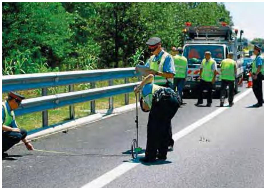
Els Mossos recollint indicis al tram de l'AP-7 on va tenir lloc l'accident

En el judici de faltes celebrat aquesta setmana, l'advocat del conductor i el lletrat de l'acusació particular van arribar a una conformitat. Van pactar que l'imputat indemnitz