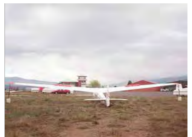
El nombre de vols esportius ha crescut a l'aeròdrom d'Alp amb la nova concessió, que hi ha consolidat l'activitat ■ J.C.

Seu és una bona opció per atraure nous visitants a la Cerdanya. La gestió de l'aeròdrom d'Alp és una concessió que el consorci liderat per la Generalitat va fer a l'aeròdrom de Sabadell després d'asfaltar de nou la pista i de millorar-hi els serveis. ■