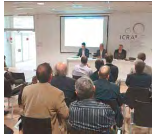
La reunió es va celebrar a la seu de l'Institut Català de Recerca de l'Aigua (ICRA), a Girona ■ EL PUNT AVUI