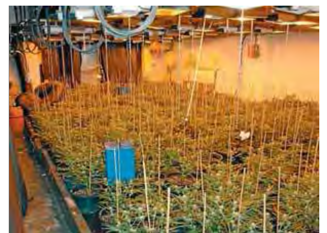
El cultiu, descobert el dia 8, era en una estança d'una part annexa de l'edifici del polígon industrial la Timba ■ CME

acusats fent tasques de manteniment. Els Mossos van comissar 693 plantes, calefactores, aparells per mesurar, ventiladors, bombones de butà i làmpades. Els detinguts, un d'ells amb antecedents, van quedar en llibertat amb càrrecs l'endemà. ■