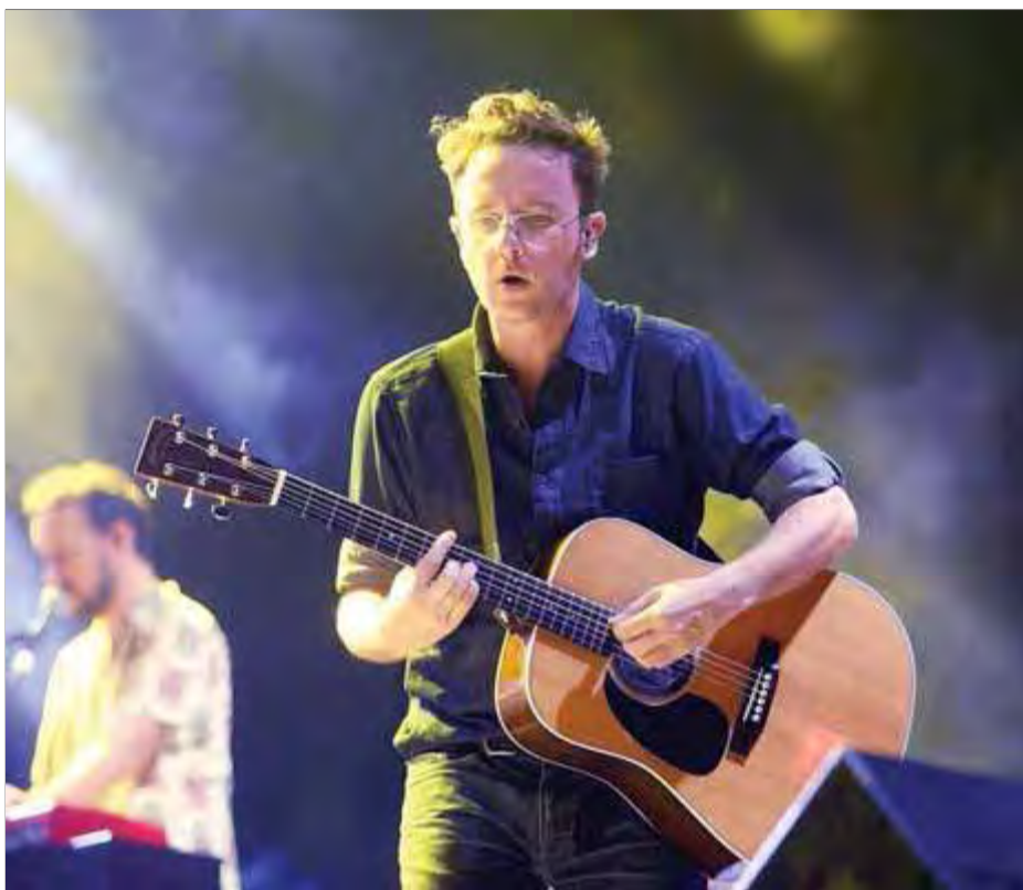
Foto d'arxiu de la formació Mishima, que actuarà al Teatre Municipal de Roses