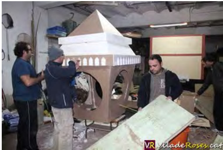
Rosincs de la colla P.B.A. treballant en la seva carrossa

Massa fred a Groenlàndia, on van ser durant el Carnaval de Roses de 2013, fent d'esquimals, i massa calor a Mèxic, on van viatjar durant la festa de Carnestoltes rosinca de l'any passat.