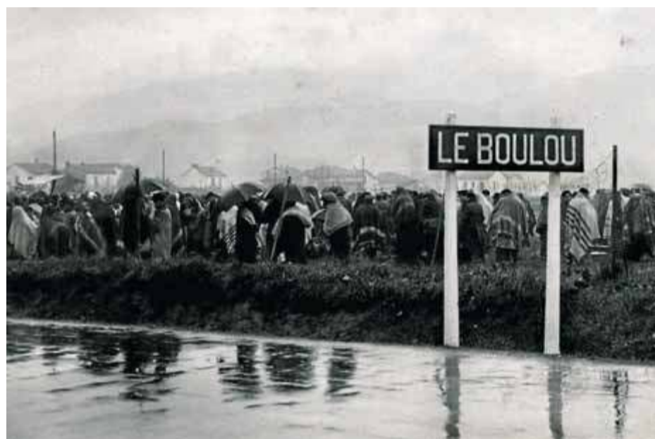
L'exèrcit republicà arriba al Pertús enmig de la multitud, el 7 de febrer de 1939, i a sota, els refugiats esperen sota la pluja, el 31 de gener, a ser transferits a algun camp

Cerdans o la Guingueta d'Ix. Entre ells hi havia Robert Capa i David Seymour, Chim , que fotografien el caos de l'espera al Pertús de milers de fugitius sota el fred i pluja, o la primera assistència sanitària als infants en uns banyons del Voló. Molts dels autors, però, han restat en l'anonimat. La majoria de les imatges que s'exposaran al Mume van ser produïdes a les portades