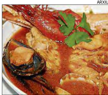
Un suquet de peix amb marisc

Però la presència de les patates, que hi ha qui discuteix, em sembla no solament un guany evident, sinó una millora substancial del plat. I tot i que hi suquets sense patates –de sardines, d'anxoves,