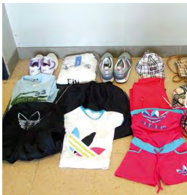
MARQUES FALSES. Una mostra de la roba intrevinguda pels Mossos

Durant els escorcolls, i amb l'ajuda dels representants de les marques, els agents van arribar a omplir fins a 67 bosses de mida industrial de diferents tipus de falsificacions. En total, més de 1.800 peces de roba i complements. En-