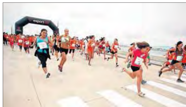
Aviat seran els primers entrenaments de la cursa. MONTSENY EMPORDÀ

En total seran setze hores de festa ininterrompuda per aquest Festival diürn, des de les 3 de la tarda a les tres de la matinada en un recinte que els organitzadors consideren "únic al món", la Ciutadella de Roses. I de 03.00 a 06.45 hi haurà afterparty exclusiva i gratuïta per a tots els assistents al festival.