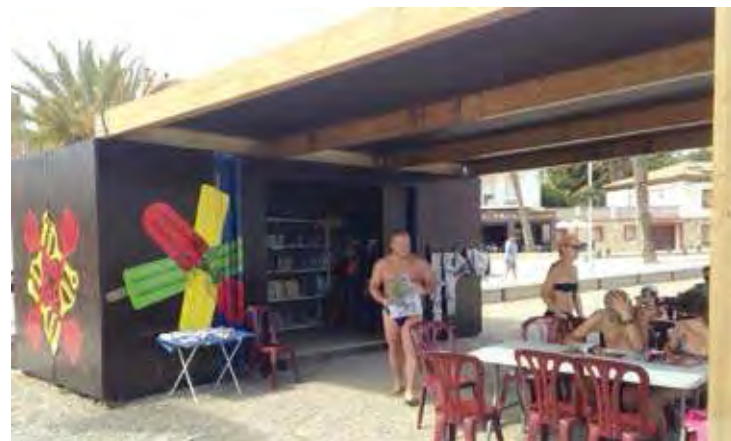
SOL I CULTURA. La biblioplatja de Llançà ha arribat a la desena edició