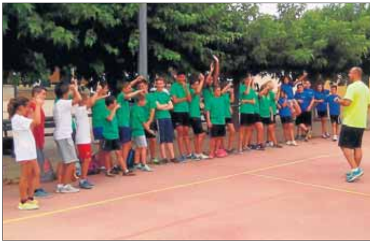
La trobada de joves feta a Capmany.