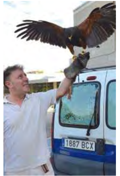
L'àliga protagonista de la mesura

L'empresa va començar a treballar la setmana passada amb aus rapinyaires, fent volar sobre la zona una àliga per fer que els gavians deixessin d'utilitzar-la com a lloc d'establiment habitual. En pocs dies gairebé es va aconseguir l'objectiu, tot i que es mantindrà aquest operatiu durant un mes per tal de consolidar la mesura. Aquest sistema ja s'havia provat amb èxit a la zona del Club Nàutic de l'Escala i se suma a la campanya anual per