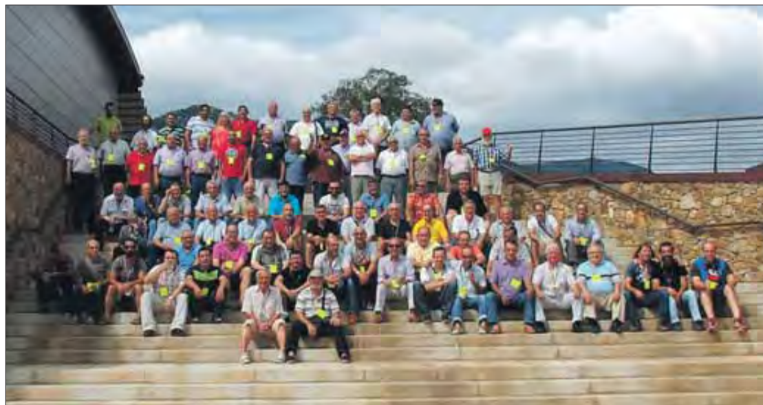
Els participants al Campionat de Catalunya de botifarra. FRANCESC AGUILERA