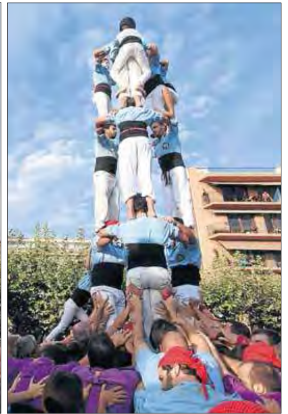
Els castellers de Figueres i Castelló van protagonitzar una excel·lent jornada. ROSANA VIDAL