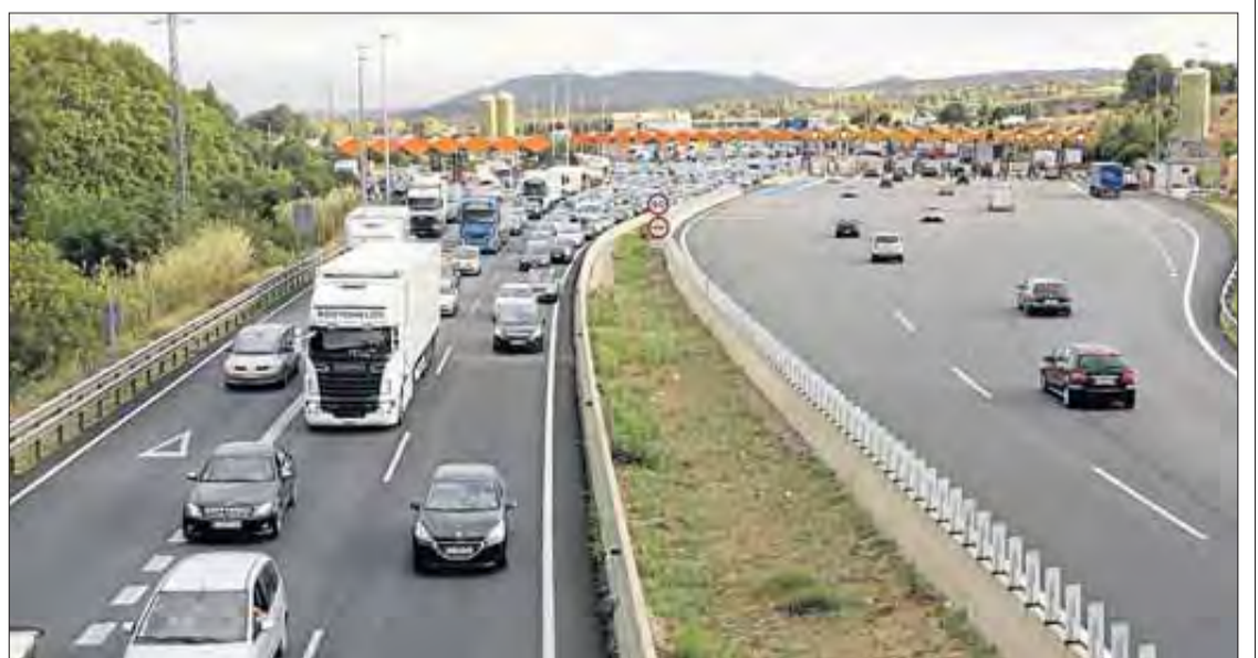
Les cues de vehicles que es van registrar a la Jonquera el 13 d'agost van ser caòtiques.

El caos a l'AP-7 a la Jonquera és només un dels episodis d'incidència a la xarxa viària de l'Alt Empordà, on aquests últims dies també s'han registrat altres punts d'aturades i retencions: la carretera N-II al seu pas per Figueres i en sentit França i la C-260 per enllaçar amb l'N-II a l'altura de Vilatenim.