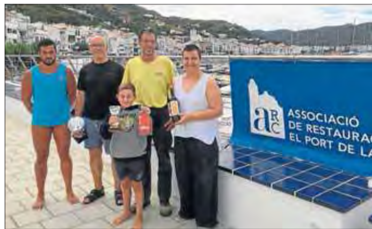
Els guanyadors locals de la travessia de natació.