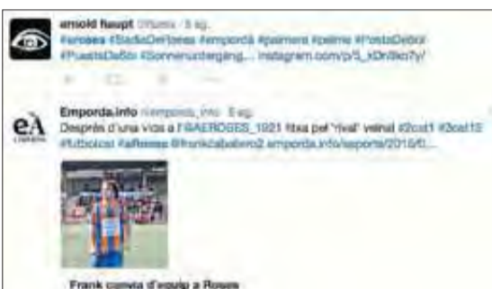
Captures de pantalla de tuits en què s'afegeixen les etiquetes que identifiquen el poble de Roses. EMPORDÀ