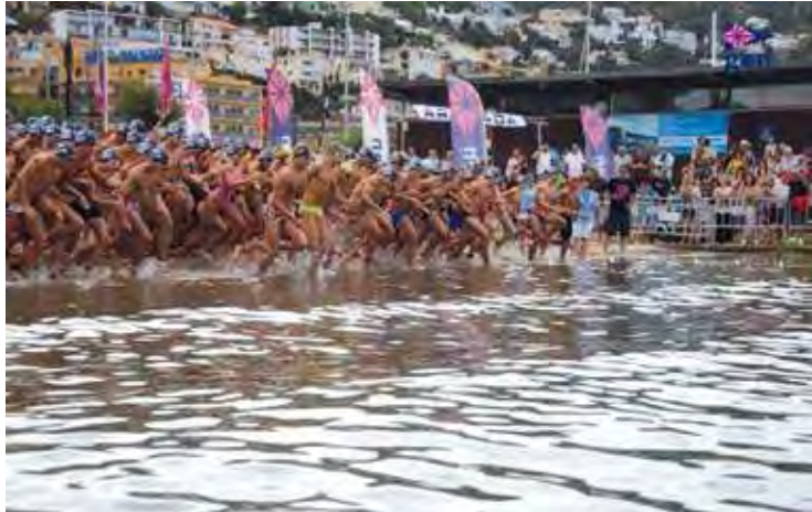
PARTICIPACIÓ. La prova va congrega nedadors nacionals i estrangers GEN ROSES