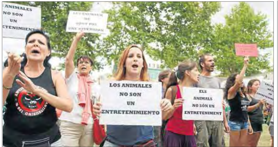
Les primeres manifestacions van ser divendres amb motiu del correbou. ROSANA VIDAL