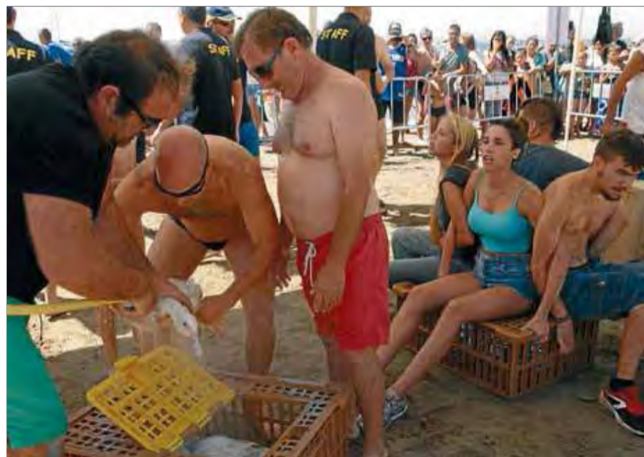
Una imatge de l'empaitada d'ànecs de Roses del cap de setmana

Un ànec com a arma Paral·lelament, un vídeo amb imatges de l'empaitada d'ànecs de diumenge s'està convertint en viral i ja té més de set mil visualitzacions. En concret, són unes imatges que l'entitat Animal Rescue ha penjat a la xarxa social Facebook per demanar també la retirada d'aquesta celebra-