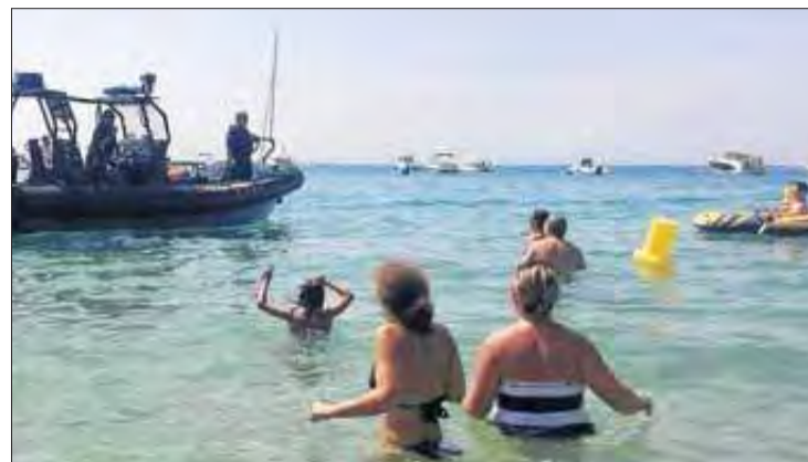
La llanxa dels Mossos alertant els banyistes de l'Almadrava. ENRIC NOGUER

Hi ha gent que malgrat la presència de boies segueix banyant-se en aquest espai i aquest fet va provocar la setmana passada que els Mossos d'Esquadra es personessin a l'Almadrava amb una llanxa policial. "Els mossos van parlar per megafonia en tres idiomes per ordenar als banyistes que es trobaven dins d'una zona destinada a embarcacions que es desplaçessin immediatament a la zona destinada al bany. Tot seguit, alguns dels banyistes van in-