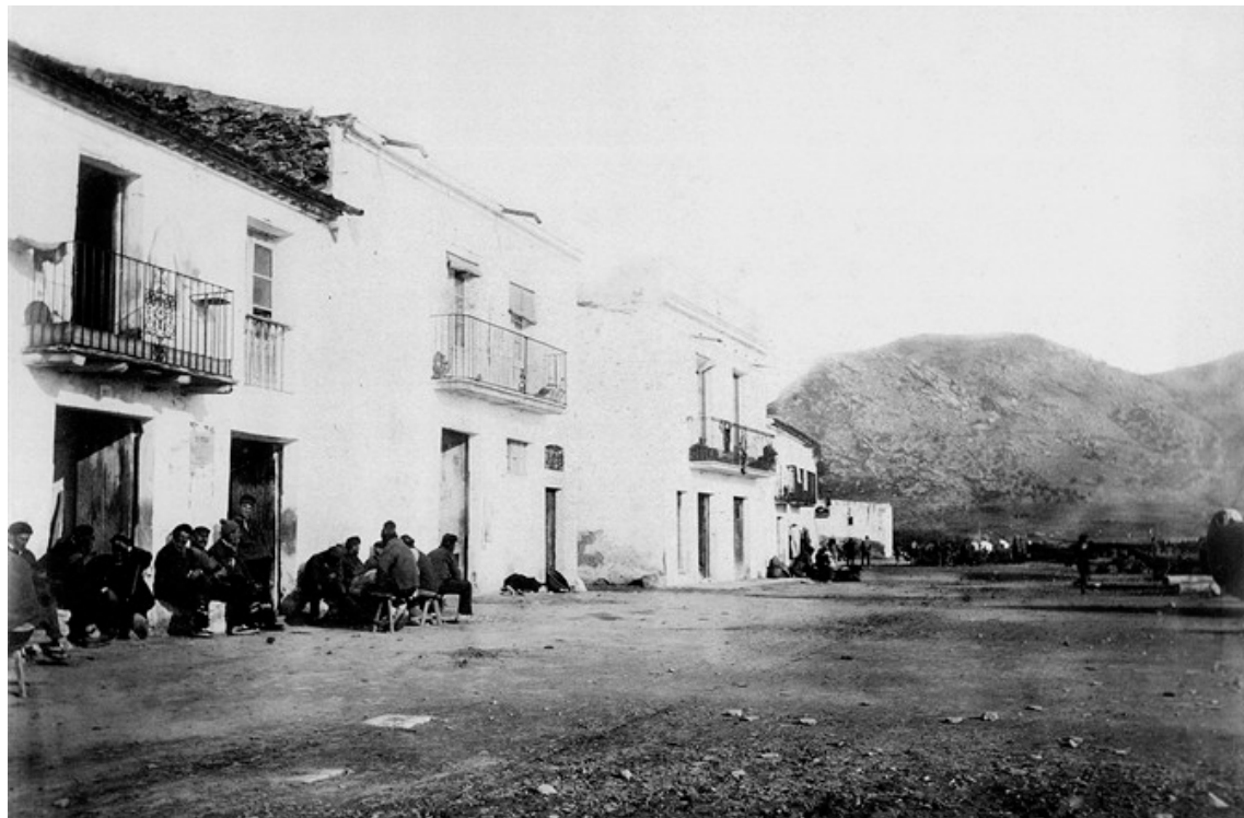
LA TERTÚLIA. Una imatge de l'Arxiu Rubaudonadeu amb veïns de Roses fent-la petar a la porta de casa a finals del segle XIX

Les noves generacions difícilment faran tertúlia vora casa. Preferiran anar a fer un tomb, prendre una copa o quedar-se tranquil·lament a l'habitació de casa "xerrant" per WhatsApp o Facebook. Els seus pares, si no han decidit sortir, també han perdut aquest hàbit. Prefereixen veure algun programa de televisió còmodament estirats al sofà si és que no han començat, tam-