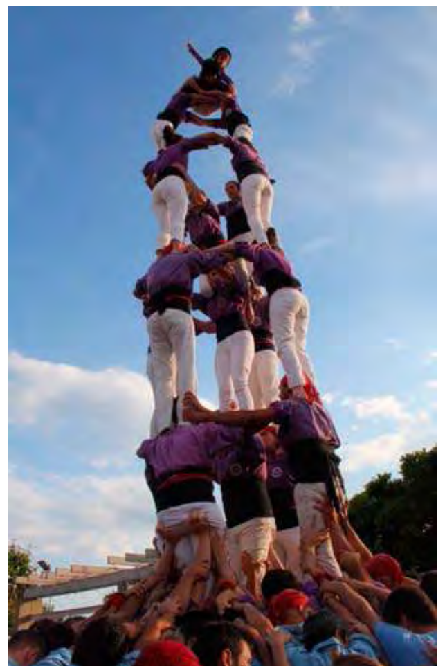
LA COLLA CASTELLERA DE FIGUERES. A la festa major de Roses

Els Vailets de l'Empordà, per la seva banda, van fer tres pilars de quatre, un 3 de 6 aixecat per sota, un 4 de 7, un 3 de 7 i un vano de 5 per acabar. D'aquesta manera, la colla de Castelló d'Empúries va fer la seva millor actuació amb el que porten de temporada, i va sortir de Roses amb la moral