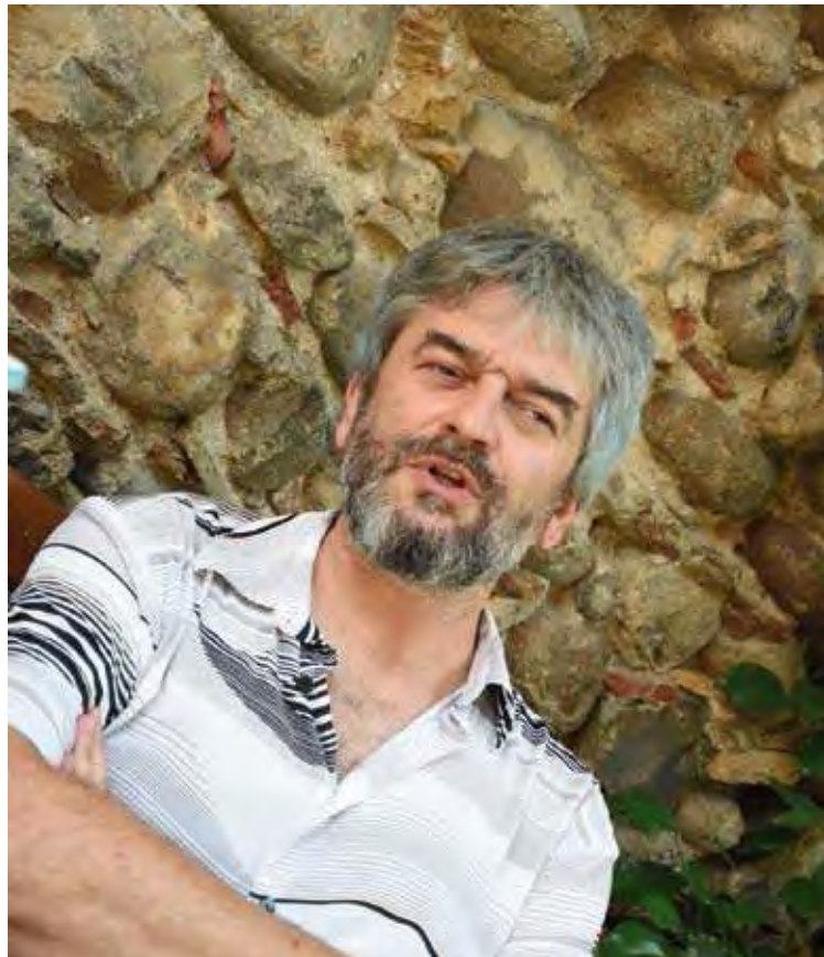
NO HI HA HAGUT TRASPÀS. "Les trituradores de paper van funcionar dia i nit"

No n'hi ha hagut de traspàs. És més, jo fa anys que no m'hi parlo. Vam entrar a l'Ajuntament i vam trobar el despatx buit de papers, tot net. Durant tres setmanes la màquina de triturar documents va funcionar dia i nit. Vàrem trobar contenidors plens de papers trinxats. L'anterior alcalde es defensa dient que la seva gestió ha estat magnífica i que ens ho ha deixat tot perquè ho tirem endavant. En el ple, on ell està com a