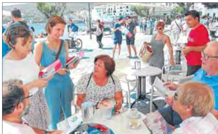
Les candidates de Junts pel Sí, conversant amb veïns de Cadaqués. EMPORDÀ

En aquest sentit, i per simbolitzar la força de la proposta, es va