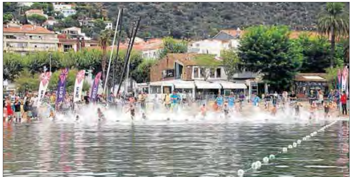
Una imatge de la travessia de Roses, que es va celebrar dissabte passat. GERARD BLANCHÉ