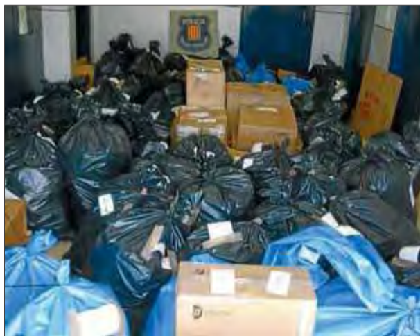
La roba comissada pels Mossos d'Esquadra

Els Mossos d'Esquadra han intervingut més de 1.800 peces de roba de marques falsificades durant una operació a Roses. L'operació policial contra el frau industrial, que s'ha fet aquests últims dies, va mobilitzar agents de seguretat ciutadana de Roses i efectius de la unitat d'investigació. A més, els policies també van tenir l'ajuda de cinc representants