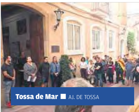
Tossa de Mar ■ AJ. DE TOSSA