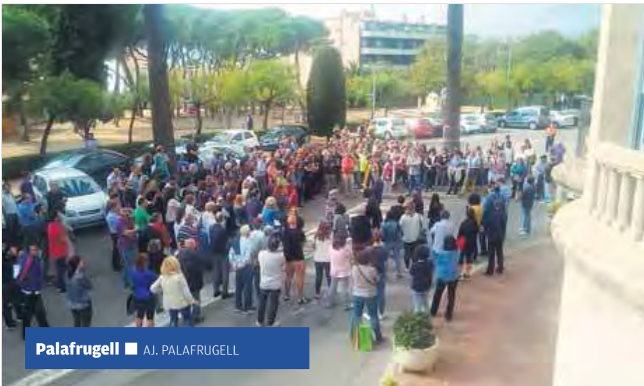
Palafrugell ■ AJ. PALAFRUGELL