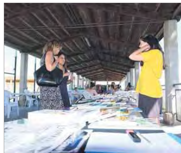
El servei de bibliopiscina durant una visita feta per l'alcaldesa aquest estiu

S'estableix una bonificació del 50% sobre la tarifa per l'ús del Teatre Municipal per a l'organització de congressos i convencions, quan se celebren entre els mesos d'octubre i maig, llevat de Setmana Santa, i els assistents al congrés pernoctin en allotjaments turístics de Roses . ■