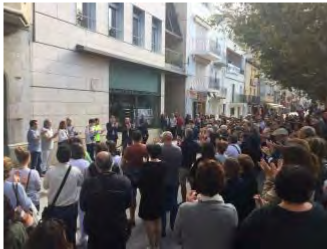
Una de les concentracions, a Roses

Diversos municipis de l'Alt Empordà, com Figueres, Roses, l'Escala, Castelló i Cadaqués, entre molts d'altres, s'han adherit aquest dimarts al migdia a la convocatòria d'aturada com a mostra de rebuig per l'empresonament dels presidents d'Òmnium Cultural i de l'Assemblea Nacional Catalana, Jordi Cuixart i Jordi Sànchez.