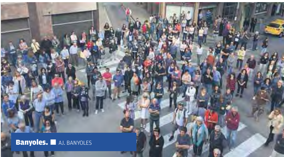
Banyoles. ■ AJ. BANYOLES