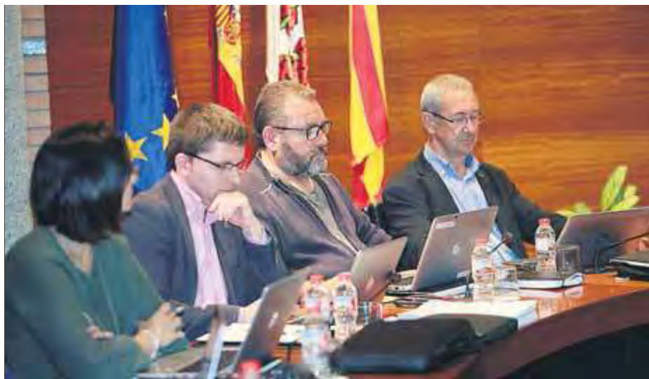
El ple de Roses va donar el vistiplau a les noves ordenances fiscals

Hi ha la voluntat de no augmentar la càrrega contributiva tal com reflecteix també l'apartat de taxes i preus públics municipals, on les tarifes es mantenen en el mateix nivell d'anys