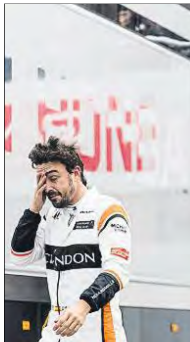
Alonso, tras un fallo en su motor

“Alonso me presionó todo el tiempo. Es un buen hombre y estoy seguro de que se sentía mal haciéndolo, pero tenía que hacerlo. Estoy avergonzado”, explicó el máximo responsable de Honda en la F1, reconociendo también que “por supuesto, algunas personas no estaban satisfechas con su actitud, aunque no era mi caso”. “Para mí nunca fue un problema. Estoy muy decepcionado por no haberle dado un buen motor. Lo siento, estoy enojado”, finalizó