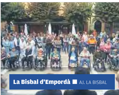
La Bisbal d'Empordà ■ AJ. LA BISBAL