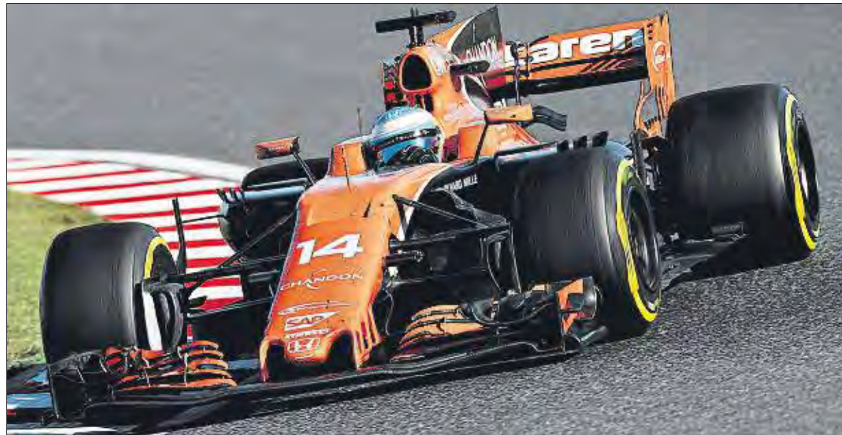
Fernando Alonso podría anunciar su renovación con McLaren en breve, apostando por el proyecto de los ingleses con Renault para 2018