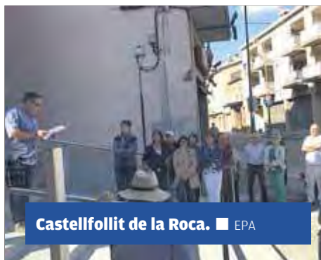
Castellfollit de la Roca.