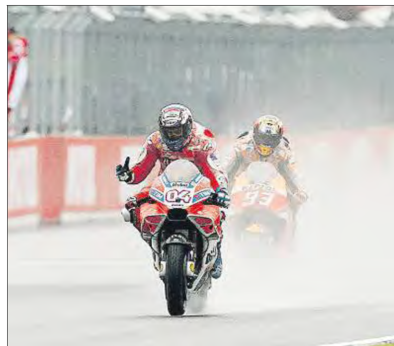
Andrea Dovizioso batió a Marc Márquez en un gran duelo final en el GP de Japón

MOTOGP ● “Es impresionante”, exclamó el balear