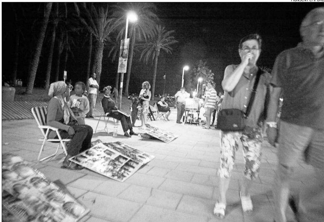
Alguns dels venedors ambulants il·legals a la zona del passeig marítim de Roses aquest dimecres a la nit.

L'operatiu es va fer a partir de les nou del vespre i es va centrar en l'à-