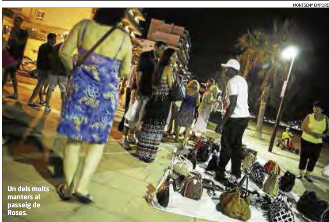
Un dels molts maners al passeig de Roses.

Poemestiu El festival combina enguany poesia i música ▶ 29