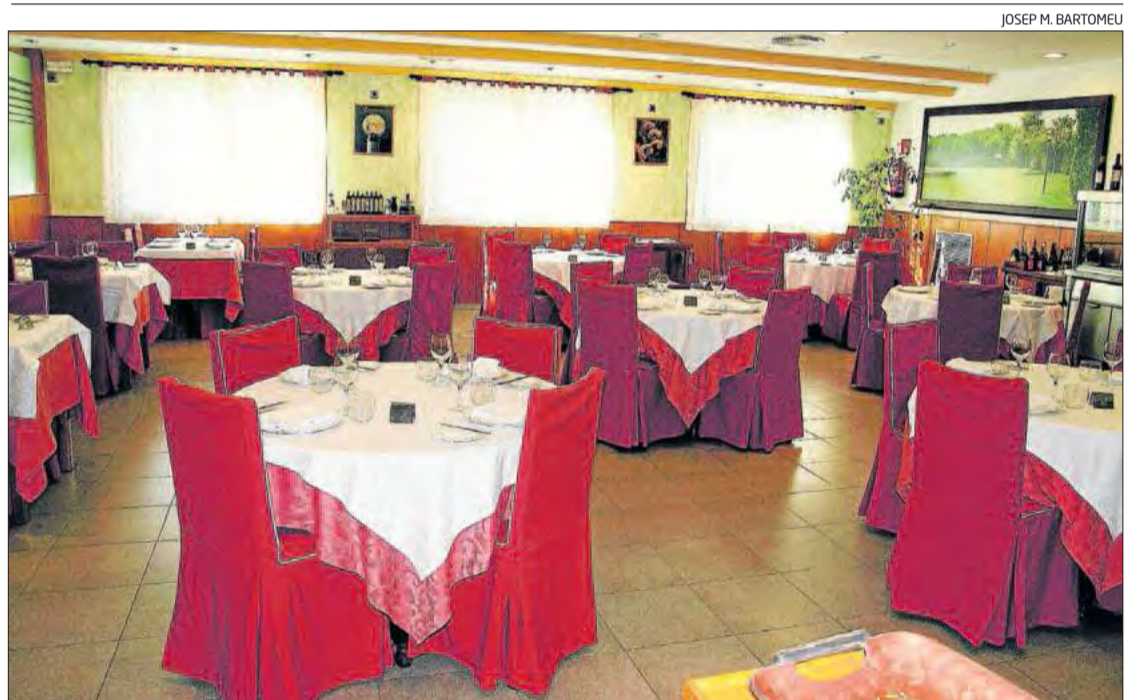
Un aspecte del menjador principal del restaurant Can Serra de Vilobí d'Onyar.