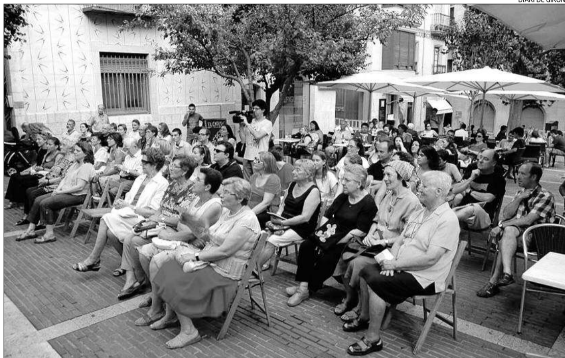
Una de les vetllades de la segona edició del festival PoemEstiu, celebrada en una plaça de Figueres.