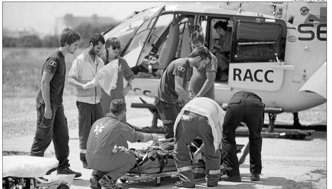
Es va traslladar la submarinista ferida en l'helicòpter medicalitzat del SEM fins a l'hospital de Palamós.

Vist els fets, els companys de l'embarcació van avisar al telèfon d'emergències amb la dona conscient en tot moment. La Salvamar Castor de Salvament Marítim va ser l'encarregada d'anar fins la barca on estava la submarinista francesa. Un cop allà, els efectius de Salvament li van posar oxigen i la van traslladar fins al port de Roses i allà, els efectius del Sistema d'Emer-