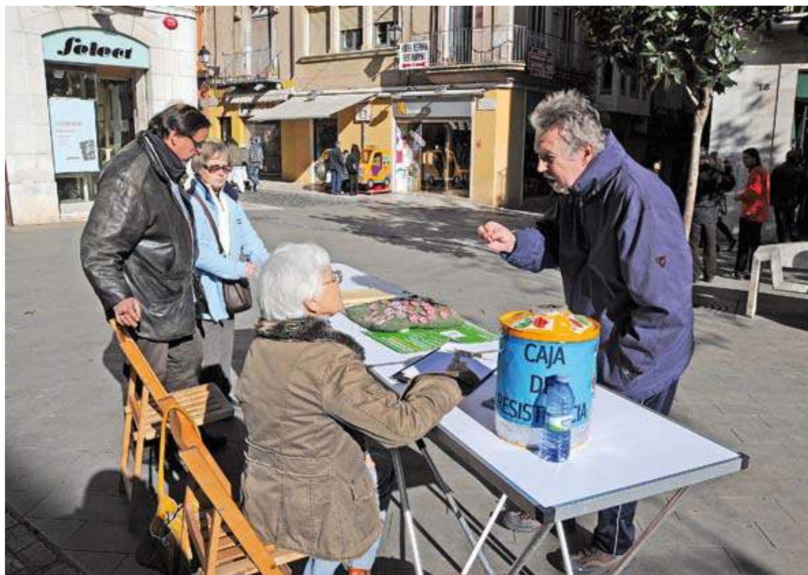
TAULA. Membres de la PAH Figueres a la plaça de l'Ajuntament

Aquesta dona de gran enteresa manté la mirada quan per segons s'imagina el seu futur. "Només vull una feina que em permeti sortir d'aquesta situació. Tinc 53