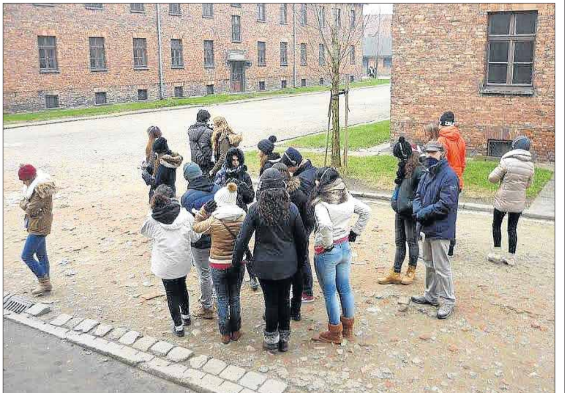
Un grup d'alumnes de l'Institut Olivar Gran ha visitat aquest curs el camp d'Auschwitz-Birkenau. INSTITUT OLIVAR GRAN