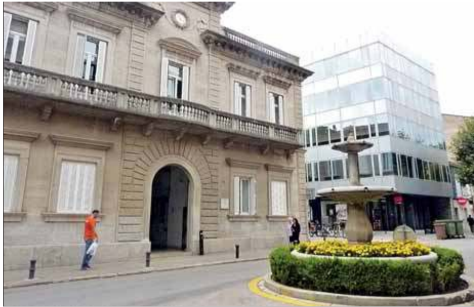
La placeta de davant de l'ajuntament, que es reformarà l'any 2017

Les obres d'envergadura més immediates (comptabilitzades en el pressupost del 2015) són la continuació de la reforma del carrer de la Barca cap al front d'estany; l'arranjament de la part de la plaça de les Rodes del davant de l'església de la Sagrada Família i diverses in-