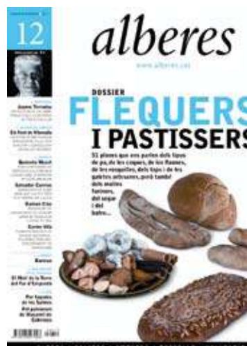
PORTADA. Mes de gener