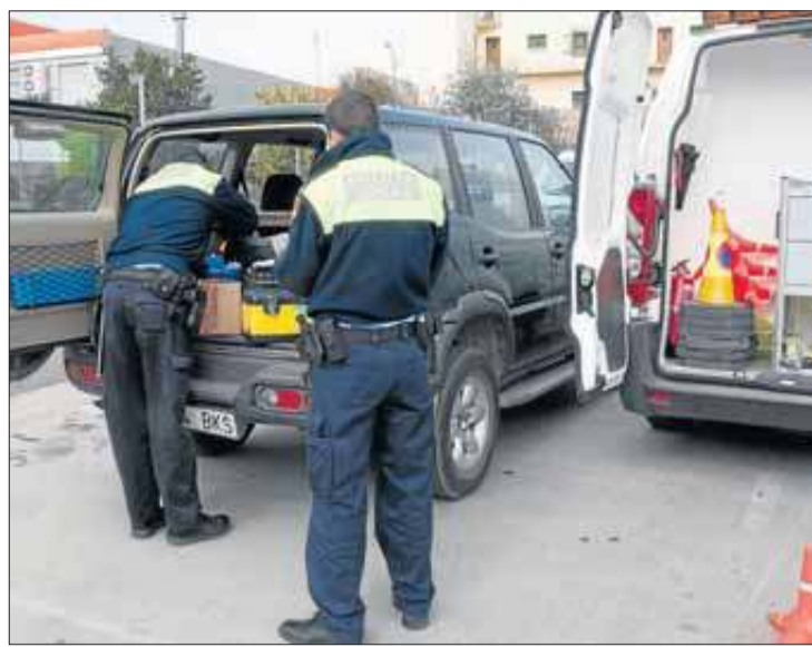
Dos agents escorcollant un vehicle.

També comenta que, malgrat la mesura de suprimir el servei nocturn de la Policia Local, les nits a la Jonquera no estan desateses, tenint en compte que hi ha els Mossos d'Esquadra permanentment i també els dos cossos policials estatals, la Guàrdia Civil i el Cos Nacional de Policia,