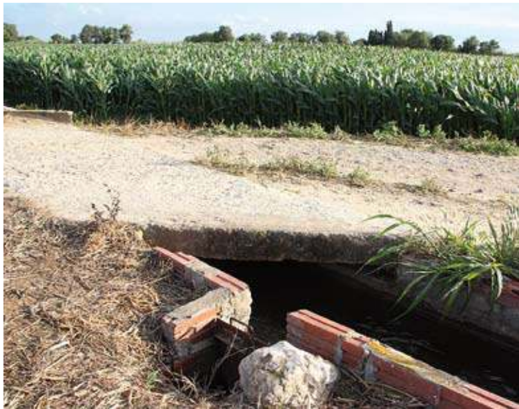
EL PONT. Aquest és el punt on va quedar atrapat el cadàver de la dona

El jutjat d'instrucció número 6 de Figueres va obrir aleshores una investigació per esclarir si havia estat víctima d'un homicidi. Després d'un any i mig d'investigació, el jutge ha dictat una interlocutòria per arxivar el cas i descarta la mort criminal o un suïcidi. La hipòtesi més probable és que la dona caigués al canal amb la seva gossa, que la força de l'aigua li impedís sortir del reg i que xoqués contra un mur d'un sífó.