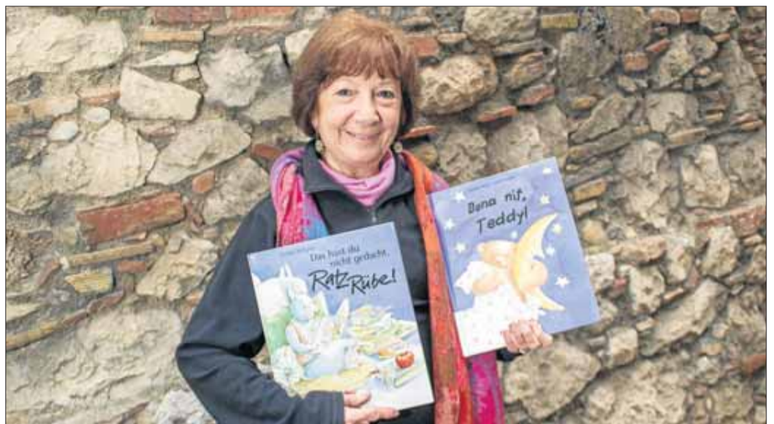
La il·lustradora amb alguns dels seus llibres infantils. BORJA BALSERA

L'artista acull amb entusiasme l'oportunitat de donar-se a conèixer a la comarca. Autora de diferents llibres infantils –el més recent sobre la història de l'escola d'Agullana– o de les aventures d' El Capità Enric a Mallorca , Velghe es caracteritza per crear personatges que transmeten màgia, com ara fades, personatges del món del circ o petits animals: “M'agrada dibuixar i escriure coses que no podrien passar a la realitat”. Ara, considera que “els di-