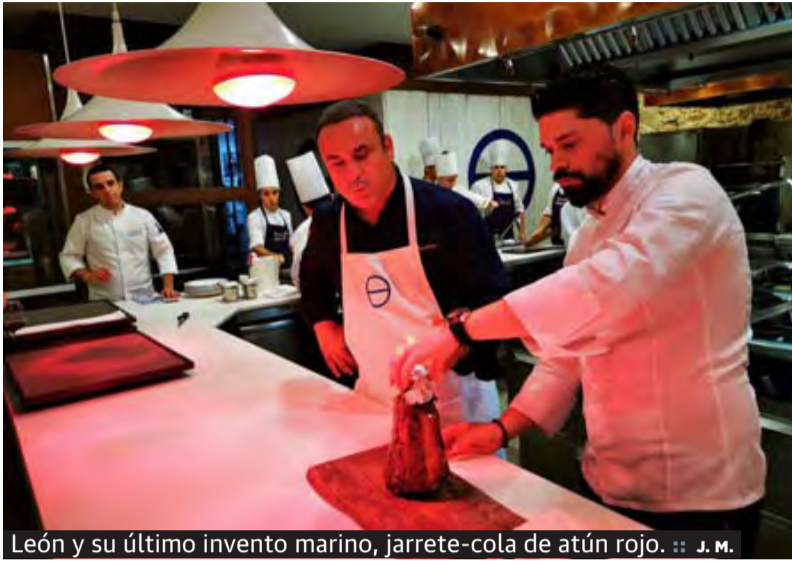
León y su último invento marino, jarrete-cola de atún rojo. :: J. M.