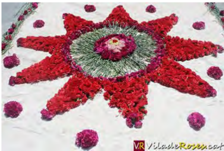
Una de les ornamentacions florals que ha engalanat avui els carrers de Roses

Hem cregut convenient començar aquesta informació amb aquesta interjecció que s'utilitza per aplaudir, com a forma de reconeixement de la gran tasca que han portat a terme avui els comerciants de Roses, i també particulars, en engalanar Roses amb les tradicionals catifes de flors per celebrar la festivitiat del Corpus.