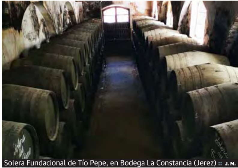
Solera Fundacional de Tío Pepe, en Bodega La Constanca (Jerez)

20 a 100 años, según especies, y las poblaciones de focas se recuperan en 10». «Aún así, considero que la acuicultura va a ser la única manera de alimentar a los 10.000 millones de personas que habitarán la Tierra».