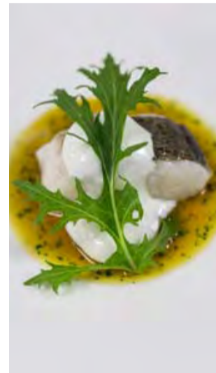
Merluza de Ribeira y jugo de caldeirada de Olleros.