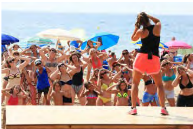
L'aeròbic platja arriba l'1 de juliol a Roses

Un estiu més, l'Àrea d'Esports de l'Ajuntament de Roses ofereix les sessions d'aeròbic platja durant els mesos de juliol i agost a les platges del Salatar i de Santa Margarida. Aquesta activitat, que s'iniciarà dilluns 1 de juliol, permet practicar esport a l'aire lliure d'una forma divertida i refrescar-se amb un bany en finalitzar la sessió.