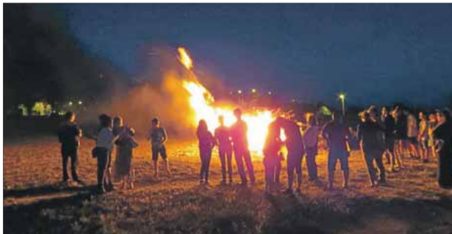
Pobles i ciutats celebren la nit de Sant Joan amb revetlles als carrers i platges

La nit més curta de l'any, però també la més ben aprofitada, és a tocar. Sant Joan és sinònim d'olor de llenya cremada, gent al carrer, sopars, competició de petards, foc i molta festa. I les revetlles sempre tenen els mateixos ingredients: arribada de la Flama del Canigó –enguany amb missatge escrit per Carme Forcadell–, lectura del manifest, sopar, foguera i música. Sense oblidar l'esperada coca de Sant Joan, de la qual el Gremi de Pastisseria de Barcelona preveu vendre'n 1,8 milions, amb un augment del 3% respecte a l'any passat, ja que la revetlla cau en cap de