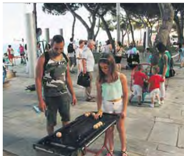
El Xalero ofereix tot tipus d'activitats i espectacles infantils al carrer i al passeig Marítim de Platja d'Aro