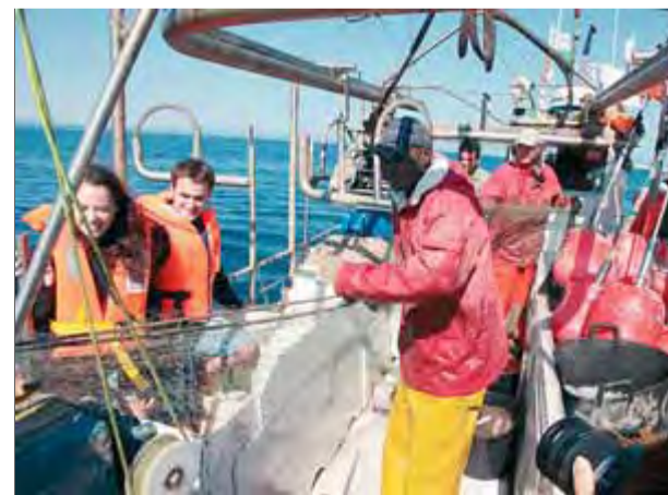
Uns turistes el dia en què es va estrenar l'activitat, el 4 de juny

L'activitat del Pesca Turisme és una iniciativa pionera a l'Estat que busca donar a conèixer la cultura marinera i al mateix temps oferir una proposta turística diferent en temps de crisi. ■