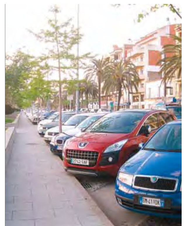
L'avinguda de Rhode és un dels espais en què Comerç de Roses veuria bé mantenir la zona blava a l'hivern ■ E. C.

En altres zones del municipi, com la marina, però, l'associació de comerciants de Santa Margarida es manifesta radicalment en contra de la zona blava. Aquest estiu a Roses la zona blava ha passat de les 111 places de l'any passat a un total de 284 places entre l'avinguda de Rhode, l'avinguda de Jaume I i l'aparcament del mercat cobert. Des de l'alcalde, expliquen que es farà un balanç després de l'estiu i s'estudiaran les propostes. ■