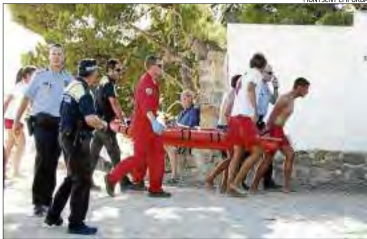
Els efectius d'emergències traslladant el jove cap a l'helicòpter.