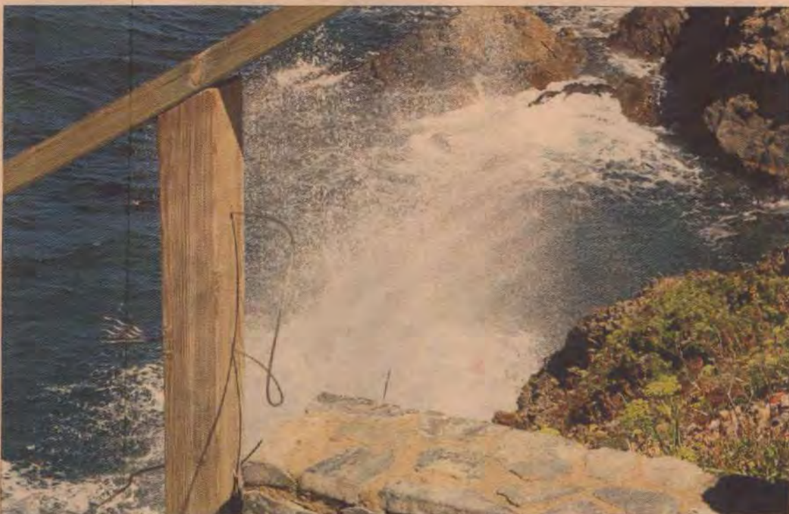
Imatge de vídeo d'un dels moments de la detonació de la bomba de la Guerra Civil

ment, els especialistes van posar una nova càrrega a les restes del projectil i, al migdia, la tasca s'havia completat.