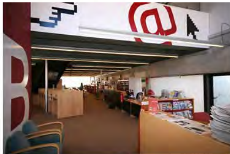
Biblioteca Jaume Vicens Vives de Roses

La biblioteca rosinca ha rebut durant els darrers dies una subvenció de 7.754 € de la Diputació de Girona, emmarcada dins la convocatòria d'ajuts per al subministrament de nou fons bibliogràfic, que té per objectiu contribuir a la renovació de la col·lecció bàsica de les diferents biblioteques gironines.