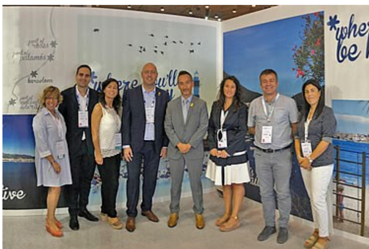
Els representants de Ports de la Generalitat, dels Ajuntaments de Roses , Palamós i Sant Carles de la Ràpita i del Patronat de Turisme Costa Brava-Girona presents en a la fira Seatrade Cruise Med.

La Generalitat de Catalunya, a través de l'empresa pública Ports de la Generalitat, participa amb altres institucions a la fira Seatrade Cruise Med 2018, amb els ports de Palamós (Baix Empordà), Roses (Alt Empordà) i Sant Carles de la Ràpita (Montsià), per donar a conèixer els serveis de les instal·lacions portuàries i l'oferta turística de les destinacions a les companyies de creuers, associacions, touroperadors i agents. La fira bianual Seatrade Cruise Med se celebra aquest any del 19 al 20 de setembre, a Lisboa (Portugal).