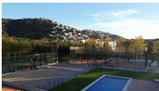
El potent Super Gran Slam de pàdel aterra a Roses

El Club Tennis Roses organitzarà, entre aquest diumenge dia 23 i el 30 de setembre, el Super Gran Slam de Pàdel. Es tracta d'un torneig obert a tothom i s'hi pot inscriure fins aquest dijous al web www.fcpadel.cat . «És la prova federada més gran de Catalunya, fa molts anys que aquesta prova no es fa a Girona», afirmen des del club rosinc.