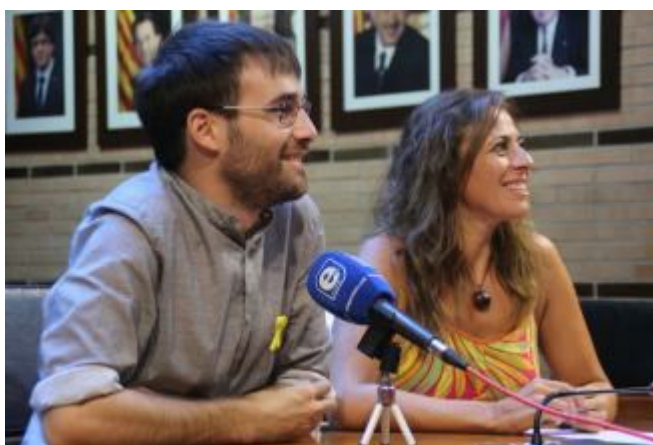
ERC de Roses proposa fomentar el xipatge i el cens de mascotes EMPORDA.INFO

La proposta es basa en establir un procediment de sanció consistent en requerir als propietaris d'animals que no disposin de la documentació obligatòria de l'animal (cartilla sanitària, número d'identificació de l'animal amb microxip registrat a nom seu i registre al cens municipal) que en un termini determinat de temps acrediti l'obtenció d'aquesta documentació, amb la consegüent obligatorietat d'identificar l'animal amb microxip i censar-lo. Amb això, la sanció econòmica no serà aplicada immediatament al propietari de l'animal, però aquells que no regularitzin la documentació en el termini establert seran sancionats amb les quantitats ja previstes a l'actual ordenança i seran requerits de nou a fer-ho amb la consegüent acumulació de sancions fins que no la presentin correctament.