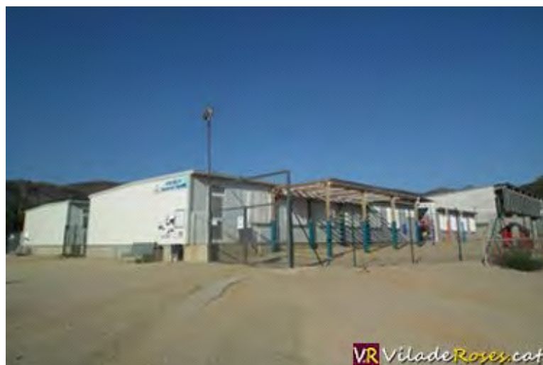
CEIP Montserrat Vayreda de Roses