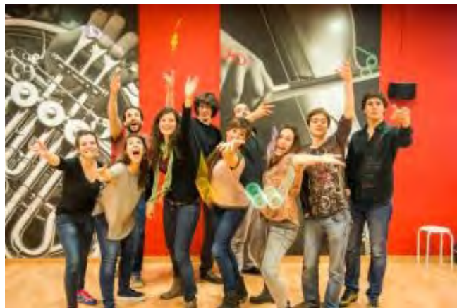
Companyia Òpera Jove EMPORDA.INFO

'L'empresari angoixat' (òpera composta per Domenico Cimarosa el 1786) és un espectacle teatral hilarant, amb un final catastròfic i inevitable, que ens mostra els draps bruts d'una companyia d'òpera en ple procés de muntatge.