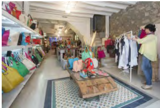
Una botiga de Roses EMPORDA.INFO

L'Àrea de Promoció Econòmica de l'Ajuntament de Roses prossegueix aquesta tardor amb el programa formatiu adreçat als comerciants del municipi amb dos tallers que tindran lloc els mesos d'octubre i novembre. La participació és gratuïta i cal inscripció prèvia, que ja es pot realitzar.