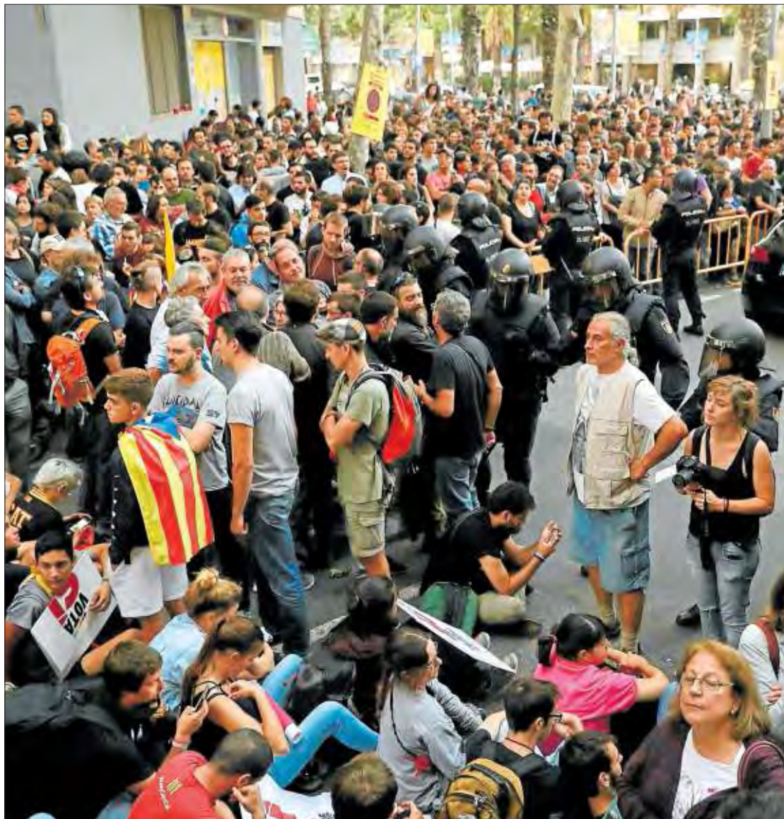
Manifestants i policies davant del local de la CUP a Barcelona, que no van poder escorcollar.

Segons pràcticament totes les enquestes, l'adhesió al projecte independentista mai no ha superat la meitat dels catalans. Era encara menor abans que es combinessin la sentència de l'Estatut i la majoria absoluta de Rajoy, que van crear un estat d'alarma que va