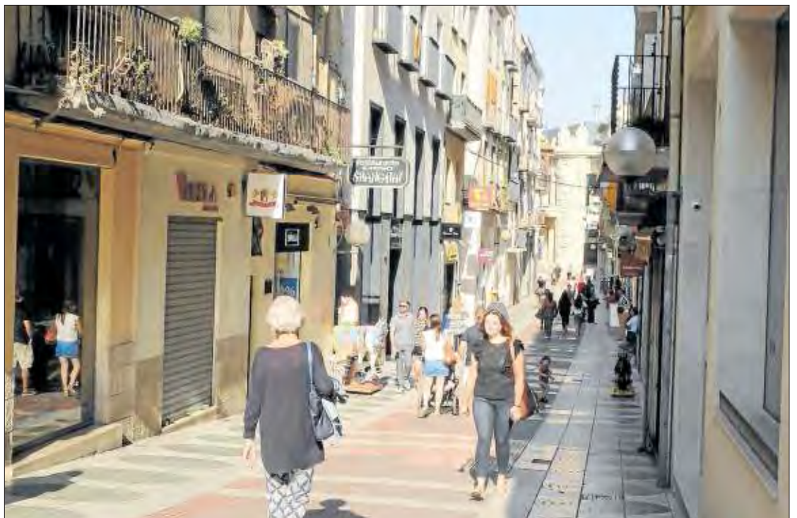
El carrer Peralada és un dels eixos comercials que es transformarà.