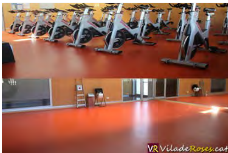
El nou paviment de les sales esportives de la Piscina Municipal de Roses

El terra de les sales de Spinning i de les activitats dirigides de la Piscina Municipal de Roses era des del 2006, des dels inicis de la instal·lació, de parquet, el qual donat al seu ús continuat durant 11 anys es trobava en un període de deteriorament bastant notable.