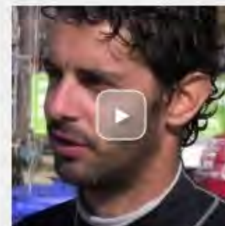
44º Trofeo Sofia Mapfre - Habla Carlos Paz - Jornada 2