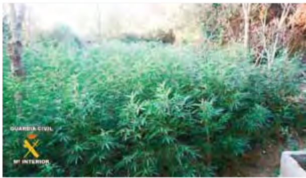
EL PUNT AVUI

comprar droga. Quan els policies es van identificar, l'home va ventar una coça a un dels mossos i va provar d'escapolir-se, tot i que sense èxit, perquè l'altre agent el va poder reduir. L'home duia 8 grams de marihuana, 15 d'haixix i dotze euros fraccionats. Per altra banda, els Mossos també van detenir tres traficants més que es dedicaven a vendre petites dosis d'haixix i marihuana al carrer. Tots ells van ser deixats en llibertat pel jutge. ■ ACN