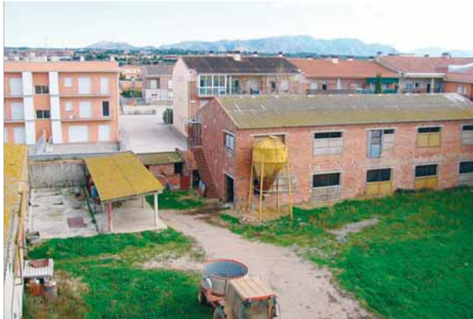
El POUM de Peralada es va aprovar el 2007 i va ser molt polèmic per la restricció a les granges. Posteriorment, es va modificar ■ M. VICENTE

L'Ajuntament diu que entén que el TSJC no entra en el fons del POUM i,