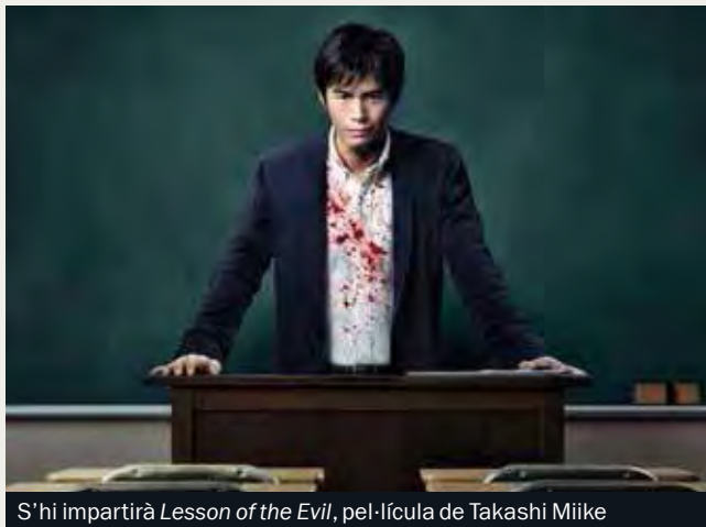
S'hi impartirà Lesson of the Evil , pel·lícula de Takashi Miike