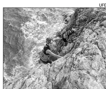
Els participants van completar proves especials d'aventura.

Els entorns del Tarragonès van ser l'escenari de la darrera prova puntuable de la Copa Catalana de Raids d'Aventura 2013 de la Federació de Curses d'Orientació de Catalunya, la qual suma més i més adeptes d'aquesta modalitat esportiva de l'orientació. Els participants de la categoria elit van invertir