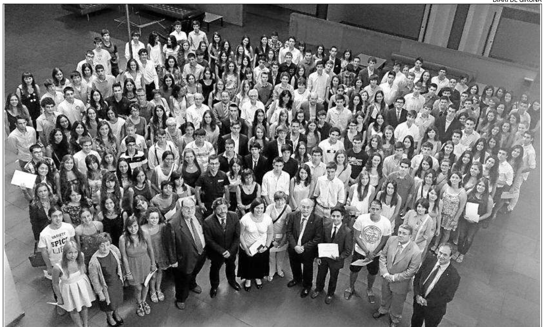
L'entrega de distincions als millors estudiants de la selectivitat es va fer al Palau de Congressos de Catalunya.