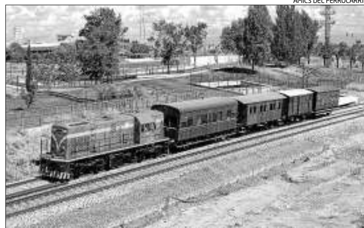
AMICS DEL FERROCARRIL

Més endavant, està previst que el trenet turístic pugui oferir altres serveis.