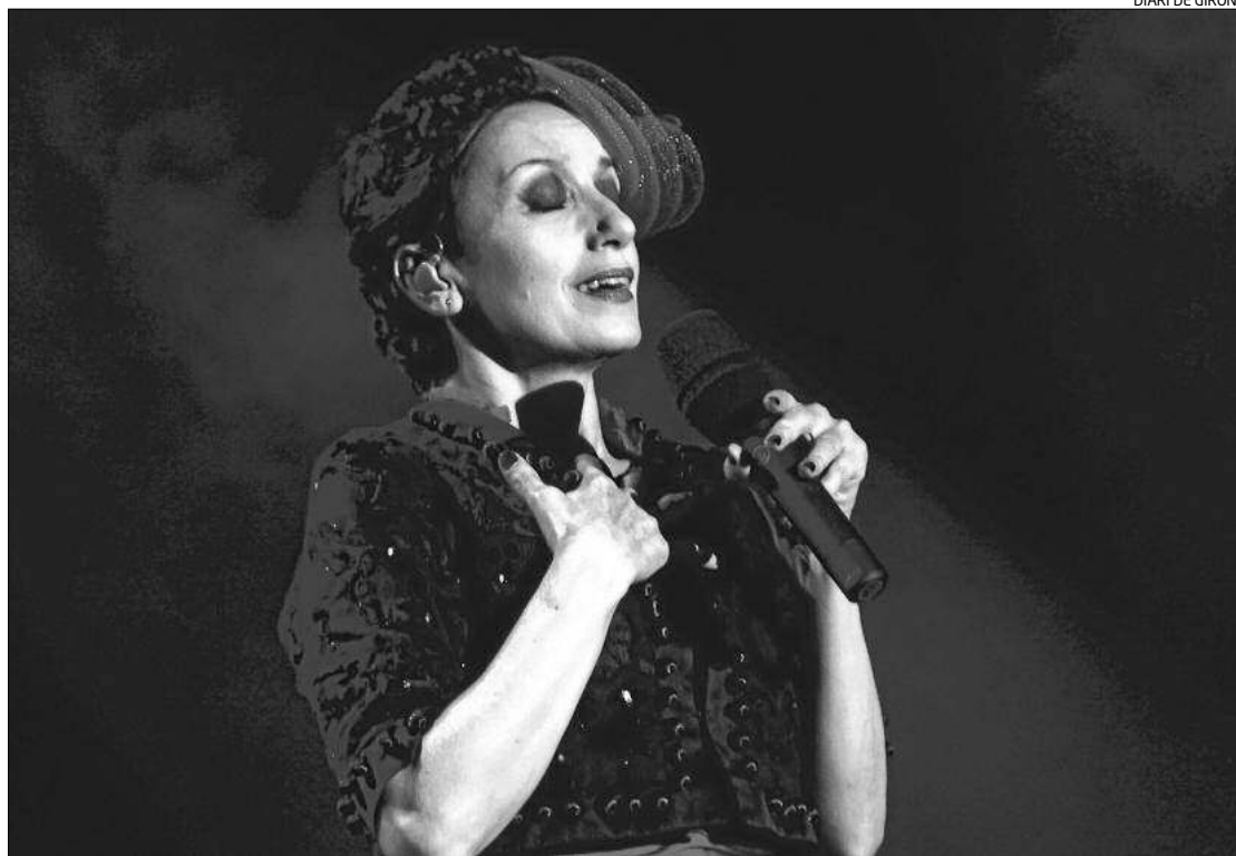
DIARI DE GIRONA

irebé ininterromput des de 1991. I és una gran sort, perquè és un públic molt entregat i respectuós a qui em dirigeixo en francès i amb el 80% del repertori cantat en espanyol, fet que suposa un gran exercici d'atenció per part seva.