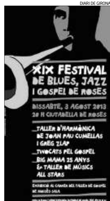
El cartell del festival rosinc.