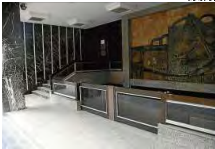
El local, de poc més de 1.000 m², es troba en uns baixos del Sant Pau.

«El local va portar molta polèmica però es va llogar per concurs públic i és una inversió perquè els diners que s'estan pagant no es perden sinó que es destinen íntegrament a la compra», insisteix l'alcalde. La controvèrsia pel lloguer de l'espai –de poc més de 1.000 metres quadrats– es va iniciar al 2010 quan primer es va dir que serviria pel Consorti de Serveis Socials amb Roses, Castelló i