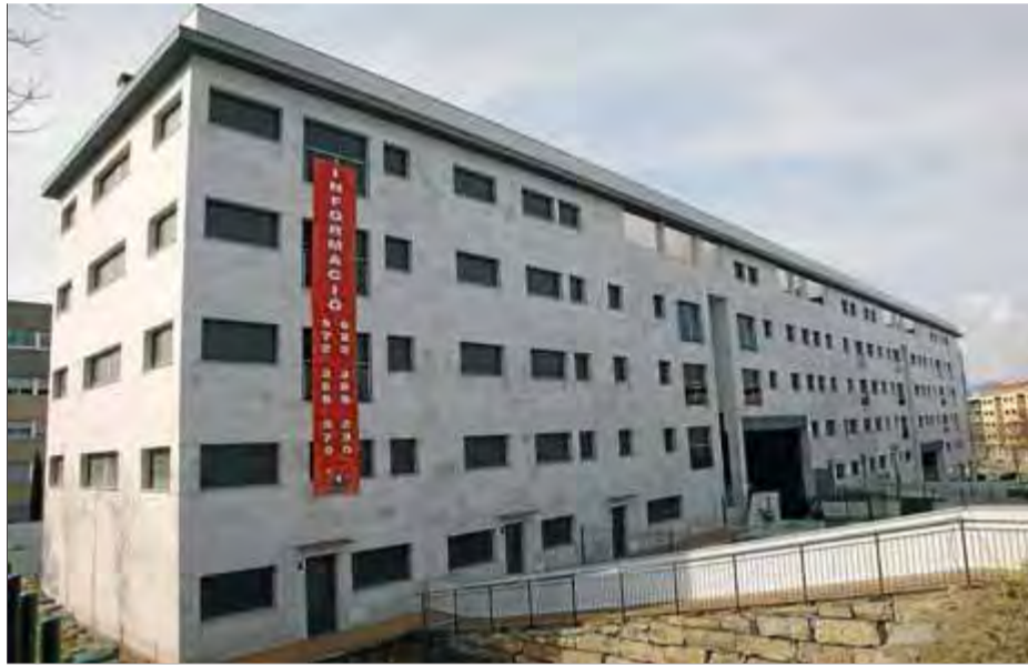
Imatge d'arxiu d'un bloc de pisos per vendre a Girona ■ JOAN SABATER

El nombre de compravendes d'habitatges que hi va haver a la demarcació de Girona en el segon trimestre de l'any és de 2.206, un 6,31% més que en el mateix trimestre del 2013, segons van assenyalar ahir els API de la demarcació, que conclouen que la compra per a segona residència i els compradors estrangers són els principals motors d'aquesta recuperació del sector. La majoria de compradors són britànics (16,7%), francesos (10,5%), russos (7,1%), alemanys (6,6%), belgues (6,1%) i suecs (5,7%). Junts acumulen més de la meitat del mercat. Dels 2.206 habitatges venuts a la demarcació de Girona, 1.349 els van comprar persones amb nacionalitat espanyola, mentre que 747 els van comprar persones d'altres nacionalitats però que residien a l'Estat. Pel que fa a les compres fetes per no residents a l'Estat, les mateixes estadístiques indiquen que hi va haver 35 compres d'habitatges fetes per estrangers no residents. Els API destaquen que es tracta d'una dada representativa perquè aquests dos trimestres no estan influenciats per can-