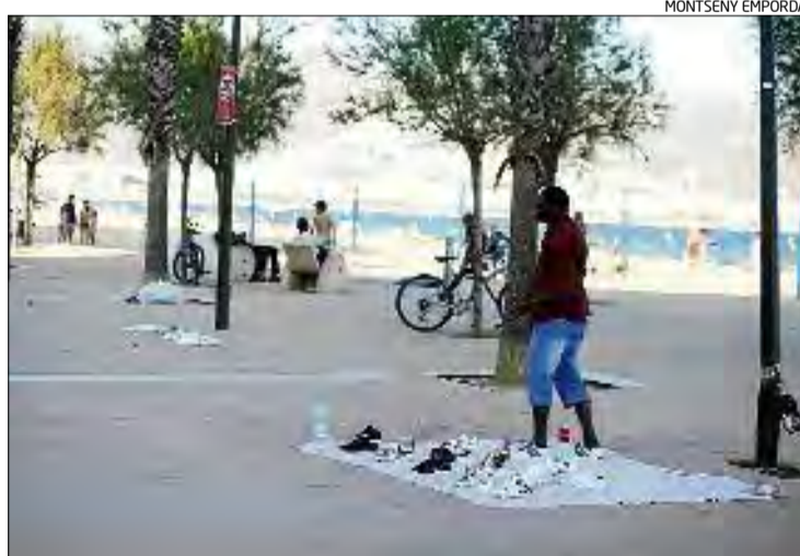
Venedors ambulants il·legals al passeig de Santa Margarida.