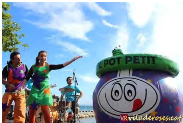
Espectacle de la companyia El Pot Petit a Roses

Els espectacles infantils que l'Àrea de Turisme de l'Ajuntament de Roses organitza cada estiu, sota el certificat de Destinació de Turisme Familiar, s'allargarà aquesta temporada fins al proper 6 de setembre per tal de recuperar la realització dels tres espectacles que s'han vist anul·lats a causa del mal temps.