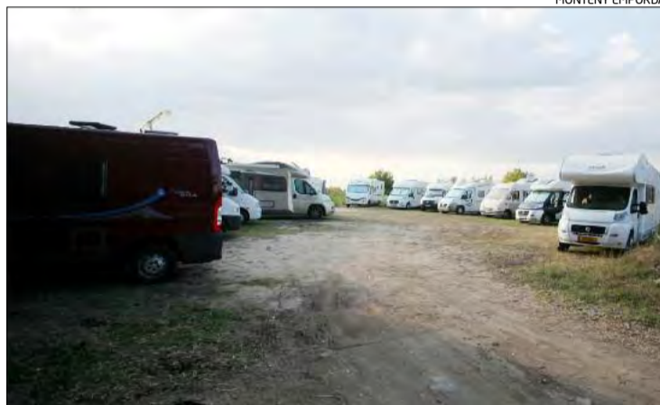
Autocaravanes en una zona de Santa Margarida.