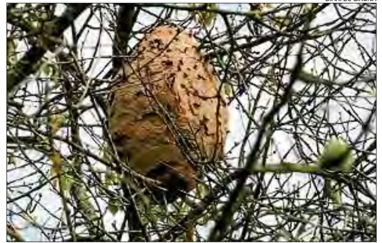
Un niu de vespa asiàtica, espècie que posa en perill les abelles.