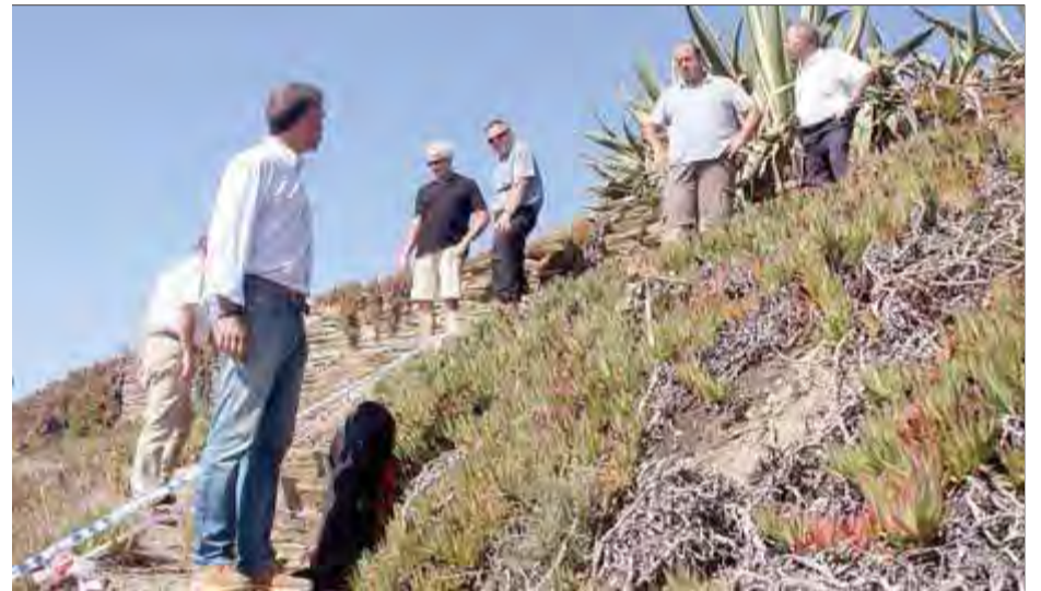
La visita que van fer ahir l'alcalde i els tècnics de Costes a la zona

Dilluns passat una roca d'aquesta cala es va desprendre de la paret de pissarra que la flanqueja i va caure damunt d'una turista francesa, que va morir a l'acte. Després de l'acci-