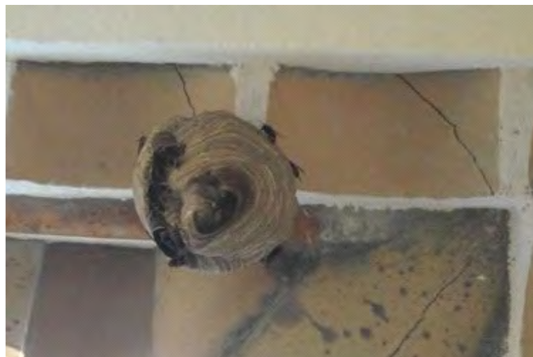
El niu localitzat ahir e una casa de Roses

Ahir a la matinada els Agents Rurals del Departament d'Agricultura, Ramaderia, Pesca, Alimentació i Medi Natural van poder enretirar amb èxit un niu de vespa velutina instal·lat en una casa d'una urbanització de Roses. La retirada d'aquest niu és important perquè es tracta d'un niu definitiu i s'hauria anat