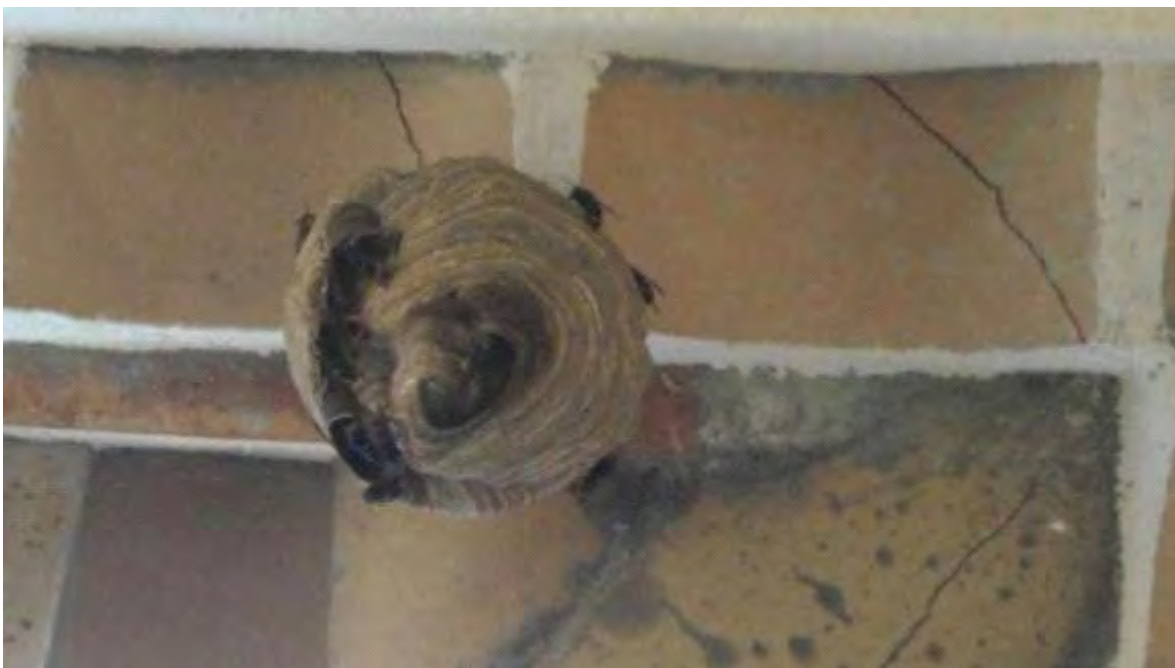
El niu de vespa asiàtica localitzat en una casa de Roses

És el quart que s'extreu a les comarques gironines aquest any