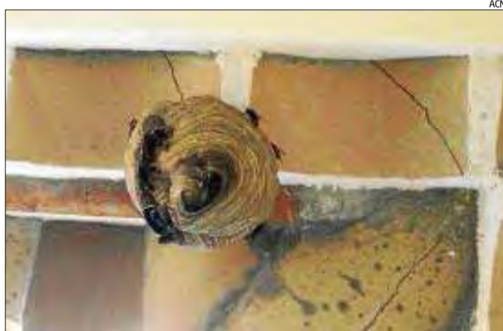
El niu, abans de ser retirat de la casa de Roses.

Els Agents Rurals van constatar que el niu encara era de dimen-