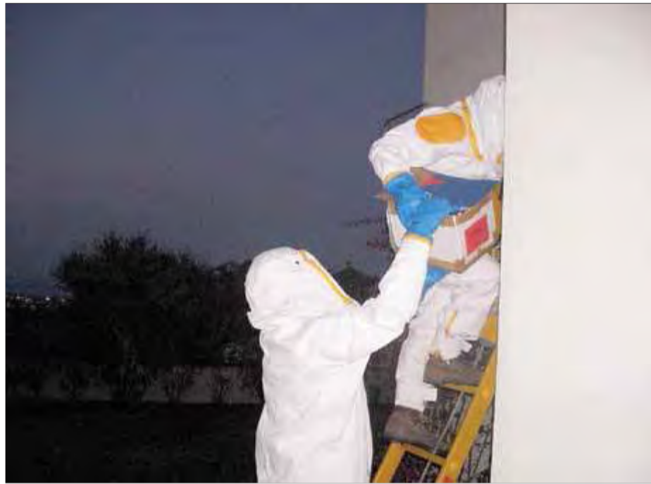
Agents rurals en el moment de la retirada del niu de vespa asiàtica d'una casa de Roses dimarts a la matinada

Segons la Generalitat, la retirada d'aquest niu és important perquè es des-