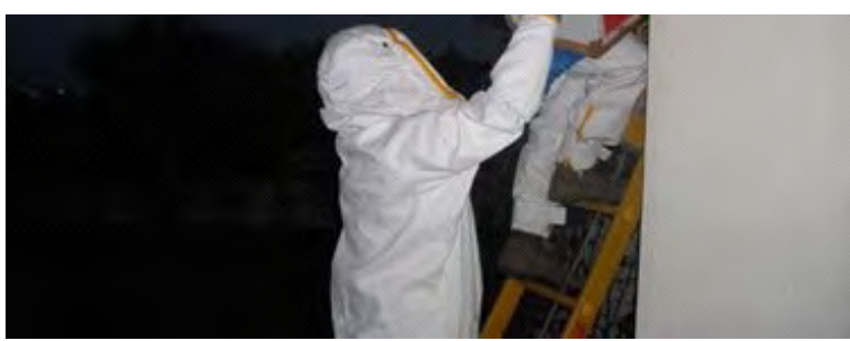
Moment de la retirada del niu a la matinada d'ahir

l'Estany, 4 a l'Alt Empordà, 5 a la Garrotxa, 2 al Gironès i 1 al Ripollès.