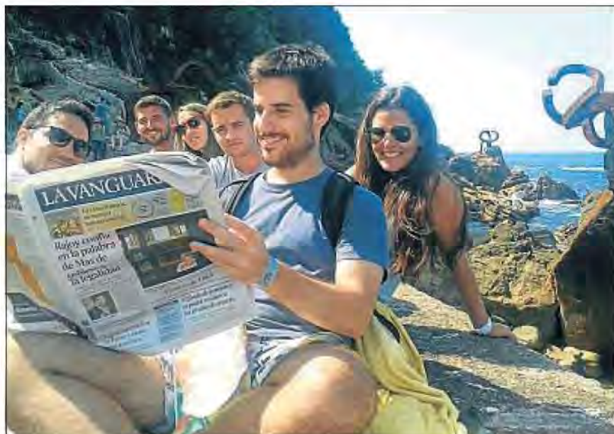
Amb un grup d'amics vam anar a passar el cap de setmana a Sant Sebastià i vam aprofitar el bon temps per llegir La Vanguardia a La pinta del vent.

PER PARTICIPAR-HI, ENVIU LES FOTOS A http://concursodofotos.lavanguardia.com/