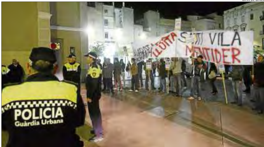
Una de les mobilitzacions que membres de la Guàrdia Urbana han realitzat en els darrers temps.

passada van rebre la notificació de l'anunci d'aprovació de la llista d'aspirants admesos i exclosos, la designació del tribunal i la fixació de la data d'inici de les proves selectives –les psicotècniques estarien previstes pel proper dia 3 de setembre–. Malgrat això, asseguren que no han rebut resposta sobre l'informe que van presentar el passat mes de maig en el qual proposaven que la realització de les proves psicotècniques les fes l'Institut de Seguretat Pública de Catalunya. També que «elecció de la segona i la tercera prova es realitzés per sorteig el mateix dia de les proves». La principal motivació d'aquesta demanda, insisteixen, és que les «irregularitats» detectades en el procés de selecció d'una plaça d'inspector a Girona que «van obligar a paralitzar el procés i a reiniciar-lo amb l'Institut». A part d'aquest escrit, des de la Junta asseguren que van expressar aquesta inquietud al regidor de personal i al cap de recursos humans. «En data d'avui -21 d'agost- encara no hem rebut de manera