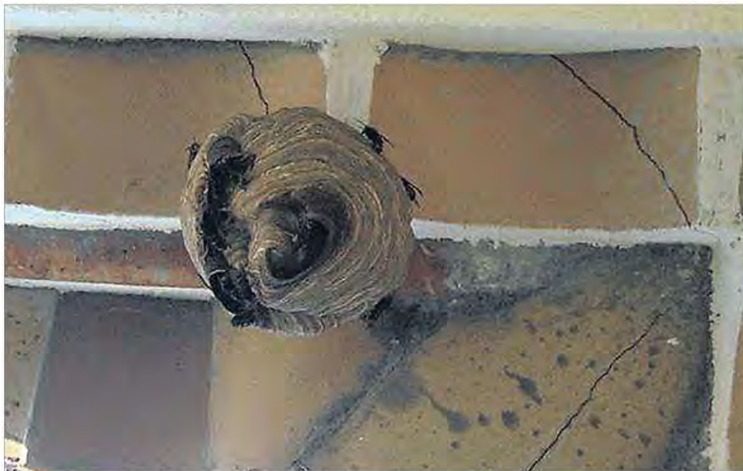
El nido de 'avispa asesina' hallado en Roses.