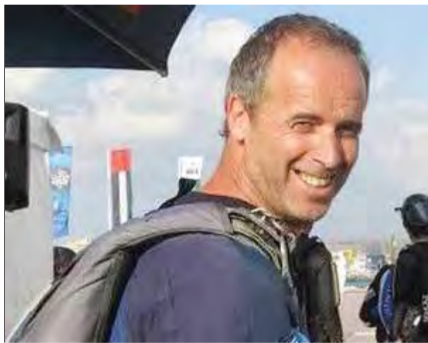
El reporter, en una foto del seu web ■ BRUNOBROKKEN.COM

Per la seva banda, els Mossos d'Esquadra continuen la investigació que ja