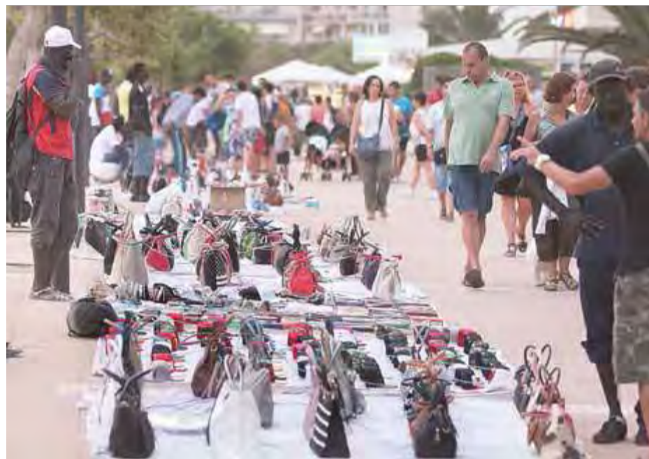
Un venedor de 'top manta' al passeig marítim de Roses, en una imatge d'aquest mes. L'Ajuntament calcula que n'hi ha uns dos-cents cada dia ■