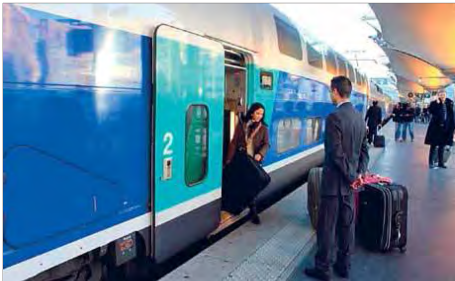
Un TAV Barcelona-París a l'arribada a l'estació de Lió de la capital francesa

Concretament, la campanya estarà disponible per a les compres que es facin entre l'1 i el 10 de setembre per viatjar a París, Lió, Valença, Marsella, Avinyó, Ais de Provença, Tolosa i Carcassona entre el 15 de setembre i el 9 de desembre des de Barcelona, Girona i Figueres. Segons explica Renfe, per accedir a aquest preu promocional de 25 euros, la compra es pot fer a través de qualsevol dels canals habituals de venda: el web renfe.com, les estacions i les agències de viatge.