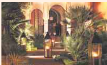
Arquitectura tradicional marroquí y 'art déco'.

boutique o su spa de 2.500 metros cuadrados. Metros y metros de historia, arte y cultura para vivir la magia árabe.