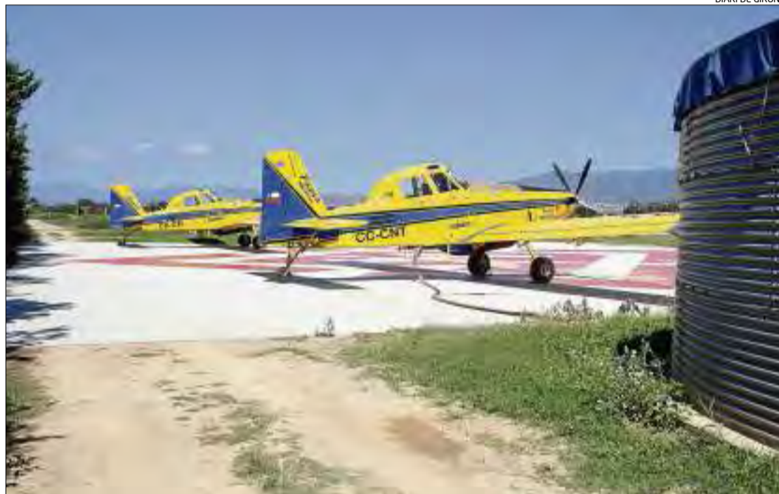
L'avioneta utilitzada pel pilot per fer la descàrrega d'aigua i que es dedica a l'extinció d'incendis.

El pilot de l'aeronau, utilitzada per a la campanya d'extinció d'incendis i contractada pel Ministeri d'Agricultura, Alimentació i Medi Ambient (Magrama), va admetre