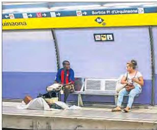
Un manter busca clients a l'estació de metro d'Urquinaona

Una cinquantena de venedors il·legals apedreguen els policies municipals que volien desallotjar-los en ple centre de Barcelona