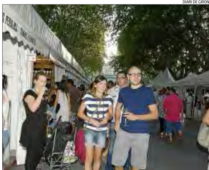
La fira ha aconseguit consolidar-se com un referent del sector.

Es posaran a la venda uns 7.000 tiquets amb degustacions de vins, d'alimentació, la copa personalitzada i un tast gratuït, entre d'altres per un preu de 10 euros.