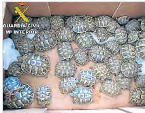
Nou exemplars adults i 43 cries destinades al comerç

teix a tirar-se una galleda d'aigua freda per ajudar els malalts d'esclerosi lateral amiotròfica (ELA). Després de l'accident, els Mossos d'Esquadra van prendre declaració al pilot, de 43 anys, nacionalitat xilena i veí de Roses. Els fets van tenir lloc a l'aeròdrom d'Empuriabrava. L'avió utilitzada pertany a una empresa contractada per a la campanya d'extinció d'incendis forestals. La tona i mitja que va descarregar des d'una altura d'uns set metres a prop de la pista d'aterratge podria haver matat la víctima.