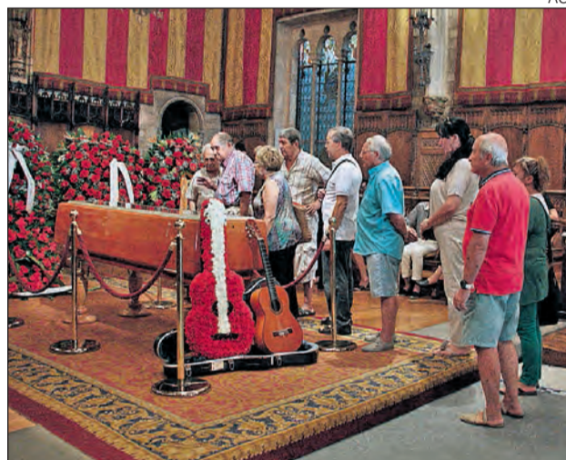
La capella ardent de Peret instal·lada a Barcelona.