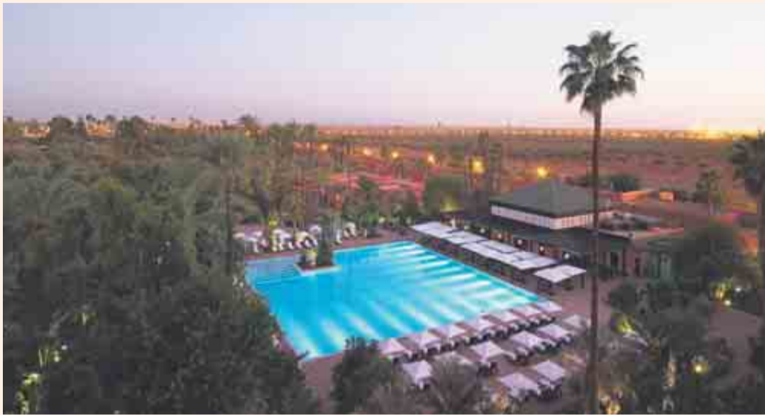
La Mamounia es un remanso de paz en el corazón de Marrakech, a cinco minutos de la plaza Jemaa el-Fnaa.