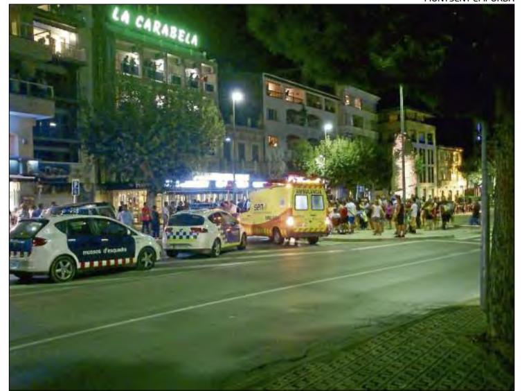
Mossos, Policia, l'ambulància i nombrosos curiosos durant la baralla.

plicar que eren més els que van acabar intervenint, cosa que va propiciar la presència d'un fort desplegament policial amb agents mitjançant per separar les persones que s'agredien. Això passava mentre desenes de persones s'aplegaven al voltant i als balcons. Segons els Mossos, es van detenir dues persones per lesions.