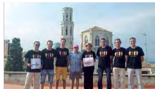
EL PUNT AVUI