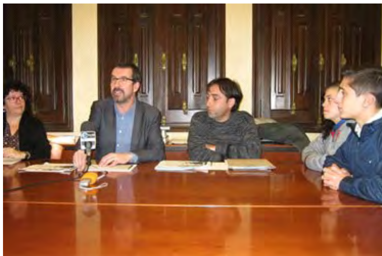
Moment de la presentació del Pla Okup'Alt 2015

La setmana passada va començar la cinquena edició del Pla Okup'Alt, una iniciativa que es coordina des de l'àrea de Joventut del Consell Comarcal adreçada als joves de l'Alt Empordà, d'entre 16 i 19 anys, per tal d'oferir formació gratuïta en diversos oficis. En aquesta edició, en concret, la formació que s'ofereix als 37 joves