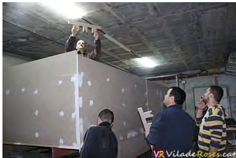
Quatre 'Amics' de Pippi Calzaslargas treballant a la seva carrossa

La colla Els Amics abandonen Rússia, on es van desplaçar durant el Carnaval de Roses de l'any passat per viatjar a Suècia. Allà, en Villa Villekulla, viu una noia que té una força extraordinària, tanta com el seu esperit friki (perquè ho és una estona), amb unes trenes de color pèl-roig, unes sabates que li venen grans i unes mitges per sobre dels genolls.