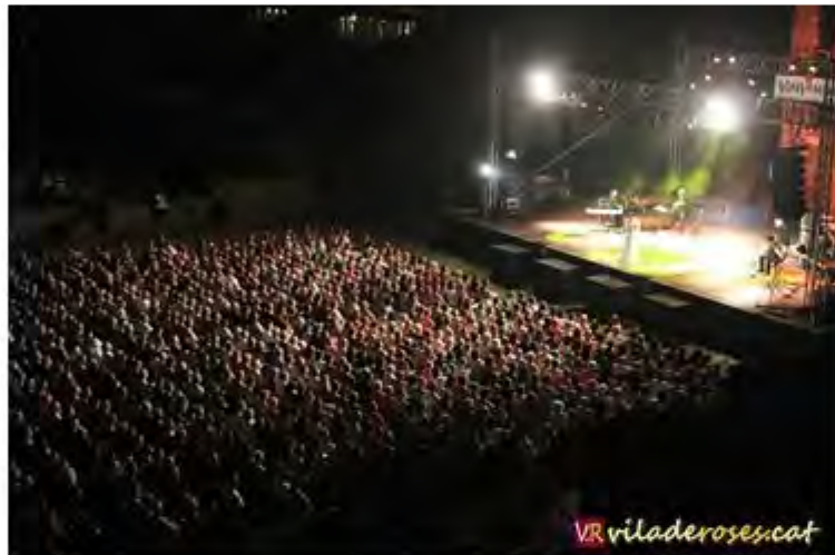
Panoràmica de La Ciutadella durant el concert de Luz Casal

Per un costat, ha aconseguit una mitjana d'ocupació del 92,5%, la qual cosa significa un 20% més de públic respecte a l'edició del 2012. S'ha passat de 5.500 espectadors al 2012 a 6.600 al 2013