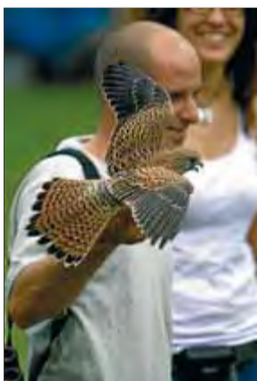
Una imatge de l'alliberament d'una au del centre de fauna ■ M.L.L.

El Departament d'Agricultura i Medi Natural de la Generalitat, la Diputació de Girona i la laeden-Salvem l'Empordà han arribat a un acord de col·laboració que ha de permetre garantir el funcionament del Centre de Fauna dels