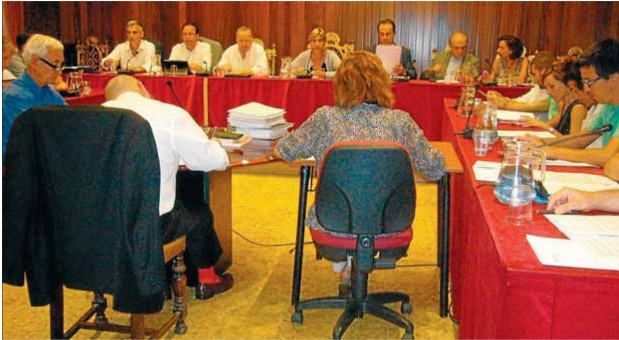
El ple que es va fer ahir a l'ajuntament de Figueres, avançat del mes d'agost

res es va adherir al Pacte Nacional pel Dret a Decidir, amb una àmplia majoria. Va rebre el suport de CiU, ERC, ICV, CUP i AMC, i només el PP hi va votar en contra i el PSC es va abstenir. ERC va "lamentar" que el PSC no