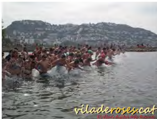
Travessia Local de Natació 2012

El proper diumenge 11 d'agost, a les 11h, se celebrarà la 28a Travessia Local de Natació, Trofeu Enric Badosa, amb participació oberta a tothom però amb opció a premi només per als nascuts o empadronats a Roses. La distància serà d'uns 700 m, el recorregut consistirà en donar la volta als dos espigons de la Riera Ginjolers, sortint des de la Platja de la Punta i arribant a la Platja Nova.