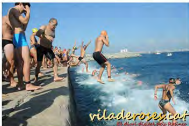
Travessia de Natació al Port de Roses 2012

Per altra banda, el proper dijous 15 d'agost, se celebrarà la 77ª Travessia de Natació al Port de Roses. Enguany és organitzada pel Grup d'Esports Nàutics de Roses (GEN) i presenta un nou recorregut. Hi haurà dues distàncies: una de 750 m per a la categoria aleví, amb sortida a les 10.00h, i una altra de 1.500 m per la resta de participants, amb sortida a les 11h. Tant la sortida com l'arribada, de les dues