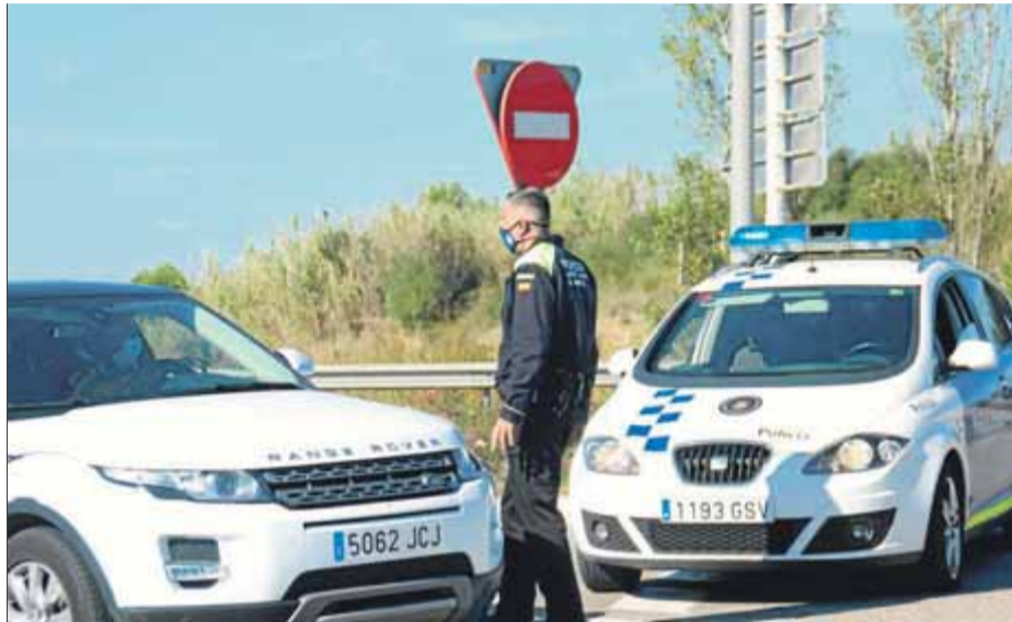
Control de la policia local de Roses, a la rotonda del Nautic Center