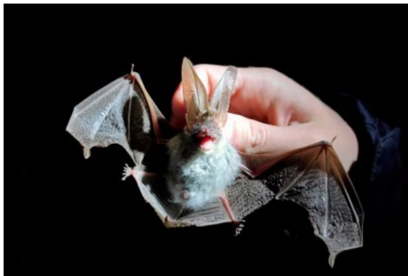
Un ratpenat orellut

L'estudi també ha permès capturar un ratpenat orellut gris o meridional ( Plecotus austriacus ) al mas de Rabassers de Baix. La principal colònia coneguda de l'espècie al parc natural se situa al monestir de Sant Pere de Rodes. En un seguiment realitzat fa uns anys es va poder constatar que normalment s'alimenten a la plana de l'Empordà seguint les taques arbrades que troben pel camí. La distància entre la zona de refugi i la zona d'alimentació mostra la importància que té el monestir per a aquesta espècie, i la manca de refugis adients més propers. Per això, el personal expert considera una troballa important la constatació que també l'espècie aprofita altres zones humides del parc, com l'embassament de Rabassers, per a alimentar-se.