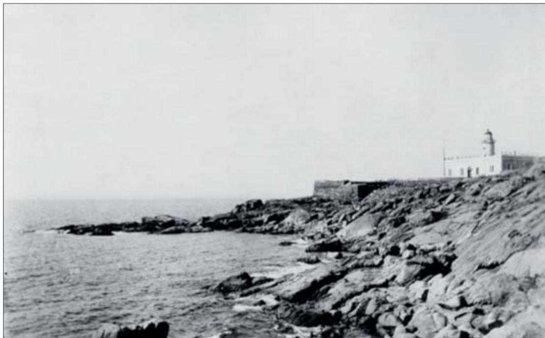
Sobre aquestes línies, el Far de Roses, i a la imatge inferior, una fotografia antiga.