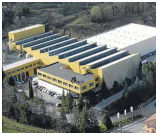
L'empresa de Sant Joan de les Abadesses ha pogut recuperar-se del confinament amb un nou producte