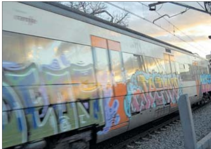
Un dels trens de la línia R11, al seu pas per Figueres. MAIRENA RIVAS

Els usuaris del tren manifesten que «s'està creant molt de malestar pels retards, gairebé diaris, d'ençà de fa uns mesos, a causa de les obres d'Adif al soterrani de l'estació de Barcelona-Sants». I és per aquesta raó que demanen que Renfe i Adif es coordinin millor i que informin d'una manera més adequada e-ls viatgers.