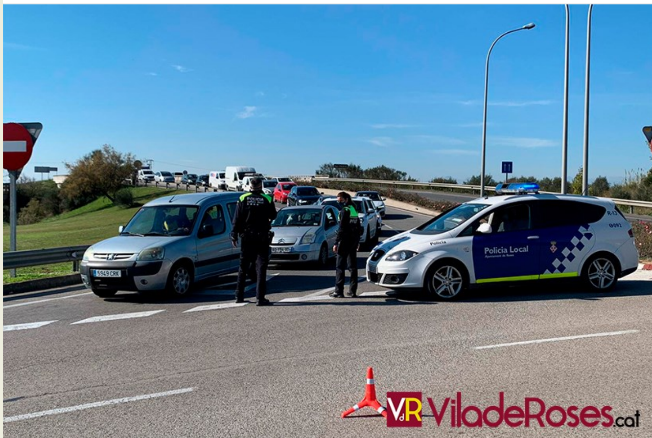
La Policia Local de Roses fent un control de confinament municipal