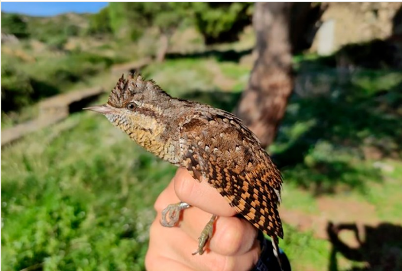
Un colltors anellat durant el 'Cap de Creus Autumn Weekend'

Respecte de l'any passat, s'han anellat més de 1.000 exemplars més, i per primer cop un becadell comú, dos colltorts, i un pardal roquer