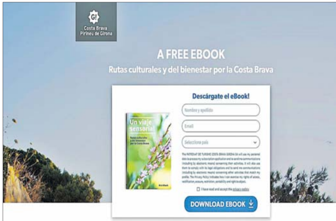
Pagina d'inici a partir de la qual és possible descarregar-se el llibre gratuïtament. PTCSBG

Titulat Un viaje sensorial: Rutas culturales y del bienestar por la Costa Brava , consta de 55 pàgines i està dividit en quatre capítols dedicats a diverses rutes temàtiques: la ruta de les herbes mediterrànies, de Blanes a l'Escala; la ruta de l'aigua, de Caldes de Malavella