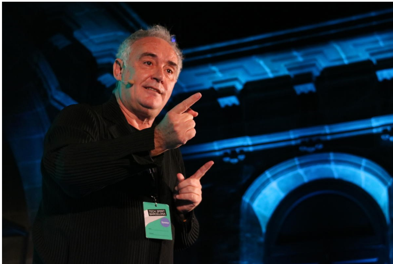
El responsable d'El Bulli Foundation, Ferran Adrià, al Tech Spirit a la Llotja de Mar, el 25 de febrer del 2020.

Ferran Adrià ha anunciat aquest dissabte, 31 d'octubre, la segona convocatòria de professionals per poder treballar a elBulli1846, el seu nou projecte de la cala Montjoi de Roses. Les bases estan penjades a la pàgina web de la fundació i els aspirants podran apuntar-se des d'aquest diumenge 1 de novembre fins el 15 de desembre.