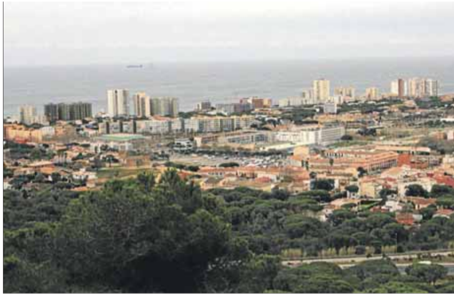
Vista general del nucli de Platja d'Aro, on l'IBI es reduirà l'any vinent ■ E.A.

A Llagostera, dimecres, el ple va aprovar unes ordenances fiscals per al 2021 que preveuen una congelació de l'IBI tant rústic com urbà. Igual que a Platja d'Aro, també es va modificar la redacció de l'apartat sobre el recàrrec del 50% per als habitatges buits, que no s'aplicarà fins al cap de dos anys. La taxa d'escombraries, en canvi, pujarà del 5% per a bars, restaurants i comerços i del 10% per a fàbriques, tallers i habitatges. L'augment es justifica, en-