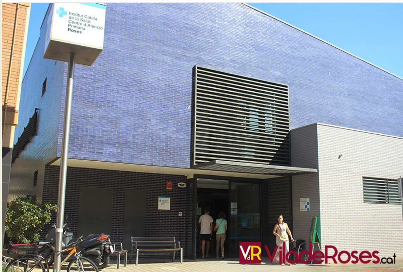
El Centre d'Atenció Primària de Roses

Una proposta que va presentar el PSC Roses i que va ser aprovada per tots els grups polítics menys Junts per Roses i ERC