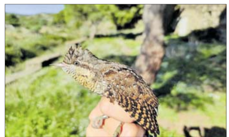
Un Colltort que es va anellar durant la jornada. TERRITORI I SOSTENIBILITAT

En els propers mesos s'analtzaran les dades per tal de conèixer les característiques de les aus que s'aturen aquí i si hi ha diferències segons l'hàbitat que utilitzen.