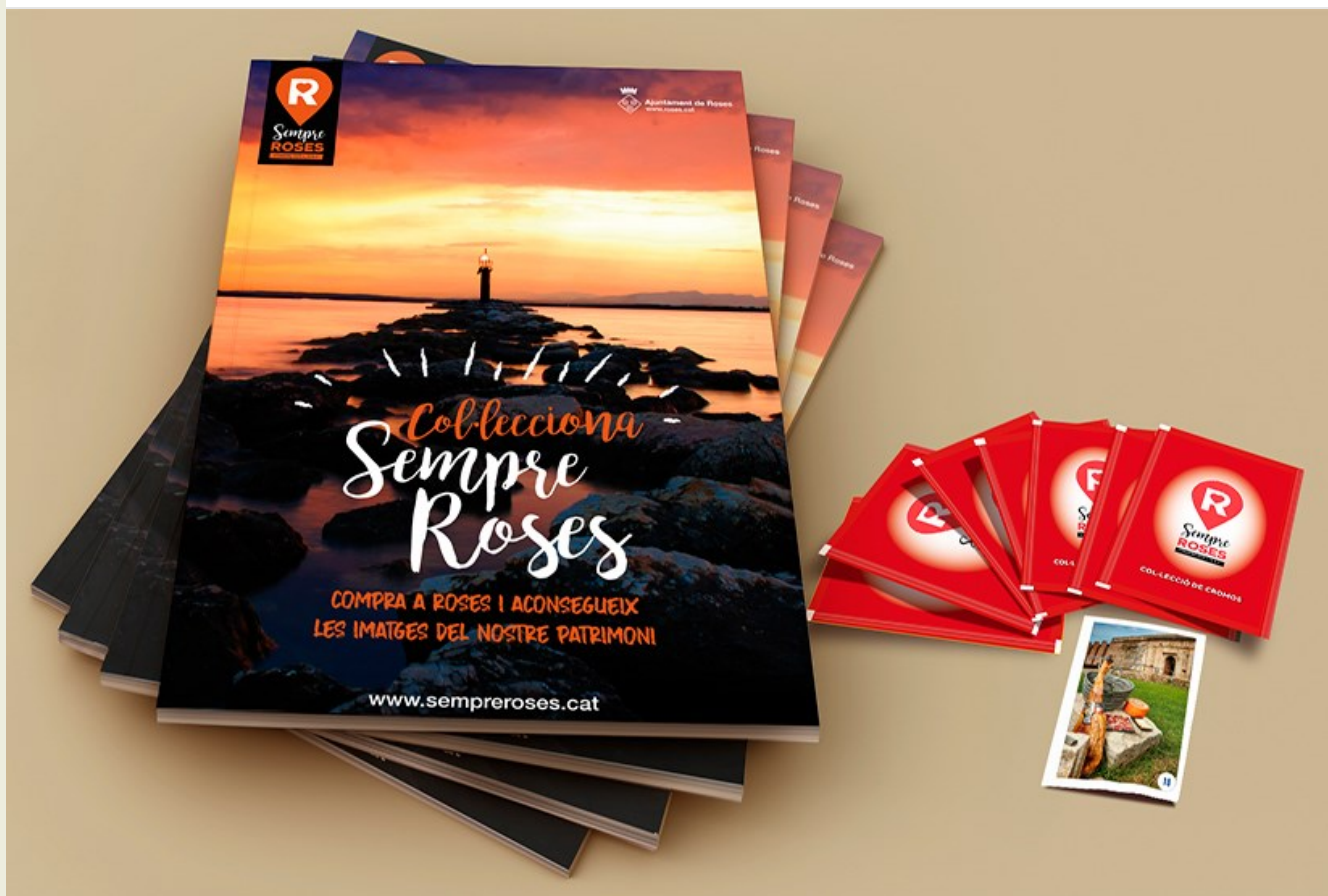
Àlbums i cromos de la campanya de la campanya "Col·lecciona Sempre Roses"