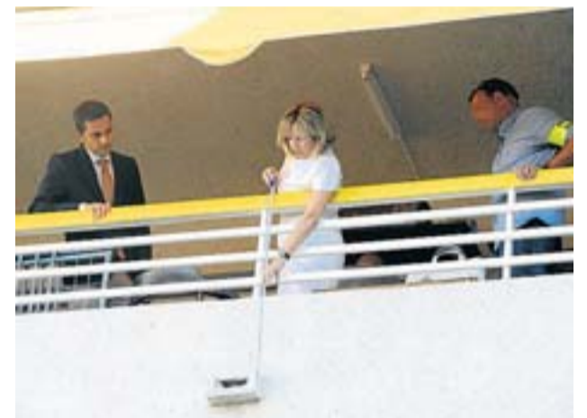
La fiscal inspeccionant el balcó de Salou.