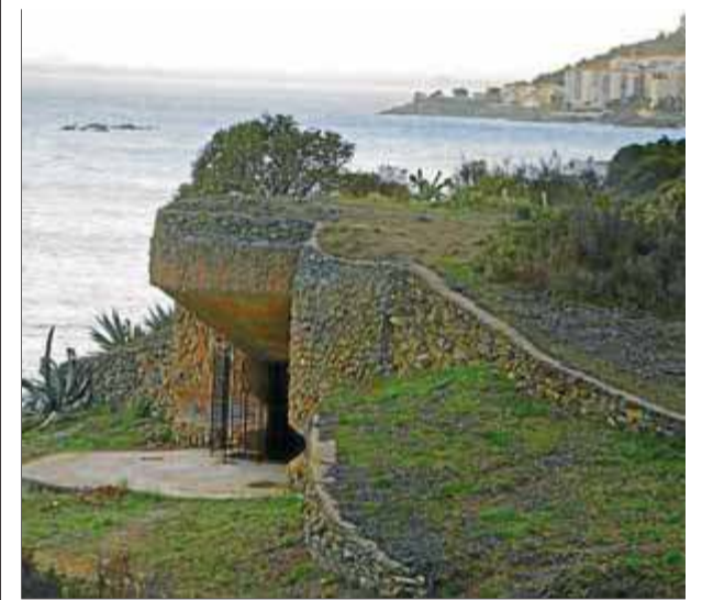
Imatge de punta Falconera, un espai natural on l'Ajuntament invertirà

■ El ple va aprovar millores a punta Falconera, la Ciutadella i el 'castrum'