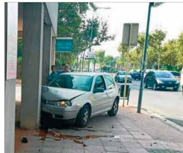
El turisme accidentat dilluns a l'avinguda Catalunya de Palamós

cies Mèdiques (SEM). Els sanitaris van atendre l'home, de 39 anys, de les ferides lleus que s'havia fet en el xoc, i no va caler traslladar-lo a l'hospital de Palamós. Tal com informava ahir Ràdio Palamós, la policia va fer al conductor del vehicle una prova d'alcoholèmia, que va donar negatiu. ■