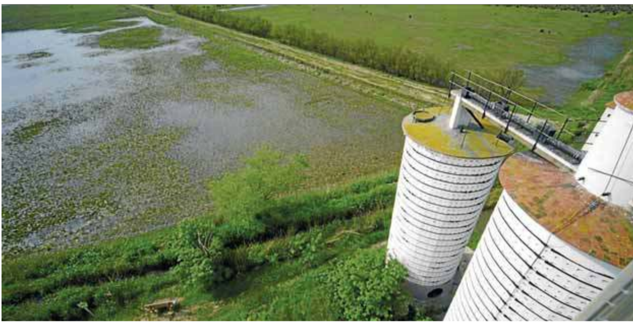
La zona del Mas Matà, on han trobat els ocells morts, en una imatge d'arxiu ■ LLUÍS SERRAT