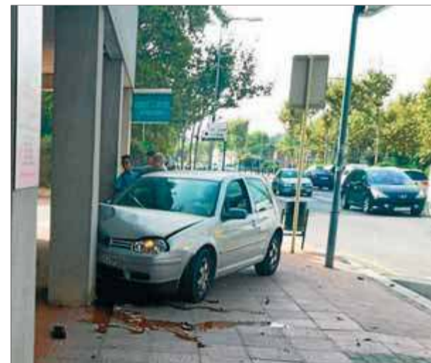
El turisme accidentat dilluns a l'avinguda Catalunya de Palamós

cies Mèdiques (SEM). Els sanitaris van atendre l'home, de 39 anys, de les ferides lleus que s'havia fet en el xoc, i no va caler traslladar-lo a l'hospital de Palamós. Tal com informava ahir Ràdio Palamós, la policia va fer al conductor del vehicle una prova d'alcoholèmia, que va donar negatiu. ■