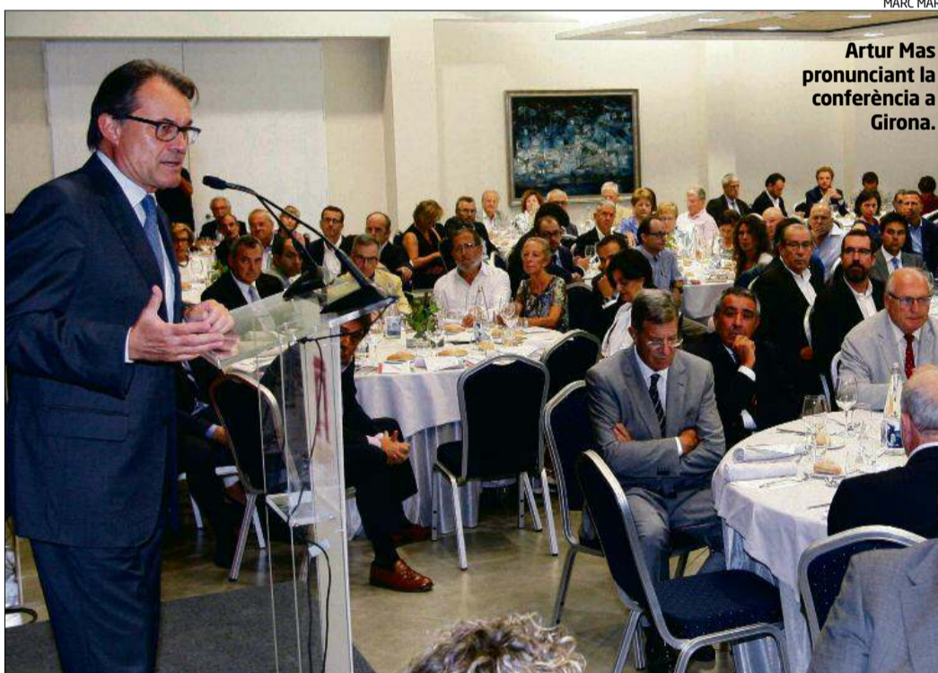
MARC MARTÍ Artur Mas pronunciant la conferència a Girona.

► El PP anuncia una reforma d'urgència perquè el Tribunal Constitucional pugui sancionar Artur Mas