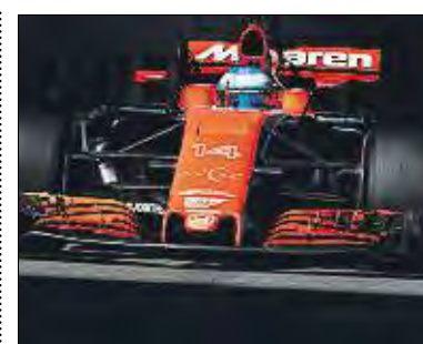
Boullier señala a Honda de nuevo

Sin embargo, lo que sí parece claro es que la temperatura ambiente será bastante baja, situándose durante todo el día rondando los 10°C y sin llegar a pasar de los 15°C, un hecho que hará que la pista esté fría, lo que sumado a la humedad que se espera podría precipitar algún susto