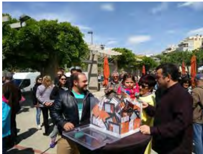
El restaurant Can Ramonet guanya amb els vots del públic.

La tapa «deconstrucció de l'escudella» de Can Ramonet s'ha proclamat guanyadora de la II Ruta de les Tapes de Roses. El passat diumenge, va tenir lloc a la plaça Catalunya de Roses, en el marc de la celebració de la Mostra del Vi de la DO Empordà, es va donar a conèixer el guanyador a la millor tapa de la Ruta de les Tapes de Roses 2017, premi que va recaure sobre l'establiment Can Ramonet.