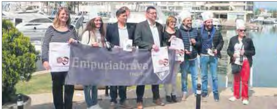
Restauradors i càrrecs electes van presentar el primer Brava Tast d'Empuriabrava ■ E.C.

Les jornades s'organitzaran amb la venda de tiquets a 1 euro que permetran fer uns tastets; per a cada tastet s'hauran d'adquirir entre dos i tres tiquets, segons les preparacions proposades. També hi haurà servei de bar i un