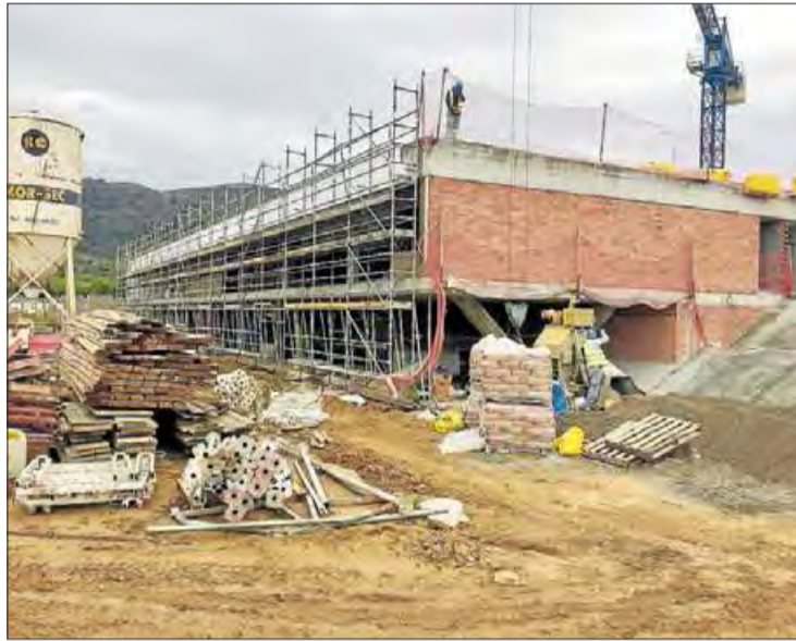
L'edifici en construcció de l'escola de Roses.

Els fonaments i l'estructura principal estan acabats, així com les parets de tancament exteriors i els paviments interiors. La coberta està gairebé acabada, mentre que avancen les obres de distribució interior d'aules i resta de de-