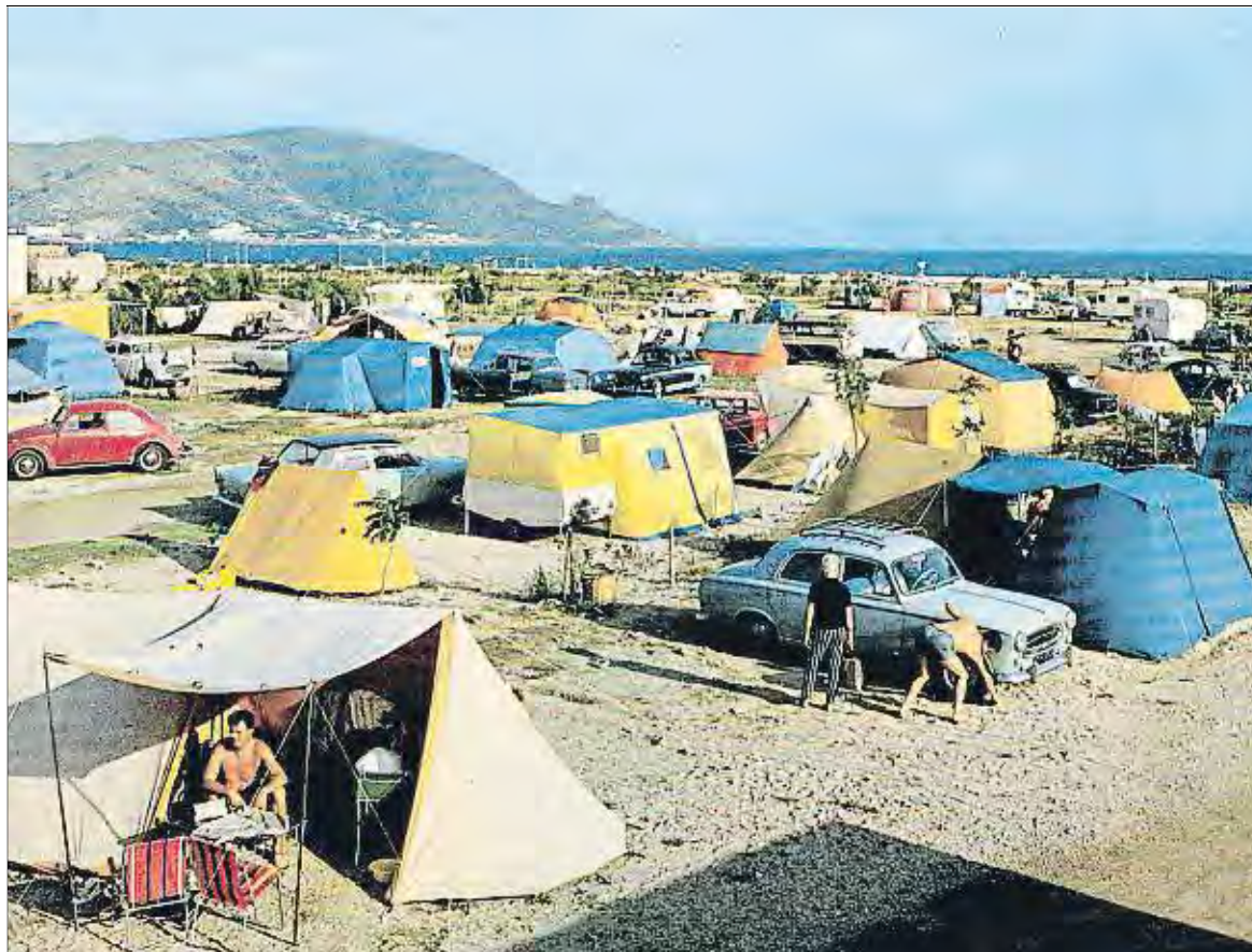
EXPOSICIÓ 60 ANYS DE CÀMPING A LA COSTA BRAVA / ARXIU

Seixanta anys després, el sector ha fet un gir de 180 graus. Piscines que no tenen res a envejar a les dels parcs aquàtics, supermercats, cellers, pistes poliesportives, solàrium, bungalows equipats amb tota mena de serveis (microones, aire condicionat, rentaplats, mobiliari de disseny...), restaurants d'alta cuina, saló d'estètica... ja s'han integrat a aquest tipus d'allotjament, que el 2016 va rebre més de 3 milions de turistes a Catalunya, un 9,3% més que el 2015, segons dades de l'Observatori del Treball de la Generalitat. Es tracta del perfil d'allotjament que va créixer l'últim any, per sobre d'hotels i apartaments turístics. Els càmpings catalans van sumar prop de 16 milions de pernотacions, de les quals més de la meitat van ser a Girona.