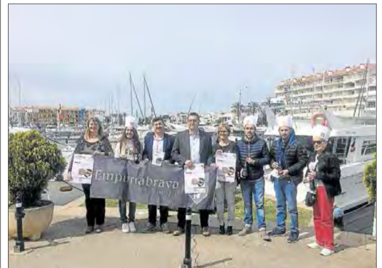
La presentació de l'activitat ahir a Empuriabrava.

Cada recipient conté una vàlvula per escalfar al microones sense destapar.