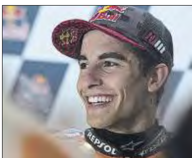
Márquez busca su segundo triunfo