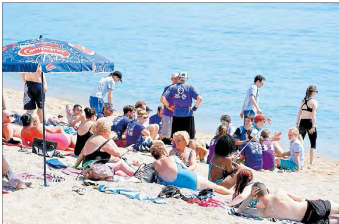
Les altes temperatures d'aquesta aquesta Setmana Santa van omplir platges com la de Lloret. MARC MARTÍ

La ubicació de l'anticicló a la meitat occidental de la península