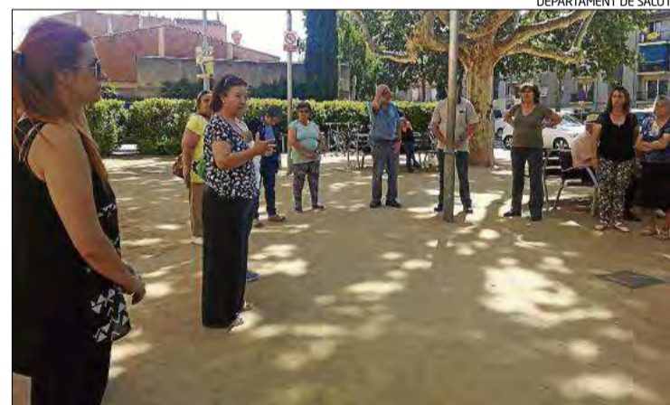
DEPARTAMENT DE SALUT

L'atenció a la fibromiàlgia es coordina des d'una Unitat Hospitalària Especialitzada (UHE), que en el cas de la Regió Sanitària de Girona està al Centre d'Especialitats Güell, a través d'un equip multidisciplinari en el qual hi intervenen reumatòlegs, internistes, rehabilitadors, psicòlegs, treballadors socials, infermers i metges de família, amb la coordinació del CatSalut. La UHE dona su-