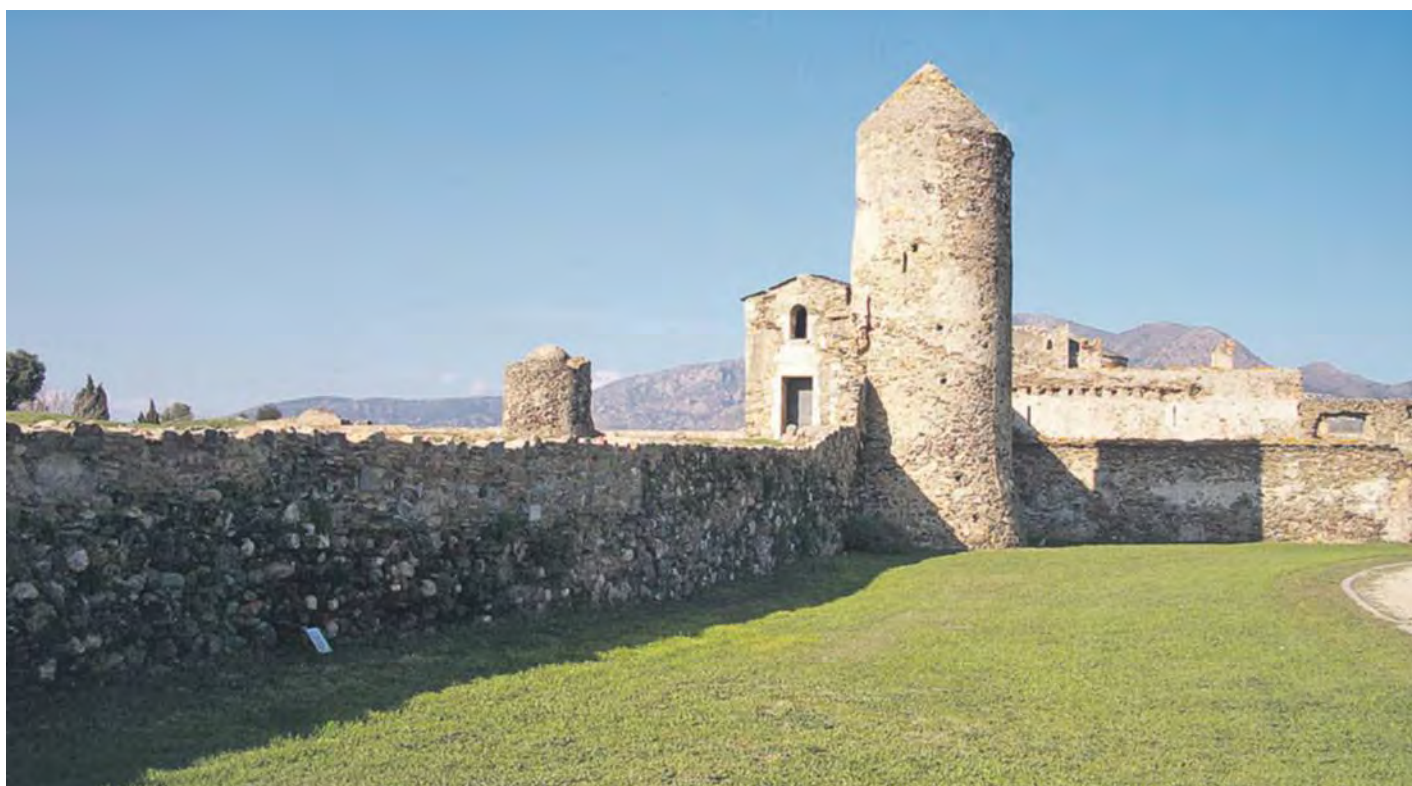
Dominant la badia de Roses, la fortificació amaga restes de l'època antiga.

LA CIUTADELLA DE ROSES ENGLOBA LA CIUTAT GREGA I ROMANA DE RHODE, EL NUCLI VISIGÒTIC I LA ROSES MEDIEVAL