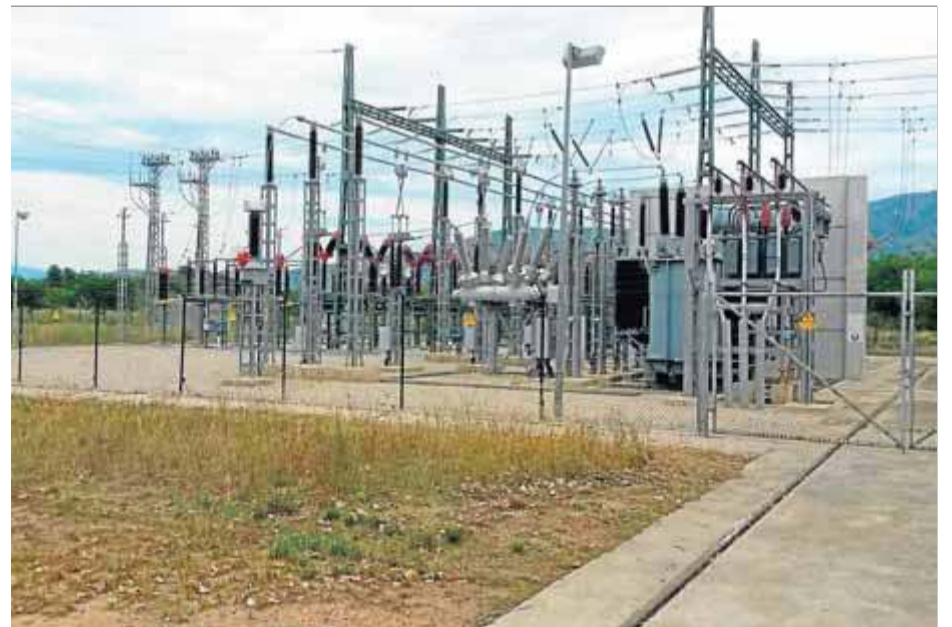
Una imatge de la subestació de Torrovent

ma instal·lat és més sofisticat que l'anterior, ja que unifica, en un sol dispositiu, totes les mesures que realitza sobre l'operació del transformador i permet obtenir informació més precisa i en més profunditat. Els sistemes de protecció dels transformadors mesuren i monitoren, de manera digital, diversos paràmetres que intervenen en el correcte funcionament d'aquests aparells, com la tensió, la intensitat i el consum. En cas de detectar una anomalia, el desconnecten automàticament per prevenir incidències. L'actuació realitzada permet augmentar, per tant, la