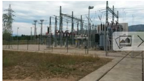
La subestació Torrent EMPORDA.INFO

EMPORDA.INFO Endesa ha finalitzat recentment les tasques de renovació a la subestació de Torrent, al terme municipal de Palau-saverdera, amb l'objectiu de millorar la qualitat del subministrament elèctric a un total de 50.407 clients de l'Alt i Baix Empordà. L'actuació ha consistit a instal·lar un nou sistema protectiu als transformadors, d'última tecnologia, més sofisticat que l'anterior ja que unifica, en un sol dispositiu, totes les mesures i operacions que es realitzen sobre els transformadors i permet obtenir-ne informació en profunditat. Aquesta actuació ha comportat una inversió de 30.000 euros per part de la Companyia i repercuteix en un millor servei a un total de 15 municipis repartits entre ambdues comarques empordaneses.