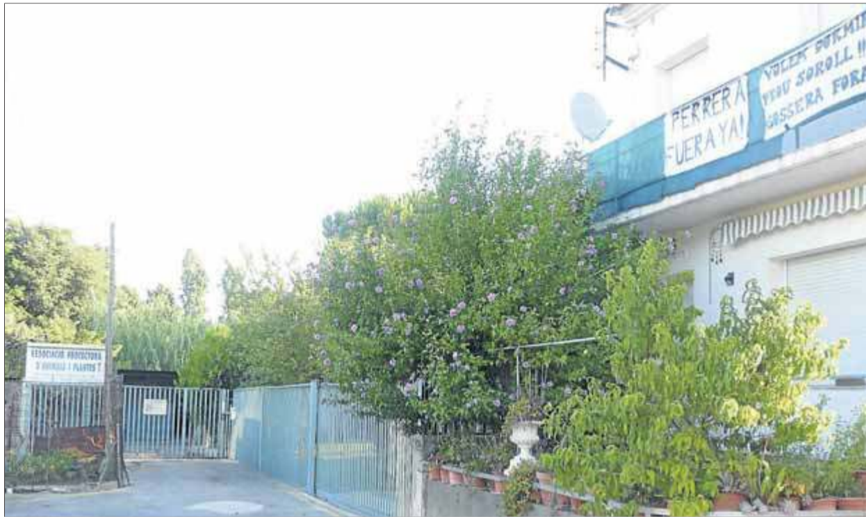
Alguns dels rètols que van aparèixer ahir a Figueres (a la dreta) i, al fons, les instal·lacions de la protectora ■ E. C.

Els veïns, amb el suport de l'associació del barri de l'Eixample, han fet una petició que ha recollit unes 200 firmes, en què reclamen el trasllat d'aquestes