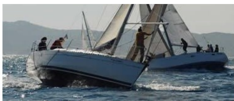
Regata d'interclubs de l'Empordà

interclubs Empordà. La interclubs és una regata per a embarcacions de creuers, organitzada pels següents clubs: Club Nàutic Port de la Selva