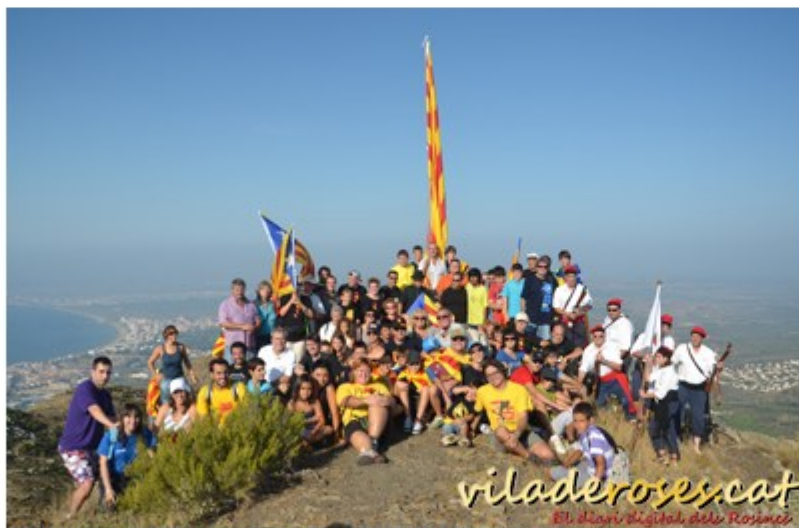
Pujada al Puig de l'Àliga de Roses al 2012

preparats, la sortida es va fer a les 8 hores, mitja hora abans de l'acostumat. I el trajecte, en lloc de fer-ho tot a peu, es va fer en cotxe fins la base militar del Pení. I d'allà, caminant fins al cim del Puig de l'Àliga.