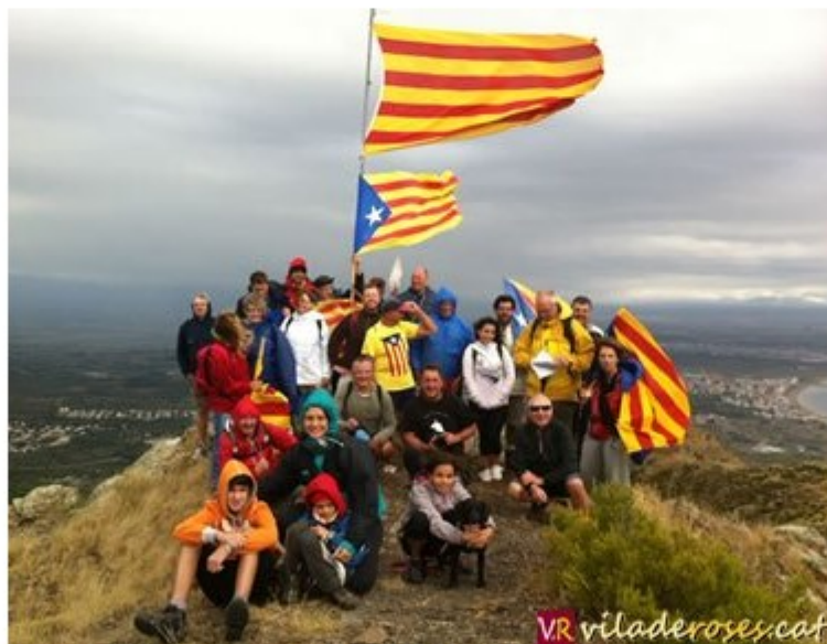
Els participants al cim del Puig de l'Àliga abans de sortir

La climatologia no ha acompanyat a la tradicional pujada del Puig de l'Àliga de Roses que des de fa 19 anys organitza l'Associació Excursionista Cabirols per la Diada Nacional de Catalunya. De bon matí, poc abans d'encetar de la pujada, prevista a les 8 des de la plaça del Teatre Municipal, ha caigut un ruixat sobre que ha fet que molta gent, que segurament tenia previst participar, es quedés a casa.