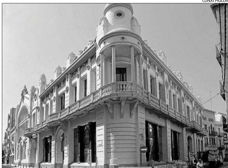
Les emblemàtiques façanes de l'equipament estan rehabilitades.

Durant tres anys, l'Ajuntament -que des del principi es va impli-