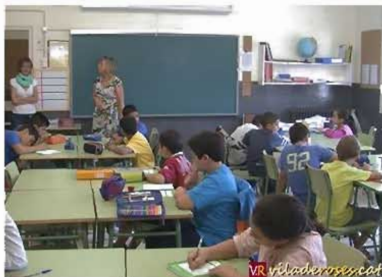
Inici del curs escolar