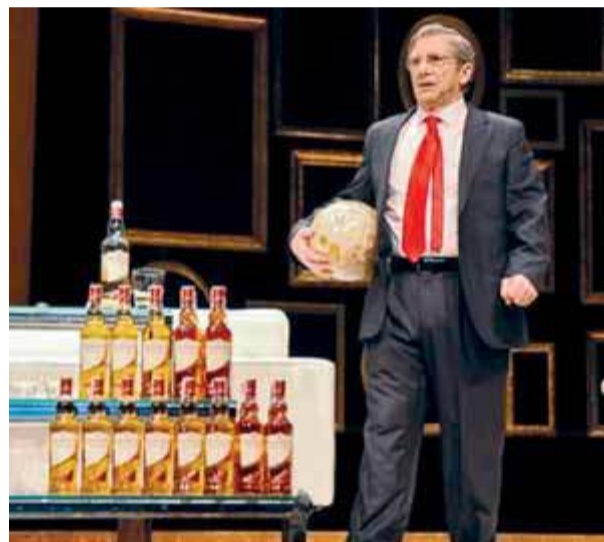
L'actor Joan Pera en una escena de 'Sí, primer ministre', que es podrà veure a Roses aquesta tardor ■ EL PUNT AVUI

La versió teatral de la sèrie televisiva Sí, primer ministre , dirigida per Abel Folch, serà (el 13 d'octubre) un dels principals atractius de la programació de final d'any al Teatre Municipal de Roses. Entre les deu propostes d'aquesta programació, Sí, primer ministre serà, en paraules d'Enric Matarrodona, responsable de la programació, la proposta d'èxit reconegut i més atractiva, però el Teatre de Roses oferirà també teatre comarcal i amateur