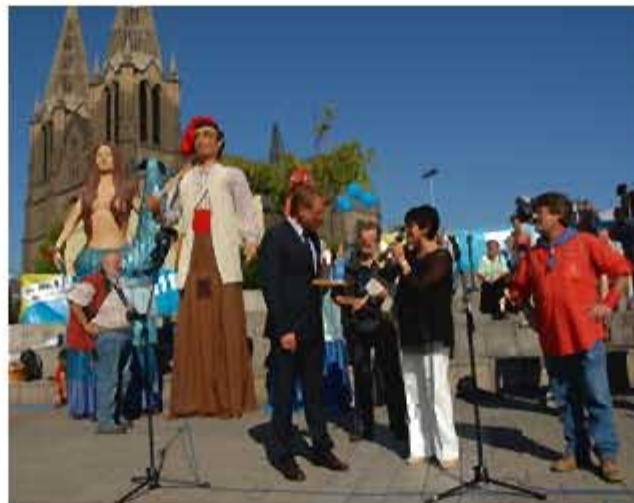
L'alcaldeessa de Roses i els gegants a Solingen. AR

La festivitat dels Ganivets, que és com popularment es coneix al municipi, és una de les festes més importants de Solingen. Enguany dins la seva celebració, i aprofitant el projecte d'Ambaixades Turístiques que ja fa més d'un any que aquesta ciutat alemanya comparteix amb Roses, els Gegants de Roses es van desplaçar el passat dijous 5 de setembre per portar un bocí de la cultura local rosinca a la ciutat alemanya