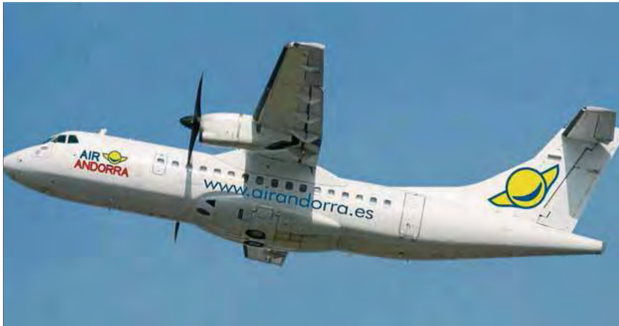
Un avió de la companyia Air Andorra, que té la seu a la terminal 2 de l'aeroport del Prat, enlairant-se ■ AIR ANDORRA

L'ajornament del llançament d'Air Andorra a l'aeroport de la Seu –on vol establir la seva principal base d'operacions– podia haver fet témer que l'anunciat vol diari Girona-Madrid d'aquesta companyia de nova creació corria perill. Des de la companyia aèria, però, afirmen just el contrari. Fonts d'Air Andorra han confirmat no només que la intenció de posar en marxa la ruta segueix en ferm, sinó que, a més, ara s'ha convertit en la seva prioritat: "Hem hagut de canviar l'estratègia que teníem prevista i, mentre discutim com podem iniciar els vols amb garanties a la Seu, ens centrarem a posar en marxa el vol Girona-Madrid, que és el que ens dona ara mateix seguretat", expliquen. Air Andorra assegura que ja té tots els permisos per operar des de Girona i que ara està tramitant el trasllat de personal que havia contractat per a la Seu a Girona. La intenció