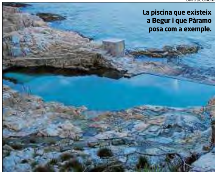
La piscina que existeix a Begur i que Pàramo posa com a exemple.

► Una vegada alliberat l'espai s'espera que se li doni un ús de lleure i turístic aprofitant la ubicació i generar llocs de bany