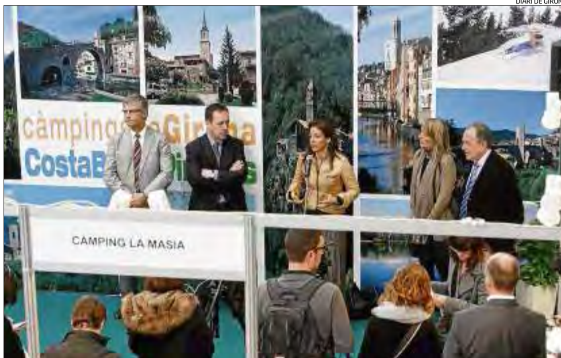
La fira Girocàmping, que celebrarà la tercera edició, serà peça clau en la promoció del sector.

Un dels aspectes principals del nou pla de promoció és la ruta internacional de fires que s'han marcat per donar a conèixer encara més els càmpings gironins arreu