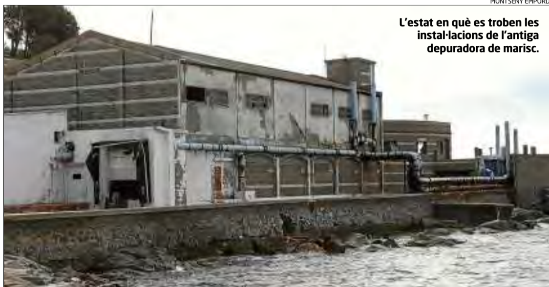
L'estat en què es troben les instal·lacions de l'antiga depuradora de marisc.