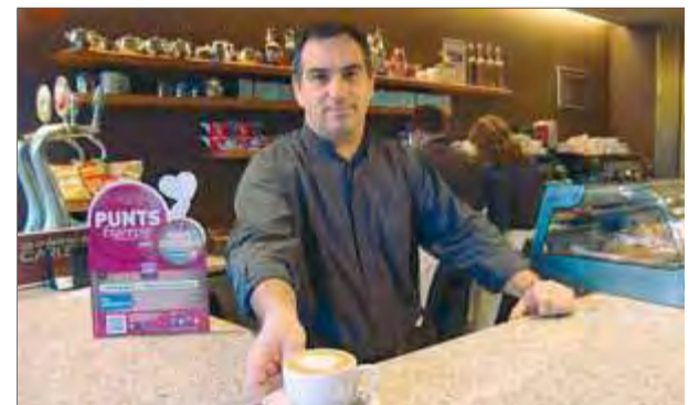
Al Carlemany és on se n'han servit més