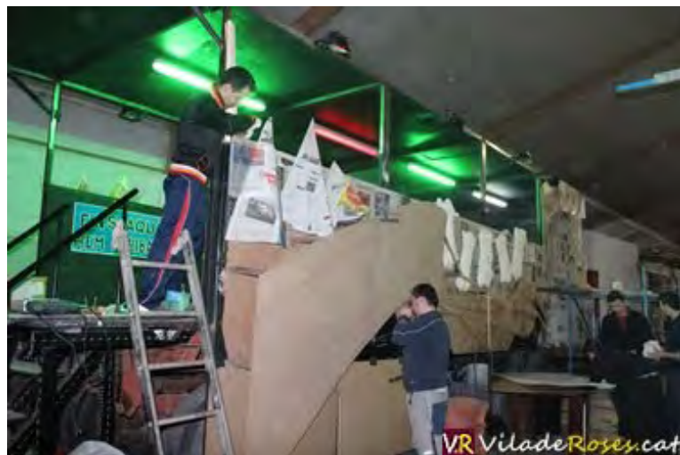
Alguns membres de la colla Fins Aquí Hem Arribat treballant en la seva carrossa