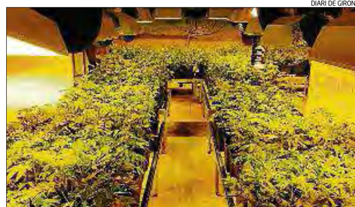
Havien habilitat el garatge de la casa d'Urtx per tenir-hi la plantació.

L'endemà van escorcollar la casa i es van intervenir 426 plantes en procés de creixement, quatre caixes de cartró amb diferents quantitats de marihuana asseccada preparada per a un consum im-