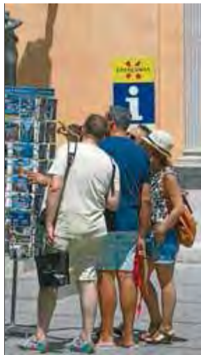
Turistes a Girona, el juliol passat ■ LLUÍS SERRAT

El Servei Meteorològic de Catalunya –el Meteocat– va fer ahir balanç en una nota del 2014 i una de les dades que va destacar per demostrar que havia estat "un any majoritàriament càlid" va ser el fet que a Girona ha estat el segon any més càlid des del 1950. També ho va ser a Lleida. I