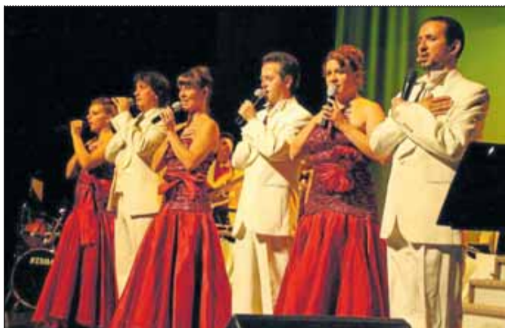
L'orquestra Costa Brava serà al poble per fer ballar a tothom.

FESTA MAJOR DE BORRASSÀ ▶ DIUMENGE 22 DE GENER