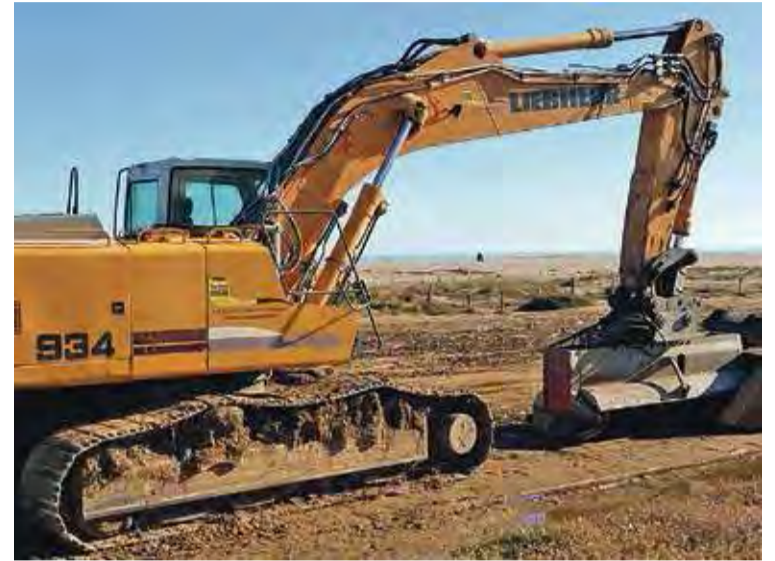
MAQUINÀRIA PESANT. Un dels sistemes utilitzats per la neteja dels recs HN

litoral que feien la funció de connector ecològic, de refugi i d'espai de cria per a moltes espècies. És per això que demanen a les administracions que prenguin consciència del valor i la importància de la protecció de la natura i de la biodiversitat i és pregunten "si el govern català, qui declara i manté els espais protegits, demanarà