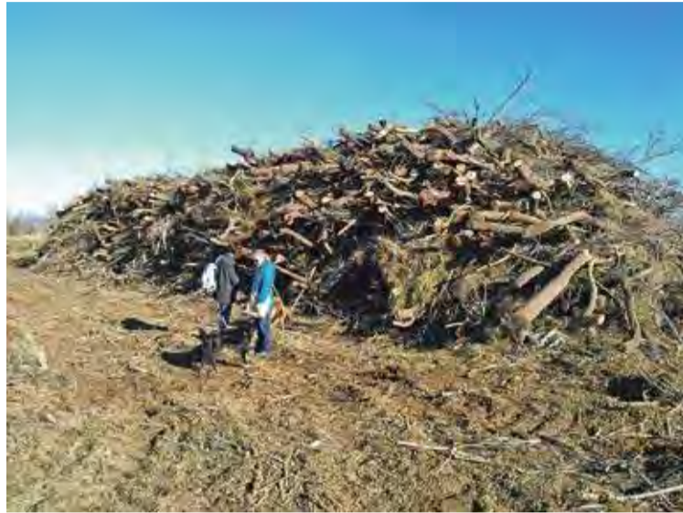
A PEU DE PLATJA. La pila de tamarius ha sorprès aquells que freqüenten la zona HN

En un comunicat, l'entitat diu que "l'Ajuntament només va informar de la neteja prevista però el parc no va demanar més informació i, sobretot, no va fer un seguiment i control de les actuacions