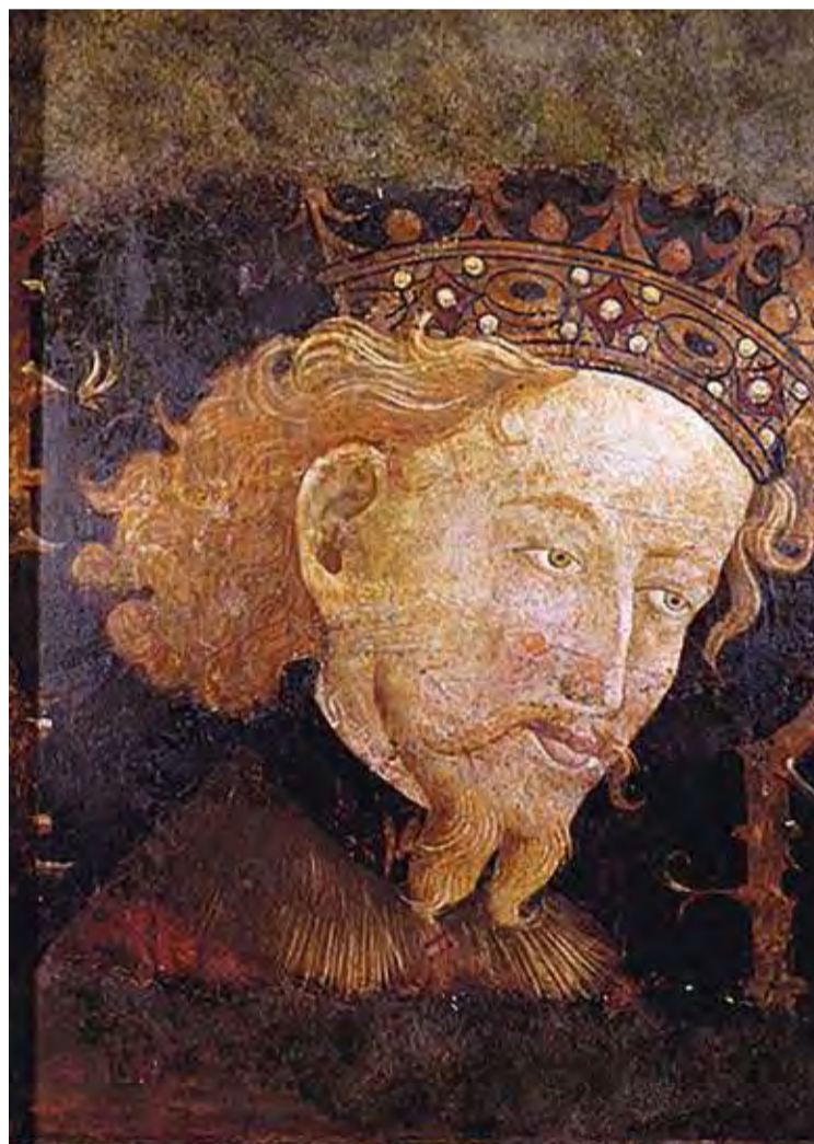
JAUME I. L'únic retrat que es conserva sobre el rei català

En qualsevol cas, la data del 21 de juny de 1267 marca un abans i un després en la història de l'Alt Empordà. Si bé és cert que consolida la població de Figueres, no deixa de ser evident que a partir d'aquell moment es va concretant la seva capitalitat territorial tant en l'aspecte polític i estratègic, com en el simplement mercantil. La celebració del mercat setmanal, que va agafant un caràcter comarcal, i les fires anuals que apleguen gent de tota la ro-