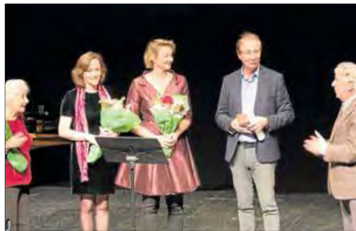
Un moment de l'acte, celebrat al teatre municipal de Roses.

Aquest acte va consistir en una conferència a càrrec d'un