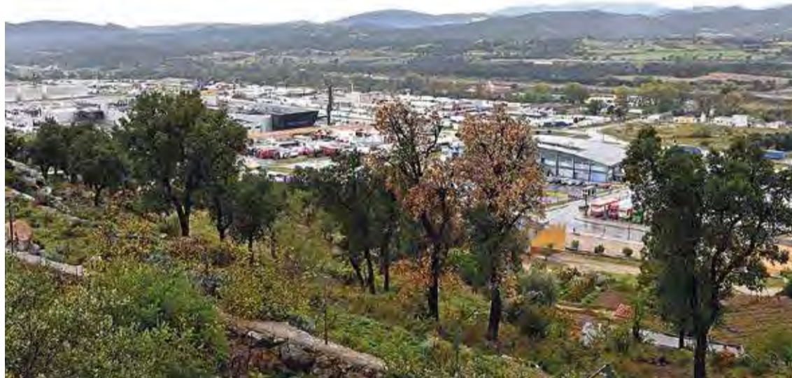
LA JONQUERA. És un dels municipis on van tenir lloc les xerrades

Aquestes són les principals mancances que han detectat la cinquantena d'empreses que han participat en les reunions de cooperació empresarial que va organitzar el Consell Comarcal durant els mesos de novembre i desembre del 2016. Les trobades s'emmarcaven en el projecte per millorar la competitivitat de les empreses que estan ubi-