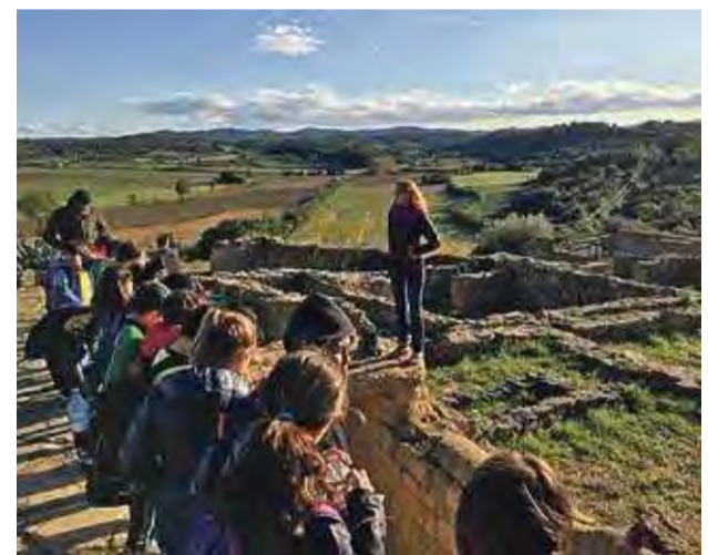
Els alumnes de sisè a Ullastret

Empúries, per tant, va ser habitada per grecs i romans. Ho podem saber perquè a l'any 1908, Josep Puig va fer que comencessin les excavacions dels jaciments. Es va excavar