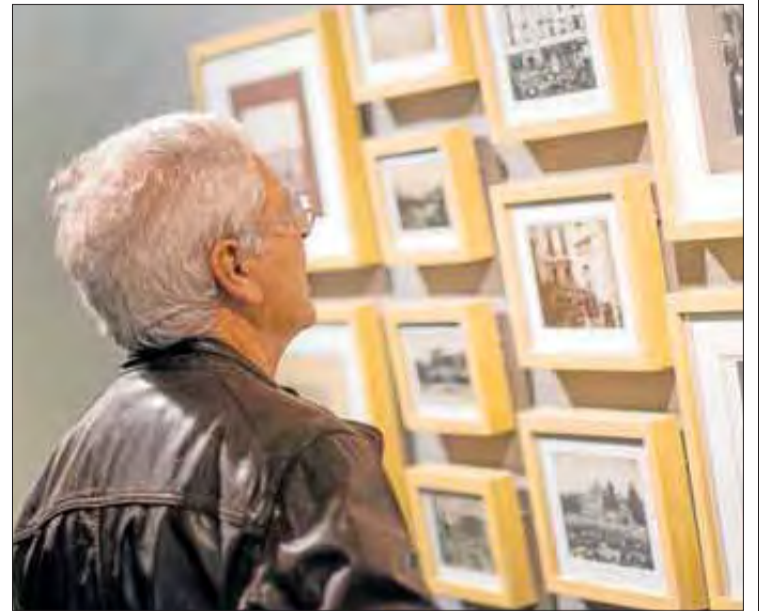
L'exposició està instal·lada a la sala oberta del Museu.