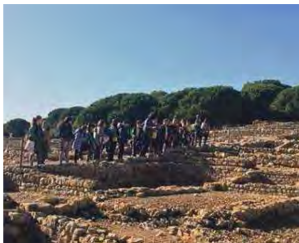
Els alumnes de cinquè a Empúries

Fins all segle III a.C. només hi havia una gran potència: Cartago, que era la colònia fenícia més poderosa de l'Imperi Cartaginès. Llavors, però, també va aparèixer Roma i les dues volien dominar més territori, motiu pel qual hi van haver tres guerres púniques. L'any 218 a.C. les tropes romanes varen arribar al port d'Empòrion i així varen poder guanyar l'última guerra contra els cartaginesos. Anys més tard, van començar a conquerir la península Ibèrica i van iniciar el pro-