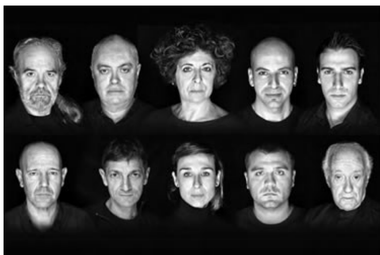
Els actors de La Funcional Teatre que protagonitzen “Advertència per a embarcacions petites”

El proper dissabte 18 de març, a les 21 h, el Teatre Municipal de Roses acull la representació de la darrera proposta de la companyia figuerenca La Funcional Teatre, “Advertència per a embarcacions petites”, darrer text escrit per Tennessee Williams abans de la seva mort. L’obra parla de cinc personatges que es troben cada nit en un bar, un refugi de les seves vides sense sentit, un lloc on parlar de les seves pors i passions.