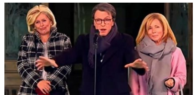
Una escena del programa Polònia.

La versió de Mas sobre la sentència del 9-N, a 'Polònia'