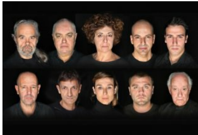
Imatge de l'elenc d'artistes

Aquest dissabte, a les 21 h, el Teatre Municipal de Roses acull la representació de la darrera proposta de la companyia figuerenca La Funcional Teatre, 'Advertència per a embarcacions petites', darrer text escrit per Tennessee Williams abans de la seva mort. L'obra parla de cinc personatges que es troben cada nit en un bar, un refugi de les seves vides sense sentit, un lloc on parlar de les seves pors i passions.