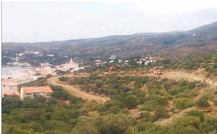
Màquines i camions tornen a actuar al sector de sa Guarda a Cadaqués, on hi ha pendent un projecte urbanístic d'un hotel de luxe i un centenar d'habitatsges ■ EL PUNT AVUI

Lloret, però, recorda que aquest projecte urba-