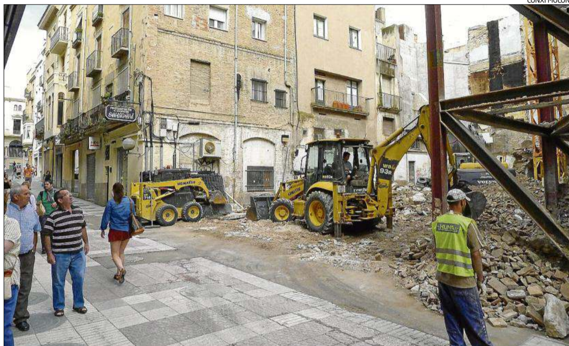
Les màquines treballant al carrer Peralada en l'enderroc de l'edifici.

La previsió és que els de la plaça de Dalí, amb una ubicació excepcional, puguin estar en funcionament aquesta temporada que està a punt de començar i que els del carrer Peralada amb el corriol de les Bruixes tardí encara un temps a ser realitat. I és que, en aquest cas, s'ha hagut d'enderrocar l'edifici i es tornarà a aixecar de nou. A la planta baixa i la primera i a la resta també s'hi faran apartaments turístics. Es convertiran així en dos espais dedicats al