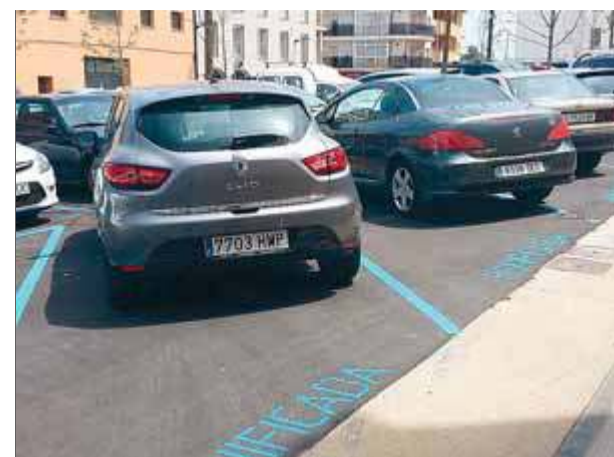
La zona blava d'estiu a l'Escala es va posar en marxa dilluns passat, amb més places i canvis en el servei

protegir una mina d'aigua que es troba just a sobre del traçat del vial i les oliveres centenàries, que són arrencades i apilonades al costat del nou vial. ■