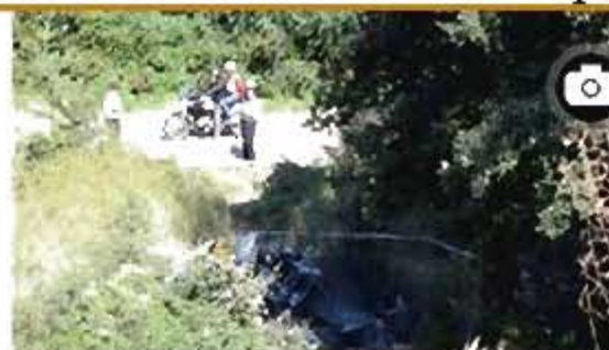
Accident d'helicòpter a Vilanant